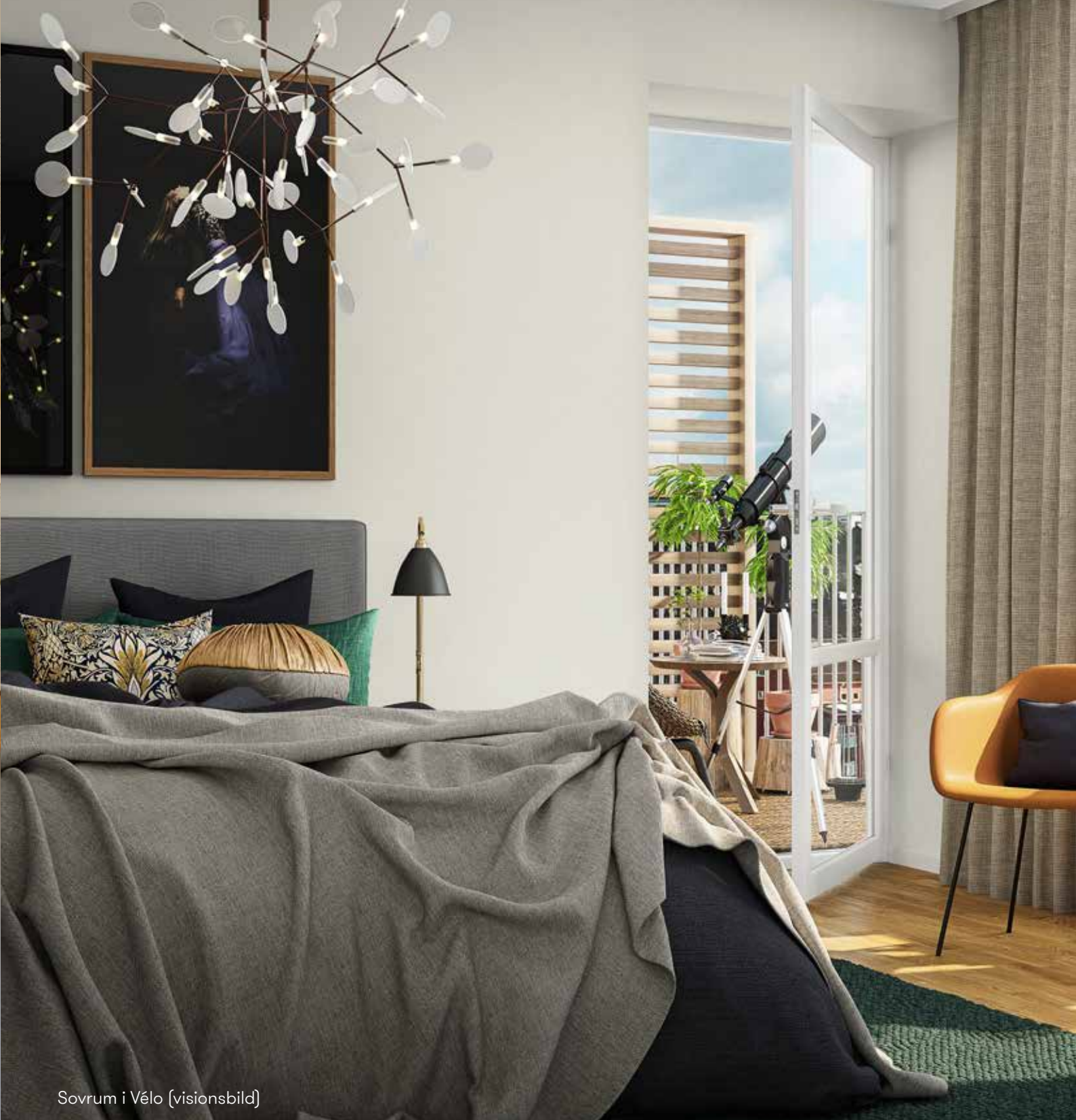
Sovrum i Vélo (visionsbild)