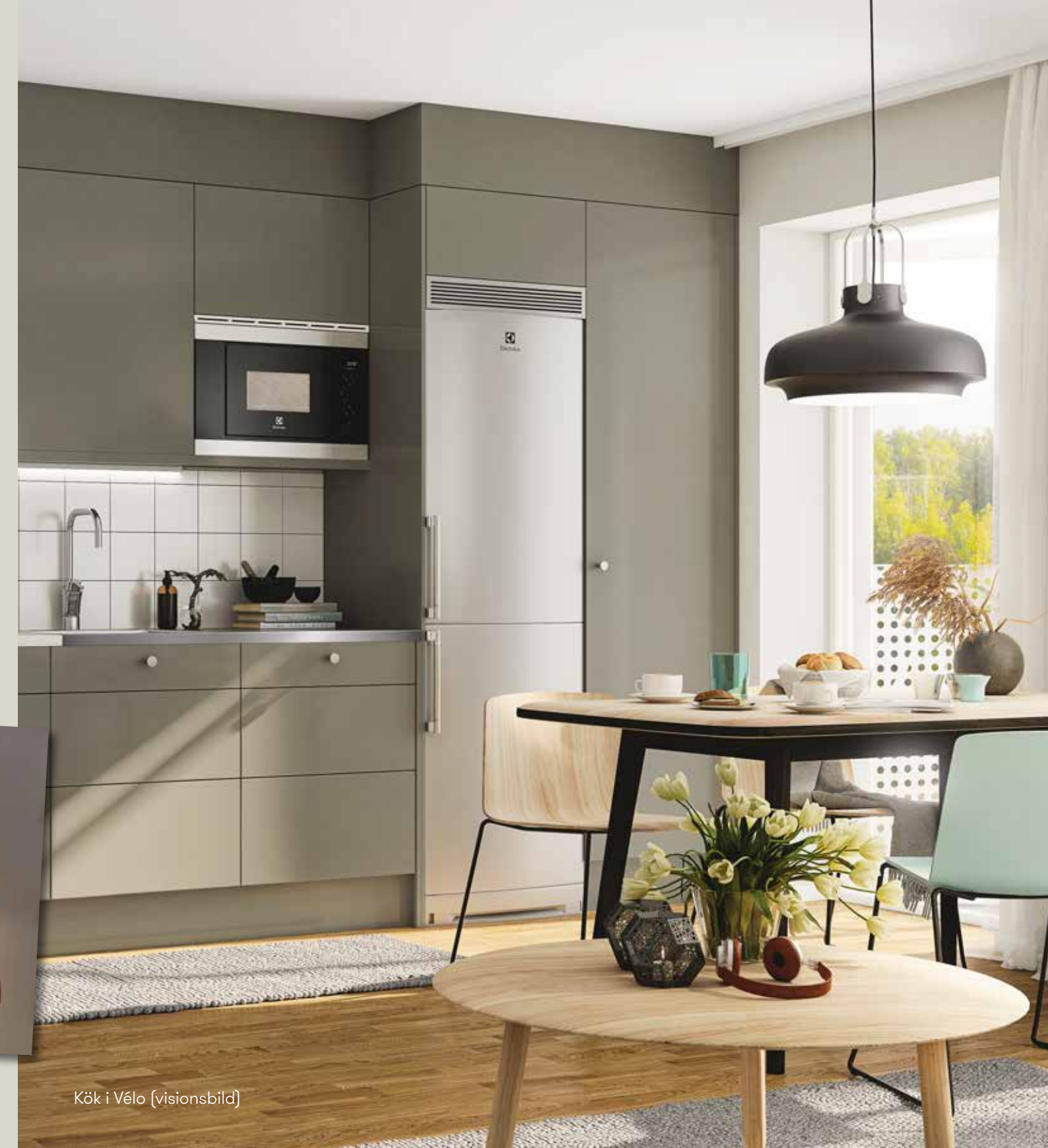
Kök i Vélo (visionsbild)