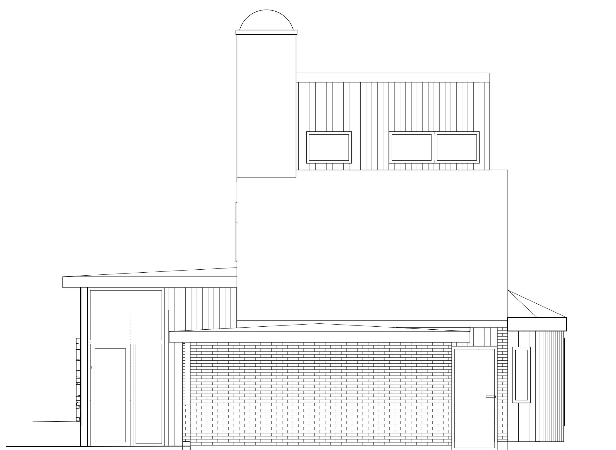
Fasad mot söder, nytt utseende 1:50

SKALA 1:50 i A1-format (1:100 i A3-format)