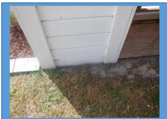
Panel/beklädnadsbrädor nära mark