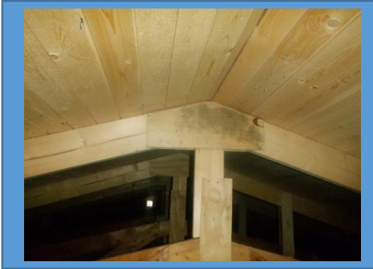
Mikrobiella missfärgningar vind