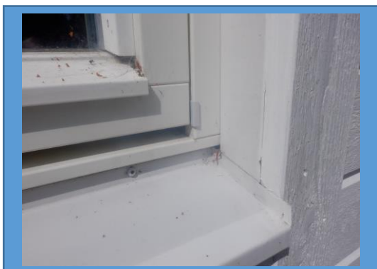
Glipor gaveluppvik fönsterbleck