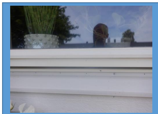
Avsaknad av infästning fönsterbleck