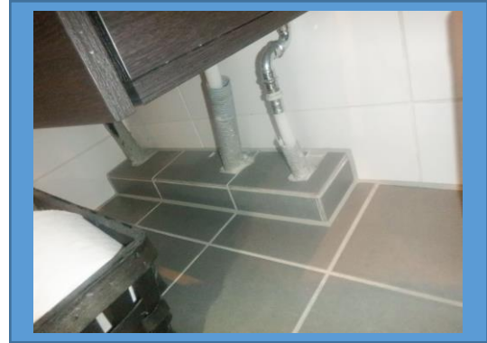
Rör i golv nära vägg i badrum