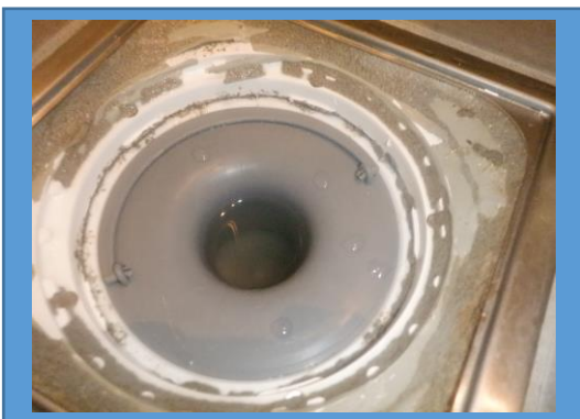
Brunnsmanschett synlig under klämring i golvbrunn