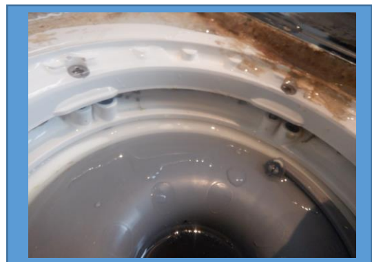
Brunnsmanschett synlig under klämring i golvbrunn