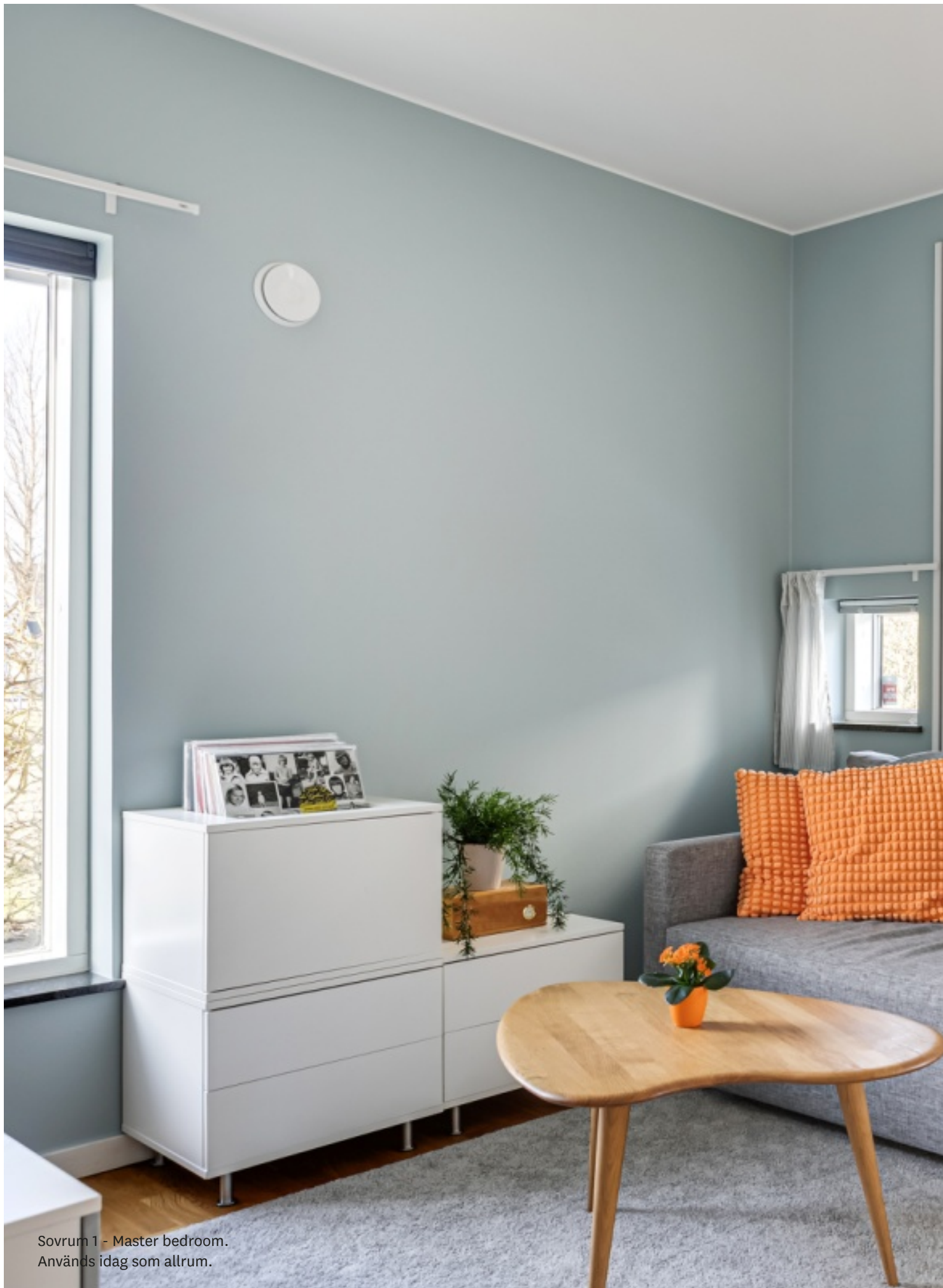
Sovrum 1 - Master bedroom. Används idag som allrum.