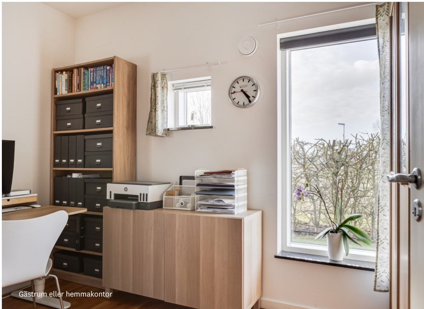
Gästrum eller hemmakontor