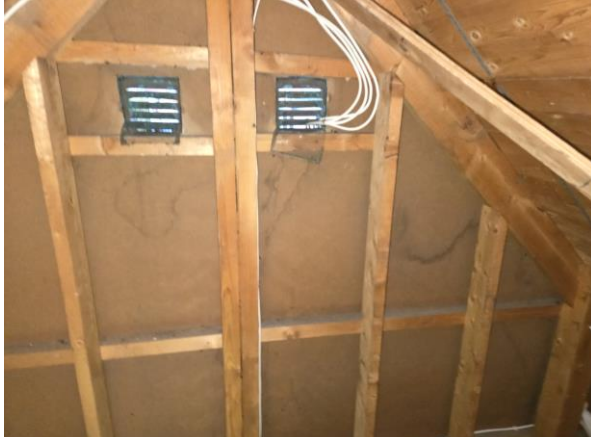
Fuktmärken på gavelspets.