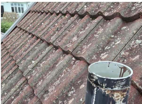
Glipa mellan ytterrör och innerrör på avloppsluftningen.