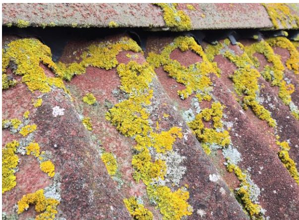
Mossa på tak. Skador på nocktätning under nockpannor.