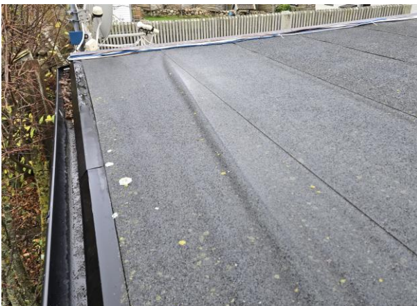
Luftbubbla i takpapp.