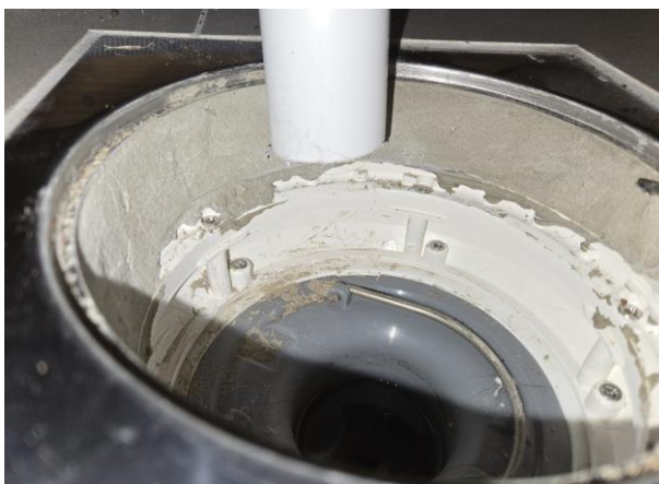
Bruk mellan klämring och klinkerram.