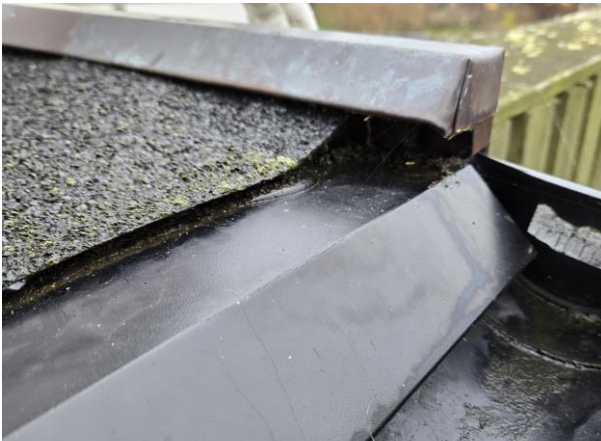
Glipa mellan takpapp och takfotsplåt.