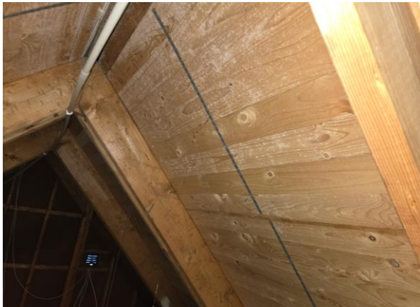
Mikrobiell påväxt på delar av yttertaketets insida.