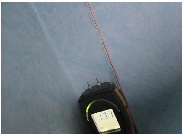
Glipa i svetskarv i duschutrymmet. Inga förhöjda fuktvärden noterades vid besiktningstillfället.