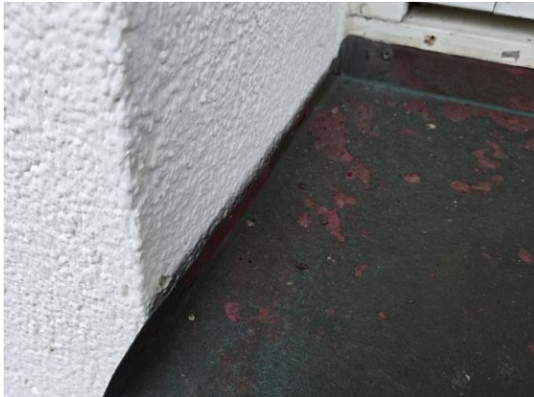
Finns ingen putskant/droppkant på fönsterbleck.