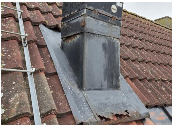
Rostskador på ventilationshuv.