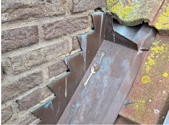
Glipåa mellan skorsten och plåt.