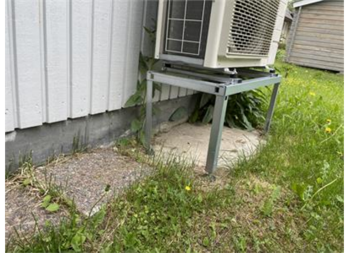
Värmepumpen saknar kondensvattenavledning.