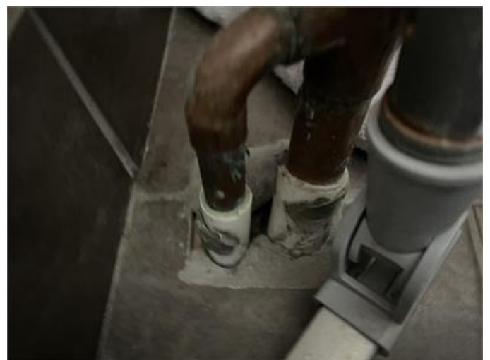
Otättheter noteras i golv vid rör tvättstuga/groventré.