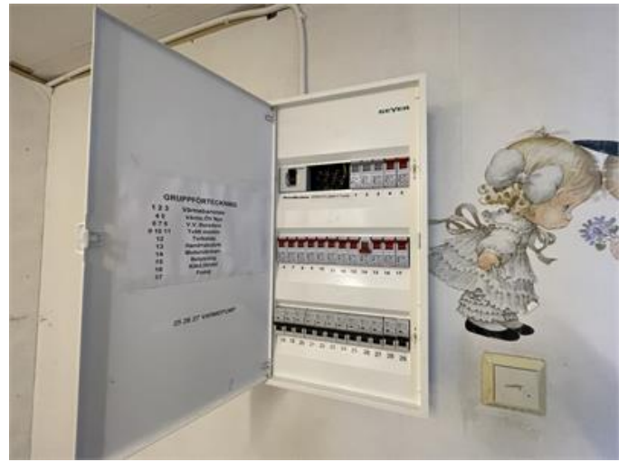
Elcentral är bristfällig, täcklock/bricka saknas delvis.