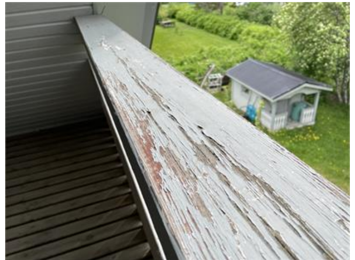
Trädetaljer på balkong har underhållsbehov.