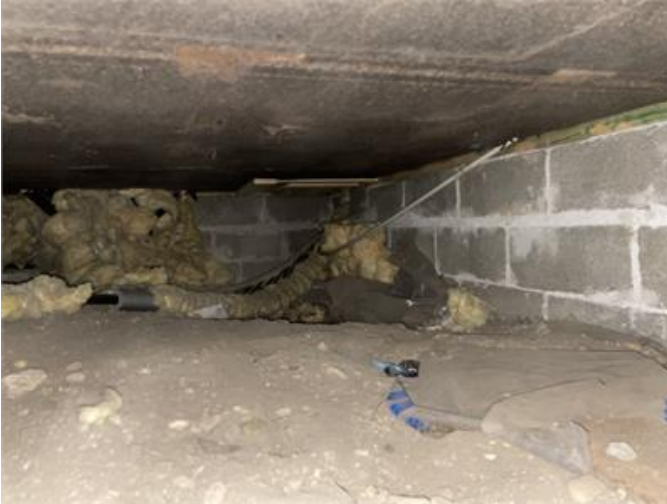
Kondensskydd/plastfolie saknas, byggspill och trärester förekommer på marken i krypgrunden.