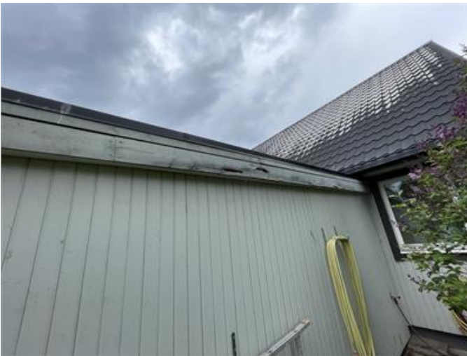
Låglutande tak på delar av huset. Trädetaljer på tak har lokalt rötskador.