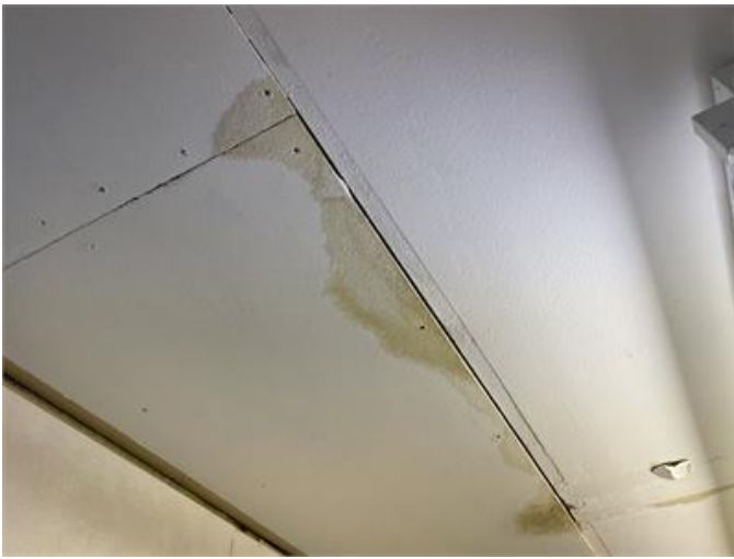
Fuktfäckor noteras på tak och vägg förråd entréplan.