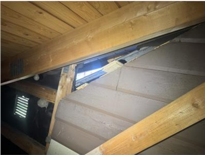
Öppning i vägg mellan yttertaken.