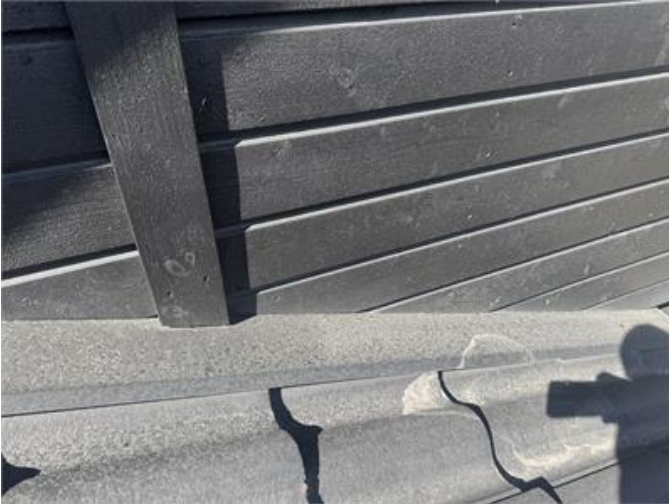
Fasadpanel som avslutas dikt mot krönplåt.