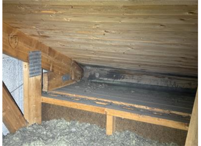
Missfärgningar utmed takfoten på vindsutrymmet.