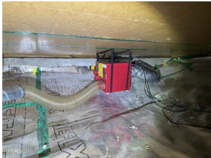
Avfuktare i krypprunden.