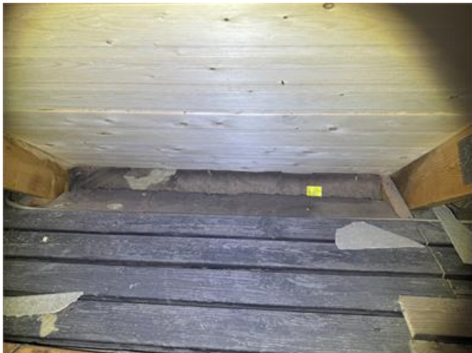
Takfotsventilation som är igensatt.