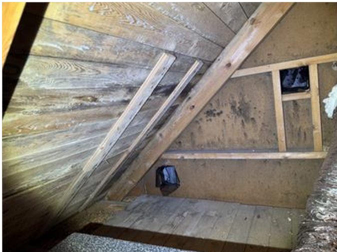
Mikrobiell påväxt på sidovind.