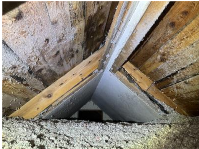
Bild tagen pånockvind.