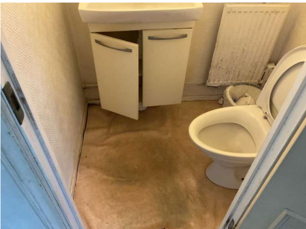
Bild 5: Invändigt, Entréplan, Wc, Spår av fuktskador finns på väggar och golv Golvspånät är mjukt, förhöjda fuktvärden noterades i golvet samt i nederkant på väggar