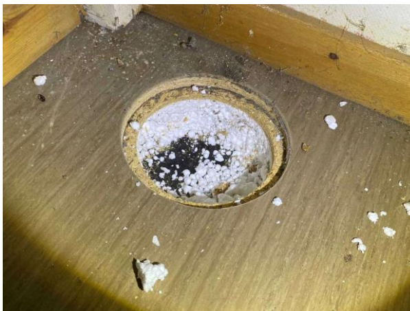
Bild 8: Invändigt, Entréplan, Trappförråd, Inga förhöjda fuktvärden noterades i golvet