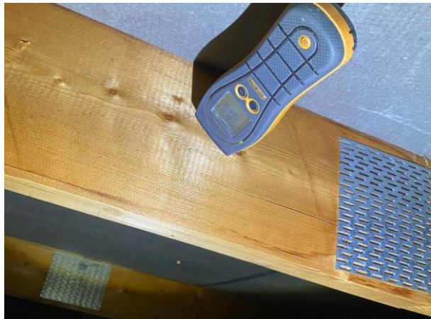
Bild 4: Utvändigt, Vind, Huset är självdragsventilerat, se riskanalysen Inga förhöjda fuktvärden noterades