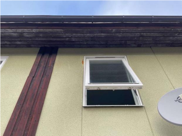
Bild 1: Utvändigt, Fasad, Utslag finns i putsen Spricka noterades i fasaden vid altandörren