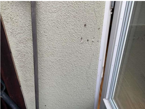
Bild 3: Utvändigt, Fasad, Spricka noterades i fasaden vid altandörren