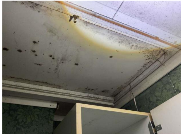
Bild 14: Invändigt, Övre plan, Förråd, Missfärgningar på tak och runt vindslucka