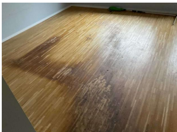
Bild 9: Invändigt, Entréplan, Vardagsrum, Skador noterades i golvet Inga förhöjda fuktvärden noterades