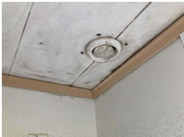
Bild 19: Invändigt, Övre plan, Badrum, Äldre våtrum Plattor har släppt på golvet Fönster är olämpligt placerat i duschzonen Det förekommer rörgenomföringar i golv för annat än avl...