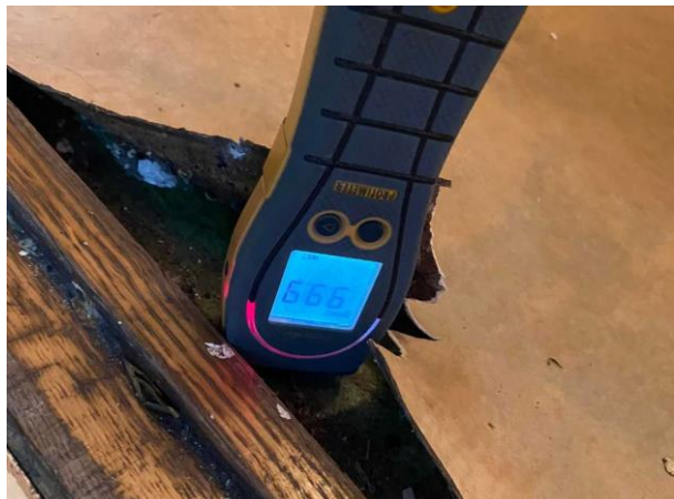
Bild 6: Invändigt, Entréplan, Wc, Spår av fuktskador finns på väggar och golv Golvspånät är mjukt, förhöjda fuktvärden noterades i golvet samt i nederkant på väggar