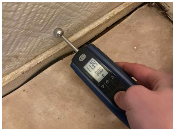
Bild 7: Invändigt, Entréplan, Wc, Spår av fuktskador finns på väggar och golv Golvspånet är mjukt, förhöjda fuktvärden noterades i golvet samt i nederkant på väggar Se fortsa...