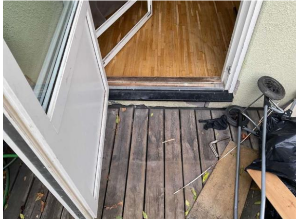
Bild 2: Utvändigt, Fasad, Utslag finns i putsen Spricka noterades i fasaden vid altandörren