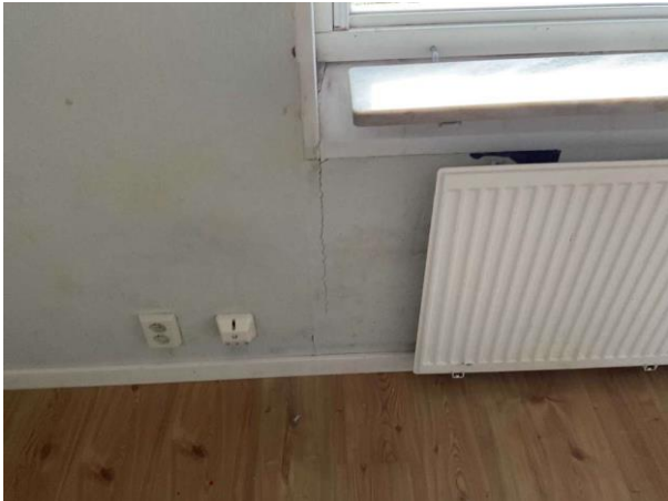
Bild 13: Invändigt, Övre plan, Sovrum 2, Sprickan noterades på väggen under fönster