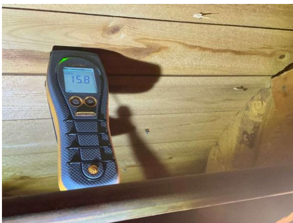
Bild 10: - Utvändigt, Vind, fuktkontroll utförd under gränsvärde se bilaga 4...