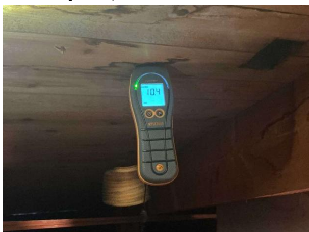
Bild 11: - Utvändigt, Vind, fuktkontroll utförd under gränsvärde se bilaga 4