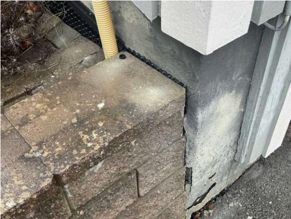
Bild 1: Utvändigt, Mark, synlig platonmatta som är bristfälligt tätad i ovankant