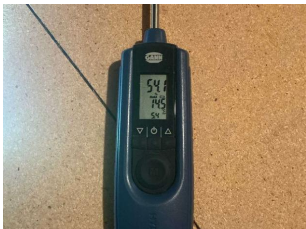
Bild 7: - Utvändigt, Vind, fuktkontroll utförd under gränsvärde se bilaga 4