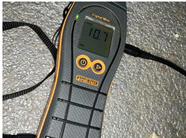
Bild 4: - Utvändigt, Grund, fuktkontroll utförd under gränsvärde se bilaga 4