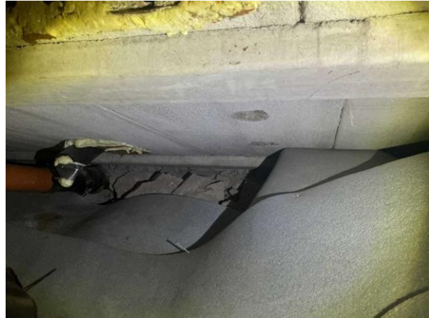
Bild 2: - Utvändigt, Grund, isoleringsmatta finns i grunden men är bristfälligt utlagd