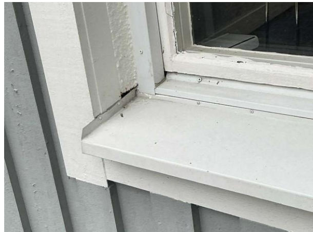
Bild 6: - Utvändigt, Fönster, Äldre bristfälligt tätat vid fönsterblecken