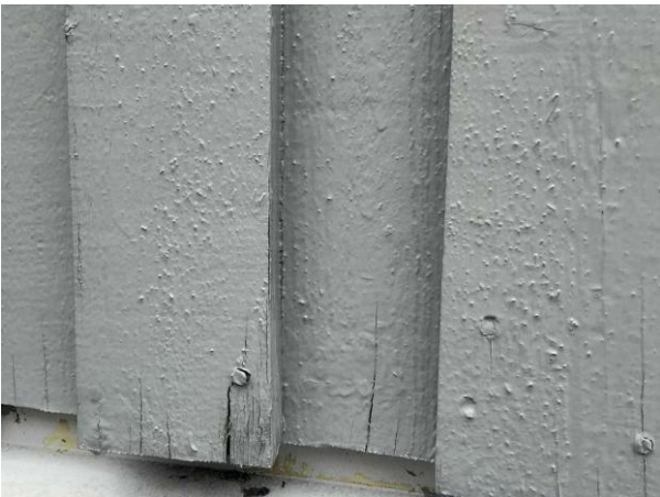
Bild 5: Utvändigt, Fasad, Färgsläpp och torrspäckor noteras på fasaden