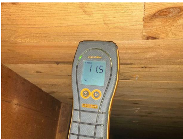
Bild 8: - Utvändigt, Vind, fuktkontroll utförd under gränsvärde se bilaga 4