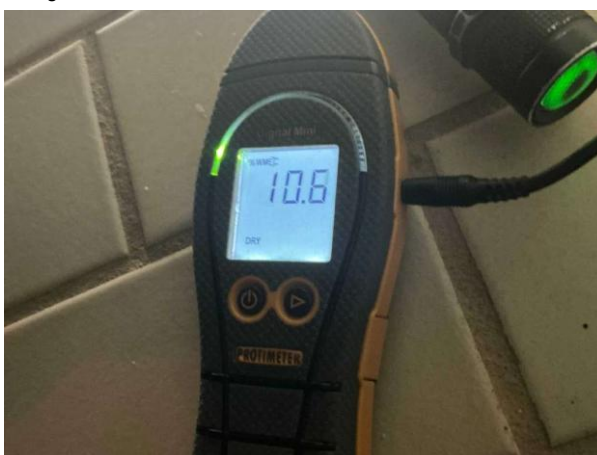
Bild 12: - Invändigt, Soutterrängplan, fuktkontroll utförd under gränsvärde se bilaga 4