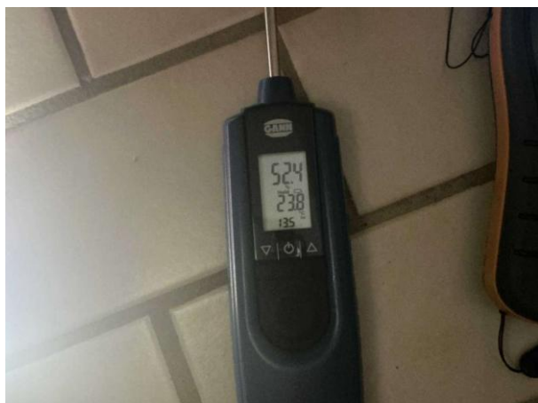
Bild 13: - Invändigt, Souterrängplan, fuktkontroll utförd under gränsvärde se bilaga 4