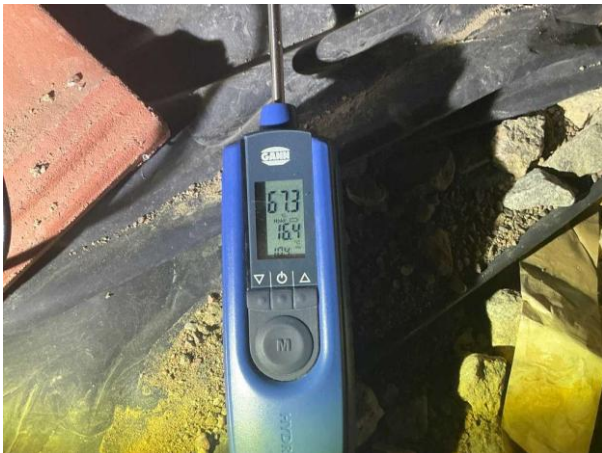
Bild 1: - Utvändigt, Grund, Krypgrund Fuktkontroll utförd under gränsvärde se bilaga 4...