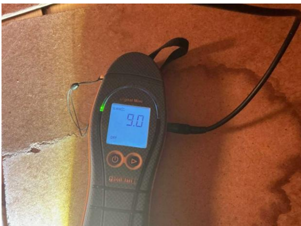
Bild 5: Utvändigt, Vind, Fuktkontroll utförd under gränsvärde se bilaga 4