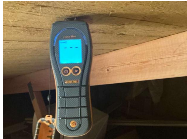
Bild 4: Utvändigt, Vind, Fuktkontroll utförd under gränsvärde se bilaga 4