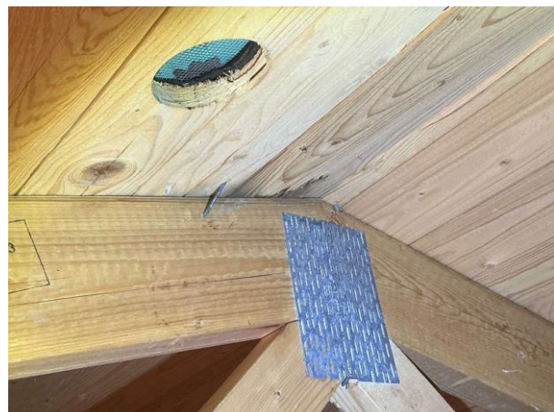
Bild 6: Utvändigt, Vind, Lokalt noteras det missfärgning (mikrobiellpåväxt)