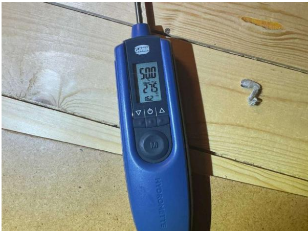
Bild 3: Utvändigt, Vind, Fuktkontroll utförd under gränsvärde se bilaga 4