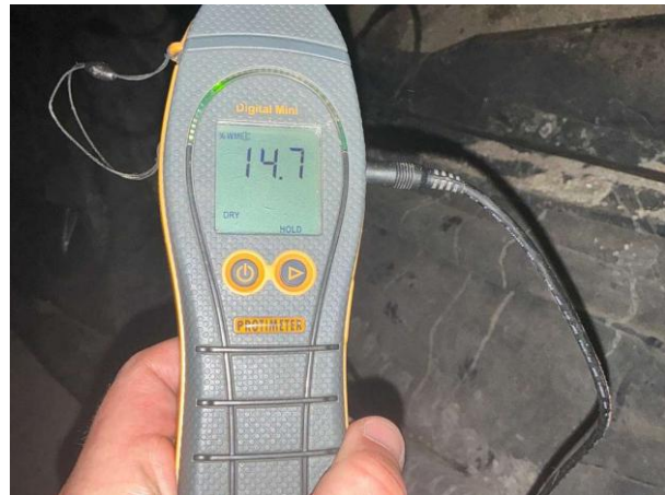
Bild 2: - Utvändigt, Grund, Krypgrund Fuktkontroll utförd under gränsvärde se bilaga 4...