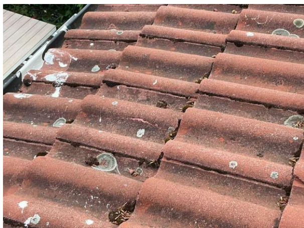
Bild 7: - Utvändigt, Yttertak, Äldre tak Mossa noteras på takpannorna