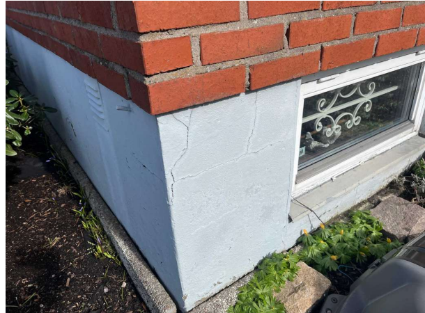
Bild 2: Grundläggning, Utvändigt noteras lokala mindre sprickbildningar på grundmurar. Sprickorna bedöms i sin nuvarande form ej påverka byggnadens goda bestånd, men bör ...