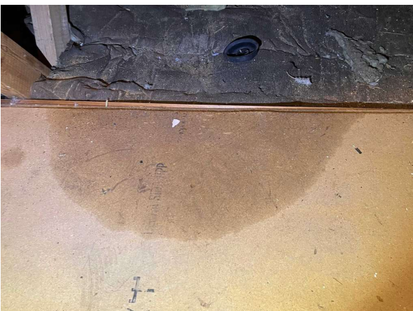
Bild 5: Vind, Lokala fuktrosor noteras på insida yttertak samt på gavel och golv. Fläckarna var torra vid stickprovskontroll men bör markeras och hållas under up...