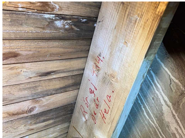
Bild 4: Vind, Lokala fuktrosor noteras på insida yttertak samt på gavel och golv. Fläckarna var torra vid stickprovskontroll men bör markeras och hållas under up...