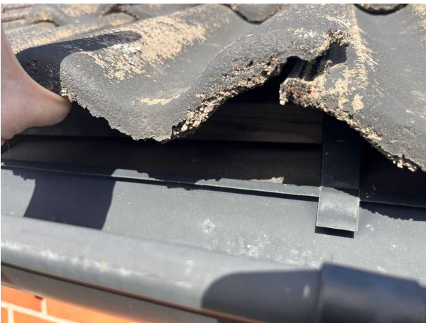
Bild 3: Tak, Så kallat nockband och fotplåt saknas. Dessa kan monteras för att minska slitaget på underlagspappen.