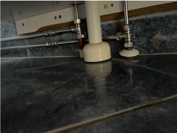
Bild 7: -Entréplan, Rör genomföringar noteras i golv under handfat. Se Riskanalys.