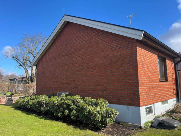
Bild 1: Mark, Det förekommer närliggande planteringar. Se Riskanalys.