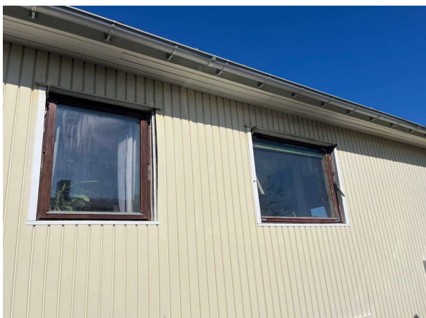
Bild 1: Utvändigt, Fönster/Dörrar, Äldre fönster i vardagsrum och hall är i behov av underhåll/byte.