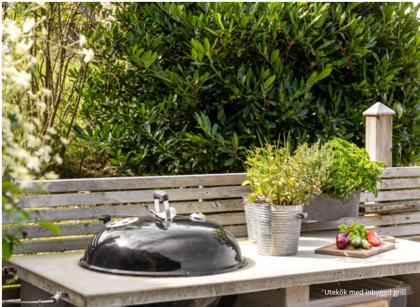
Utekök med inbyggd grill