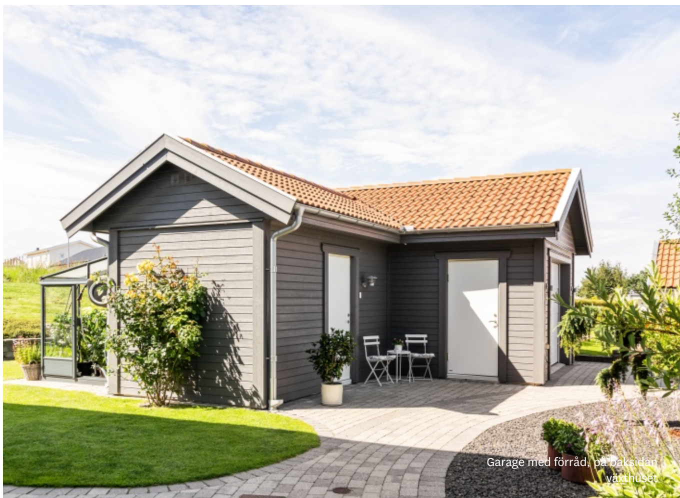
Garage med förråd, på baksidan växthuset