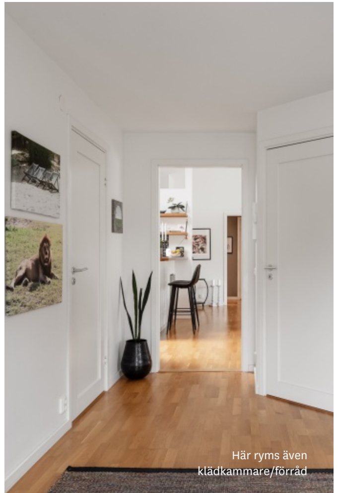
Här ryms även klädskammare/förråd