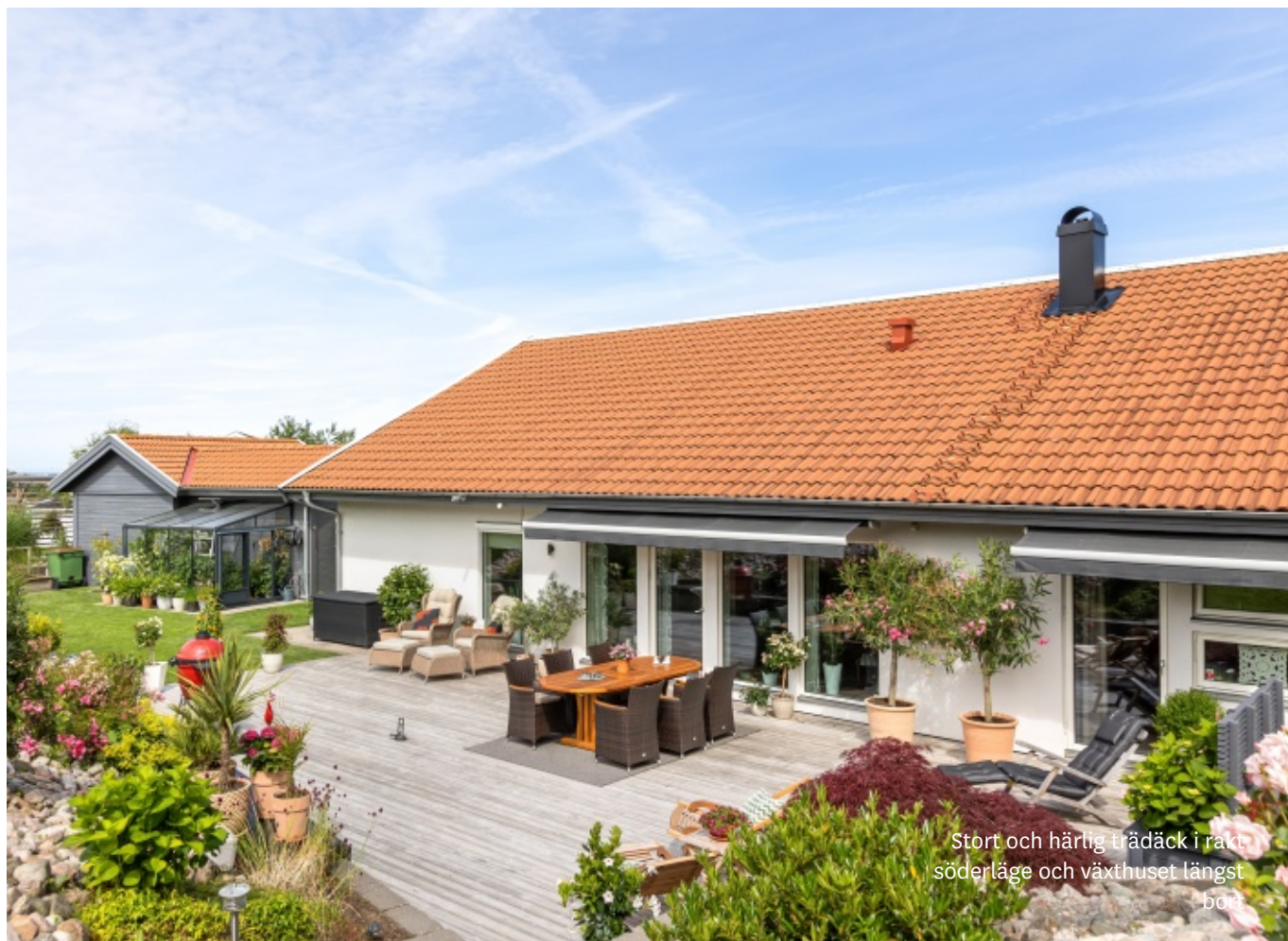
Stort och härlig trädäck i rakt söderläge och växthuset längst bort