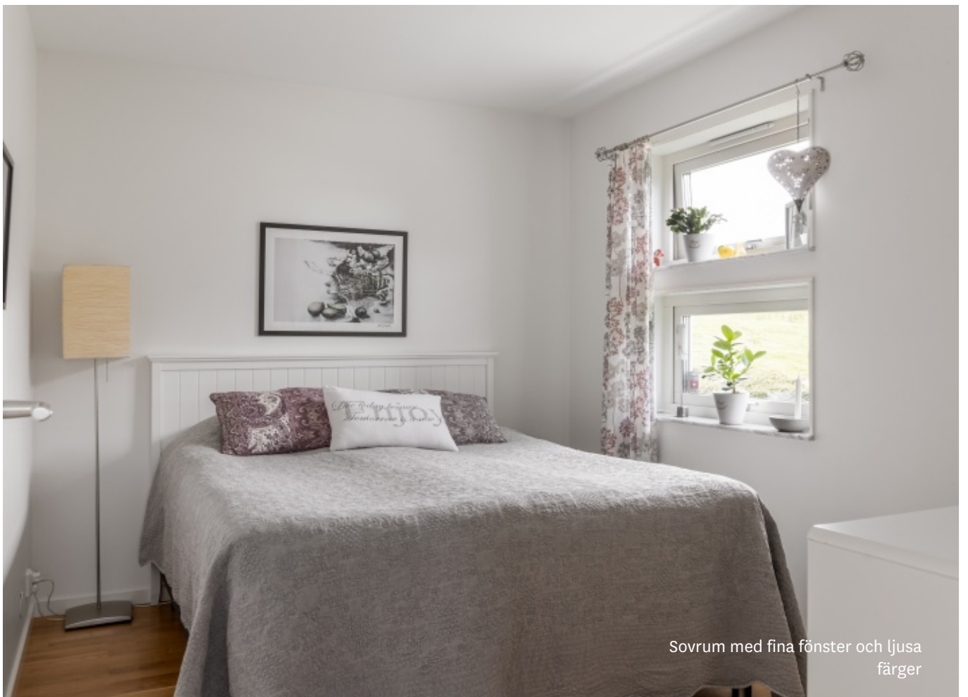
Sovrum med fina fönster och ljusa färger