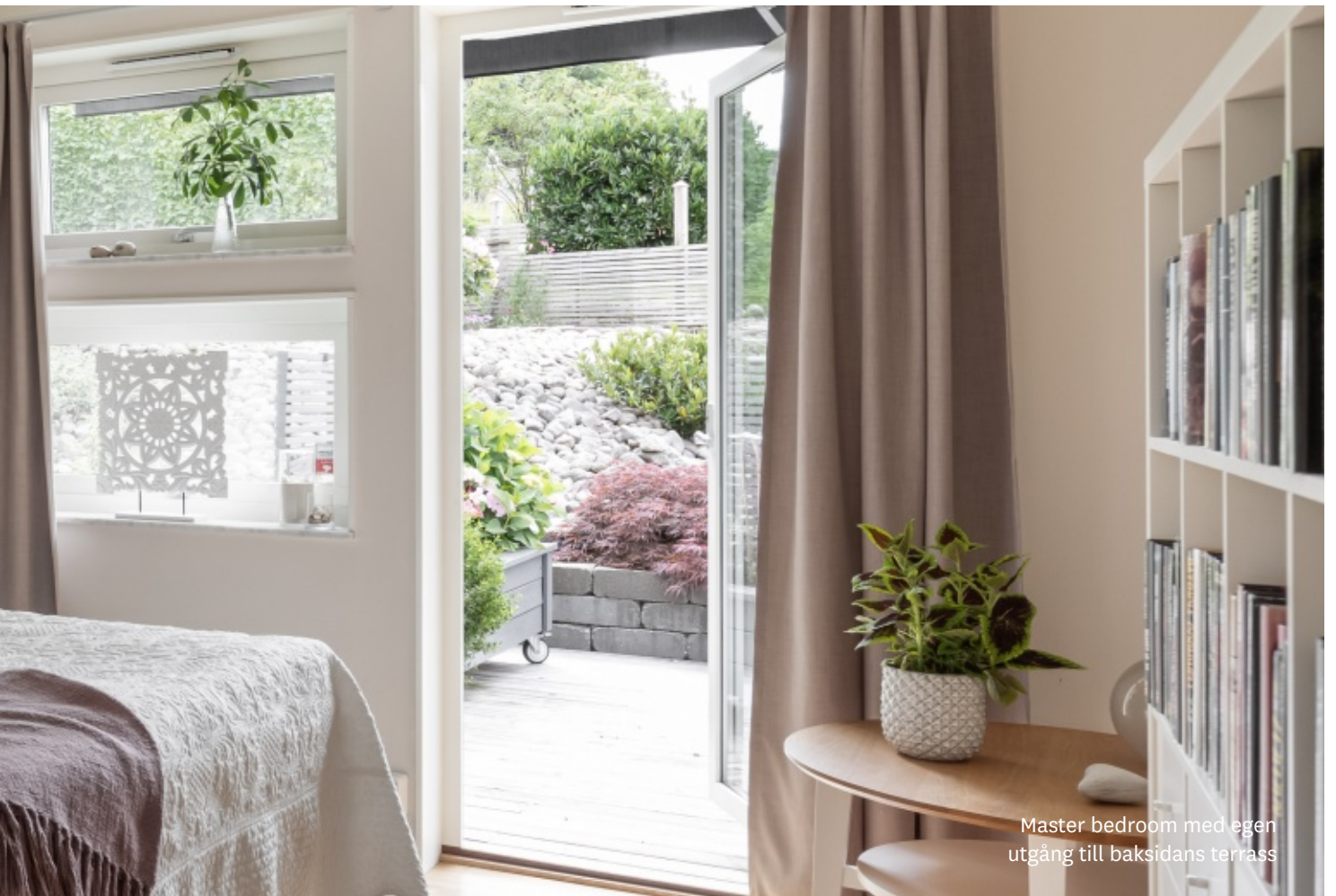
Master bedroom med egen utgång till baksidans terrass