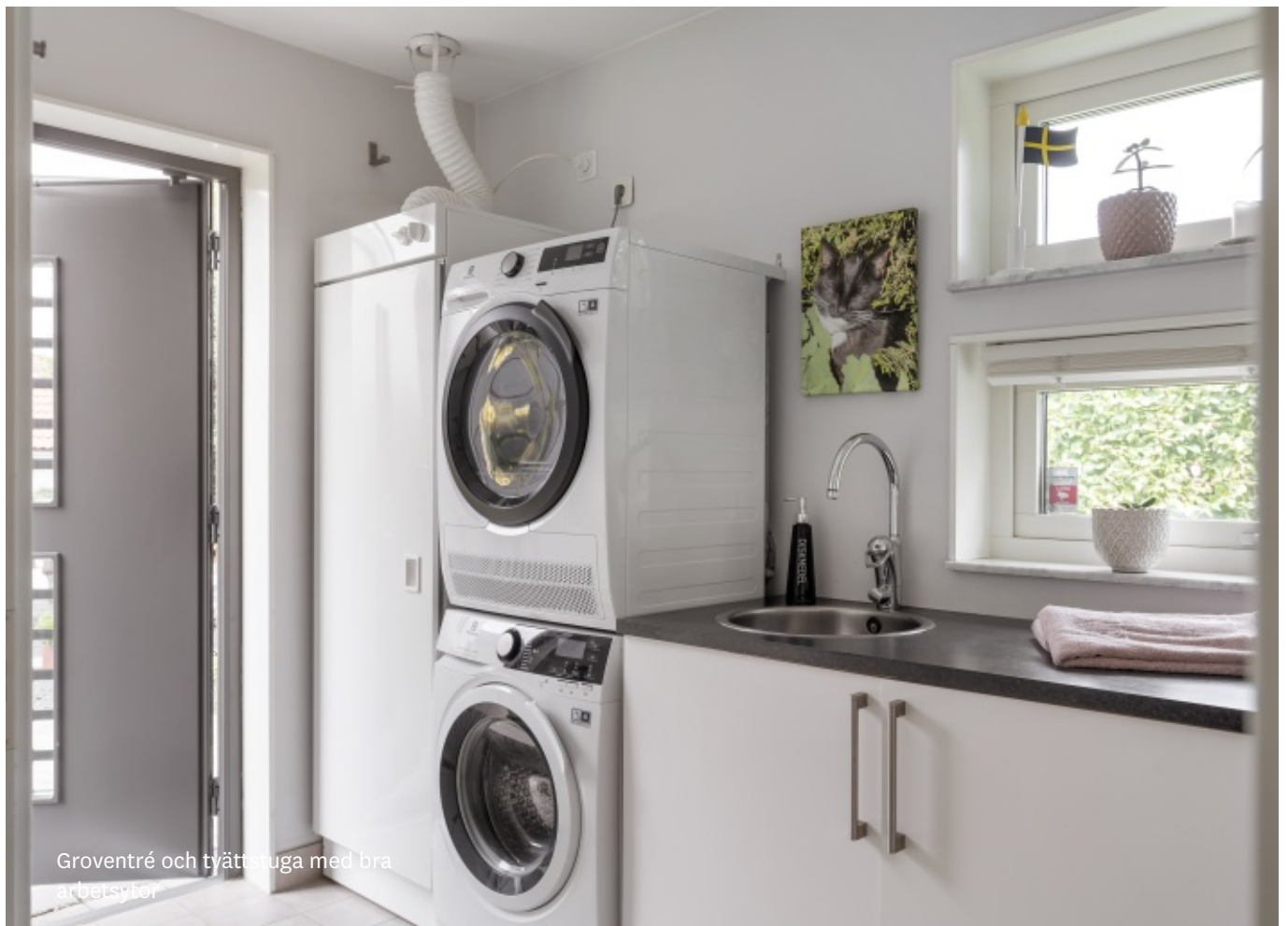
Groventré och tvättstuga med bra arbetsytor