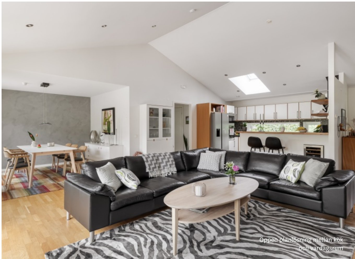
Öppen planlösning mellan kök och vardagsrum