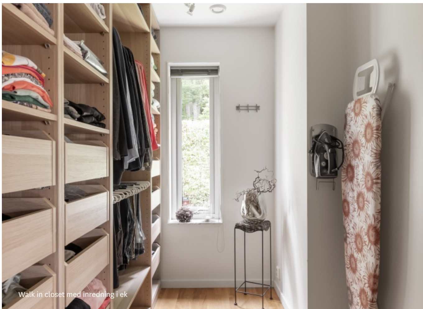
Walk in closet med inredning i ek