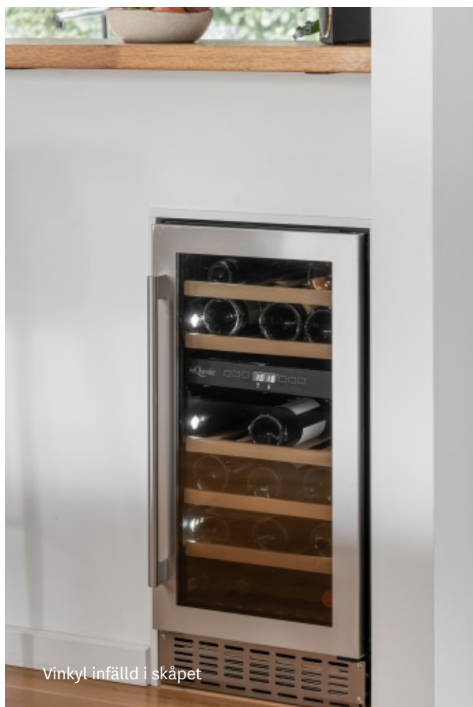
Vinkyl infälld i skåpet