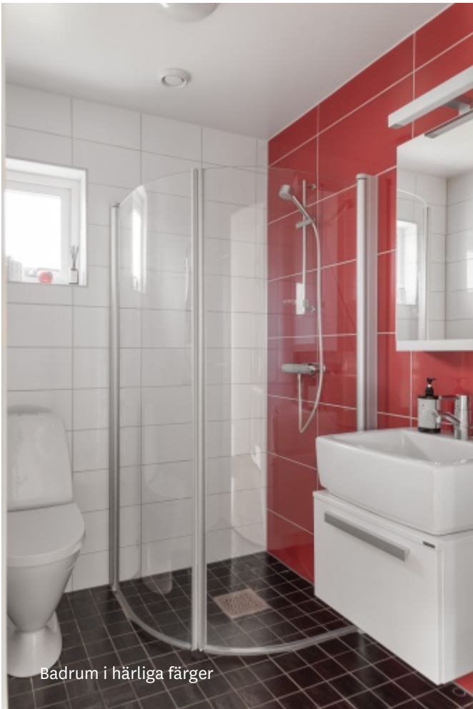
Badrum i härliga färger