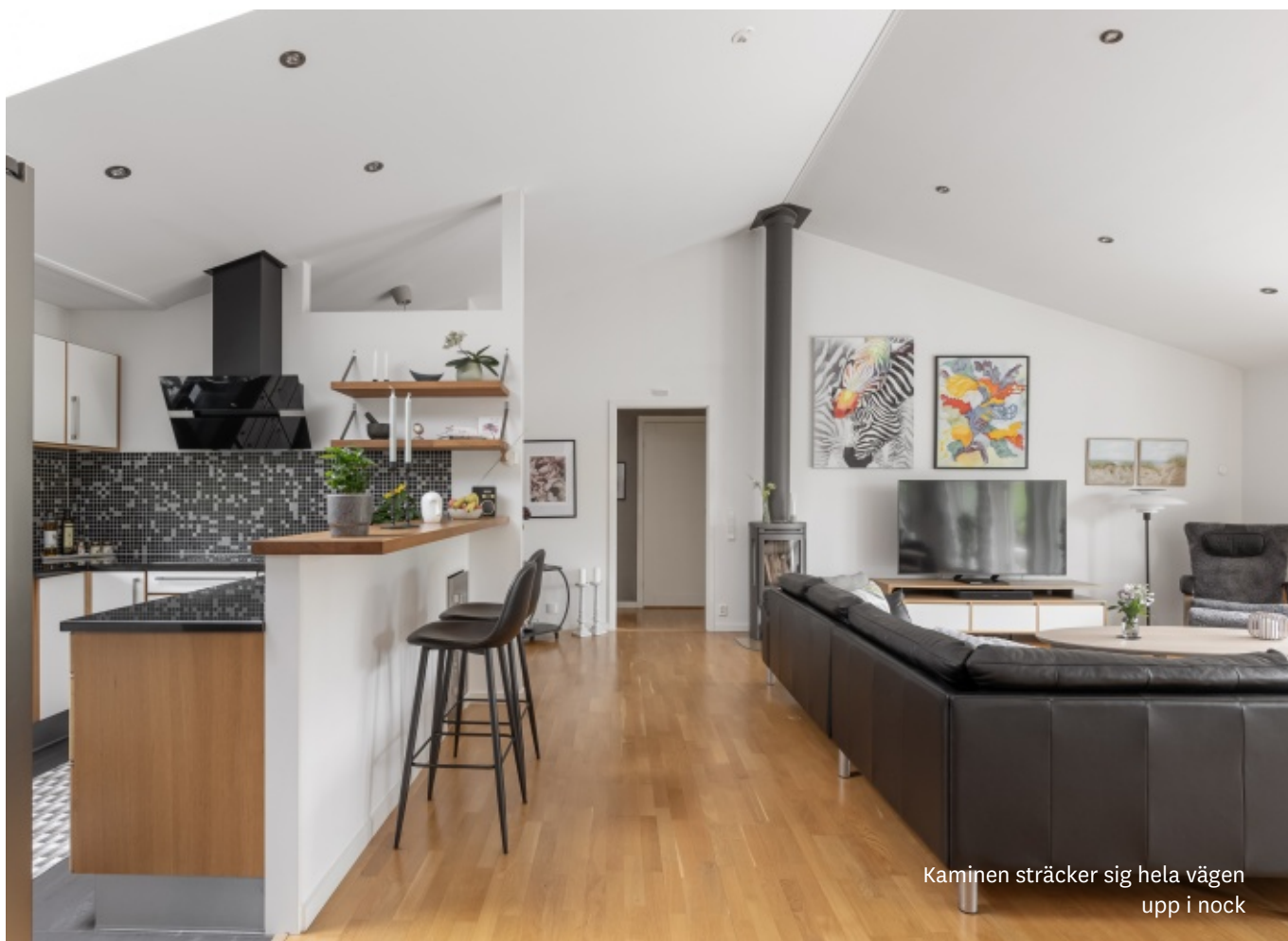
Kaminen sträcker sig hela vägen upp i nock