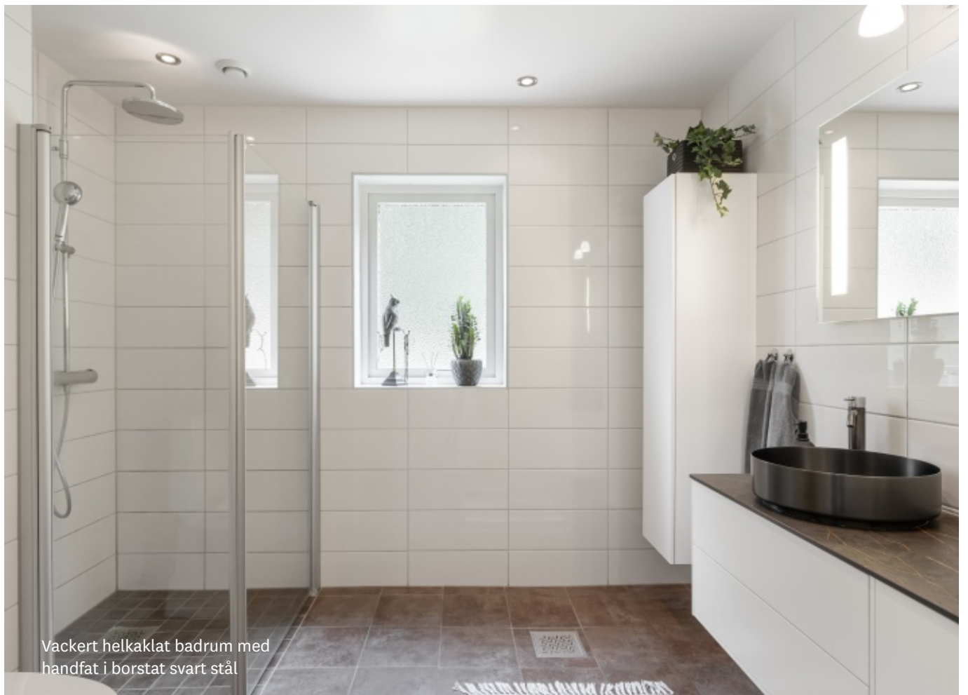
Vackert helkaklat badrum med handfat i borstat svart stål