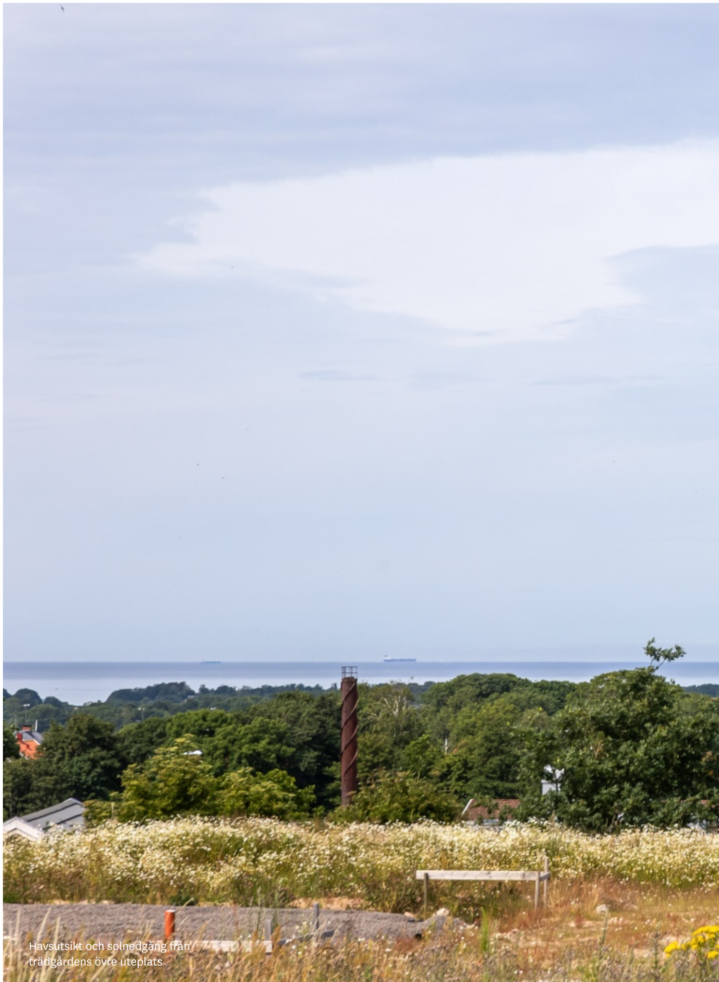
Havsutsikt och solnedgång från trädgårdens övre uteplats