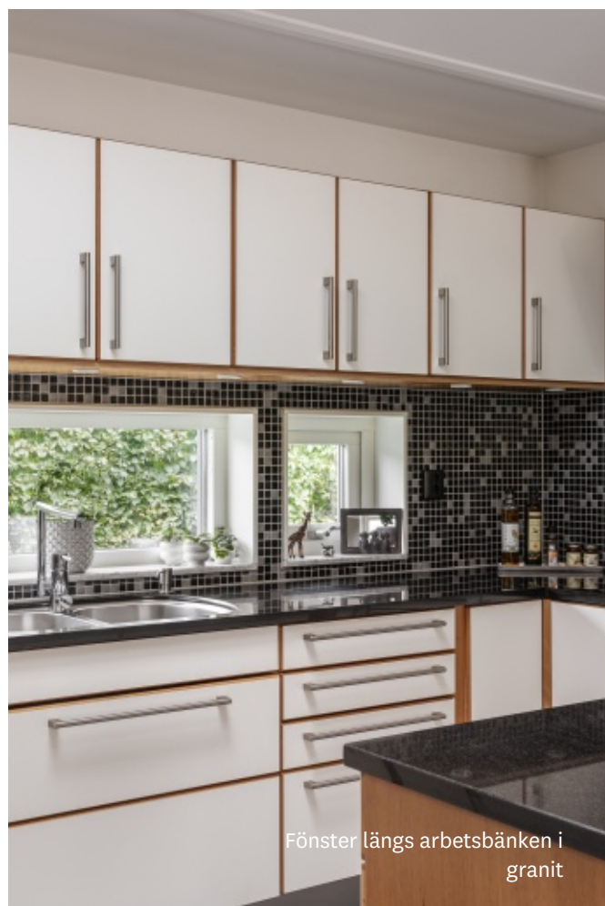
Fönster längs arbetsbänken i granit