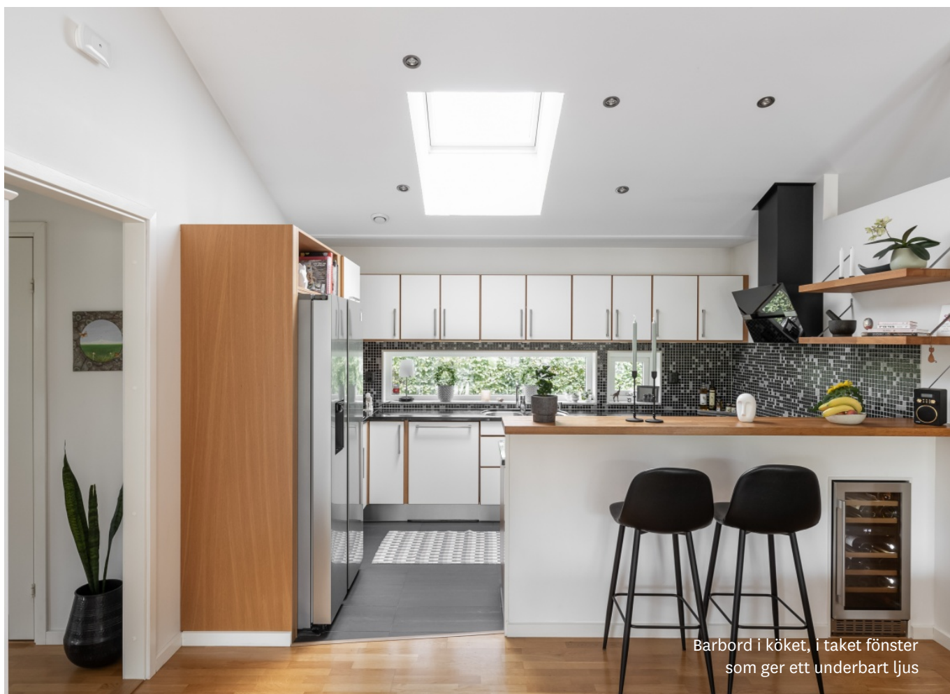
Barbord i köket, i taket fönster som ger ett underbart ljus