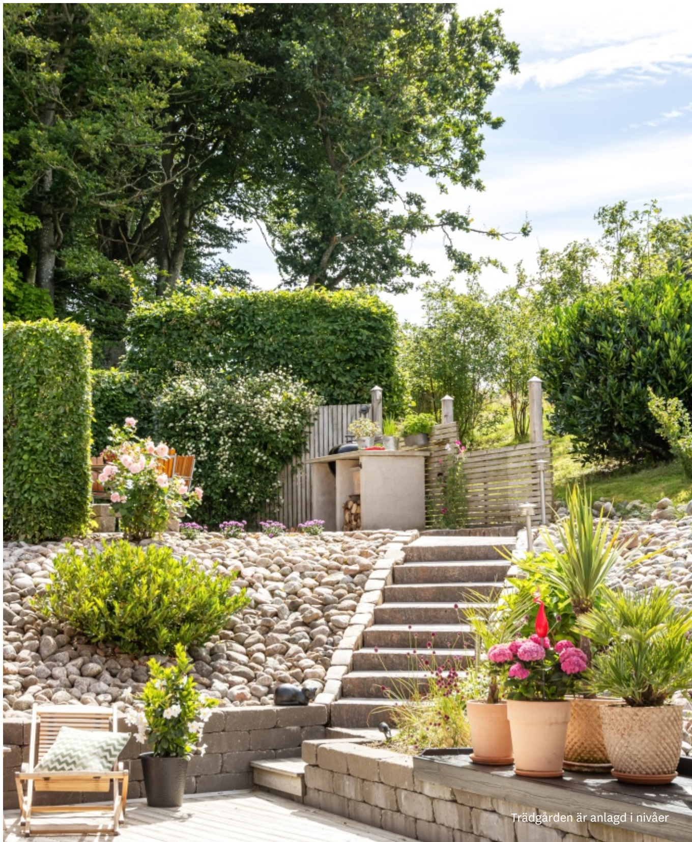
Trädgården är anlagd i nivåer