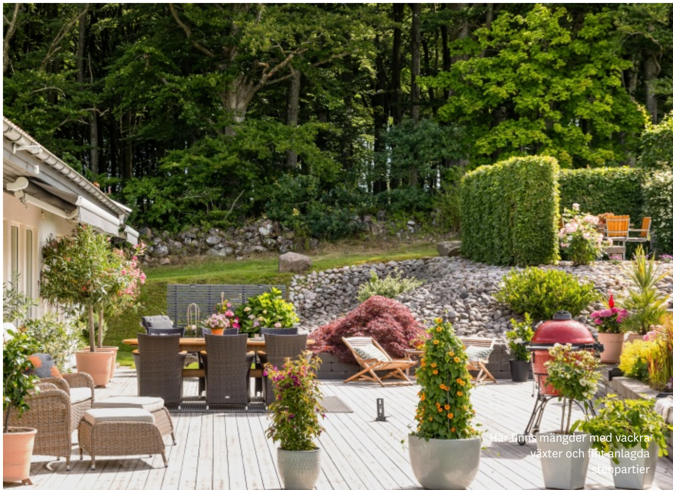
Här finns mängder med vackra växter och fint anlagda stenpartier