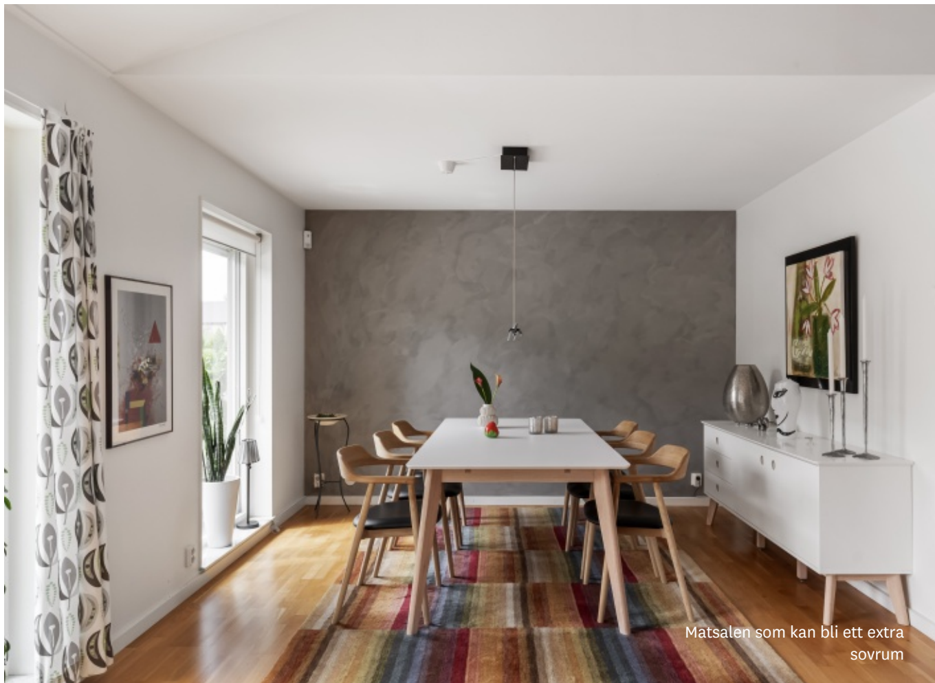
Matsalen som kan bli ett extra sovrum