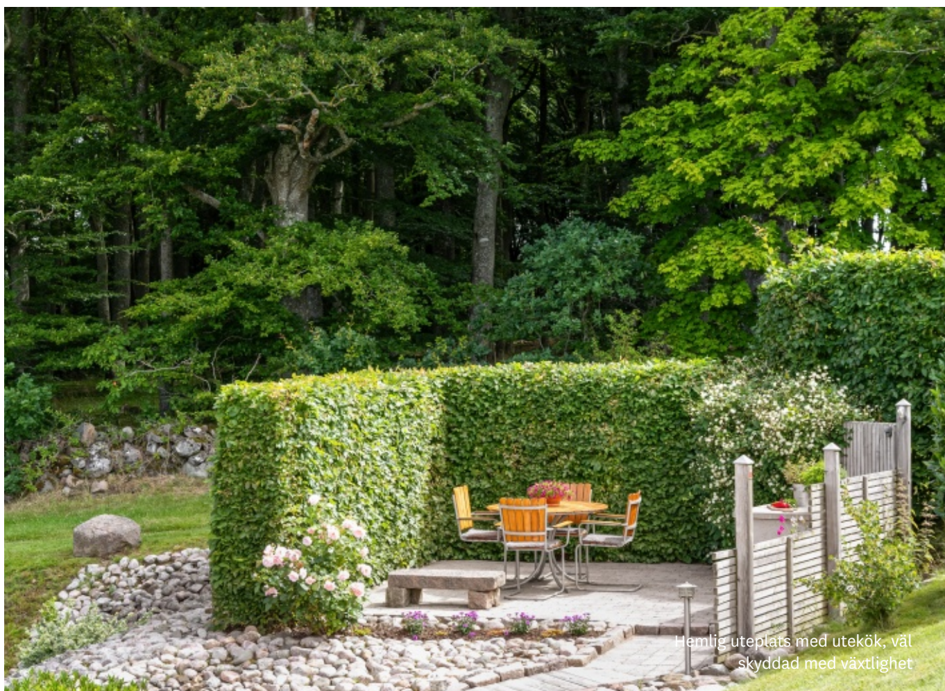
Hemlig uteplats med utekök, väl skyddad med växtlighet