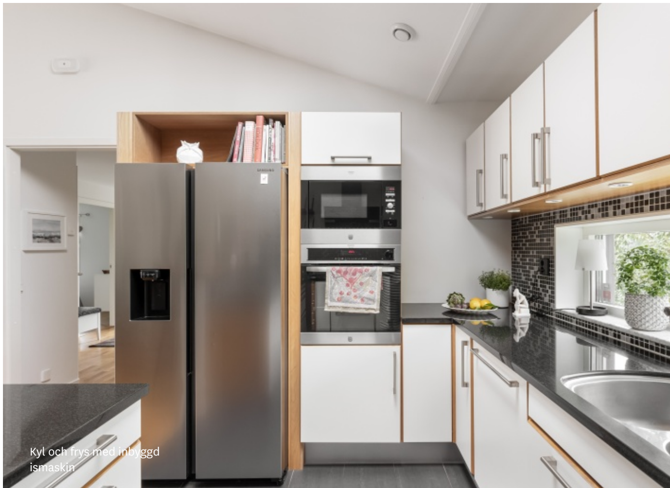
Kyl och frys med inbyggd ismaskin