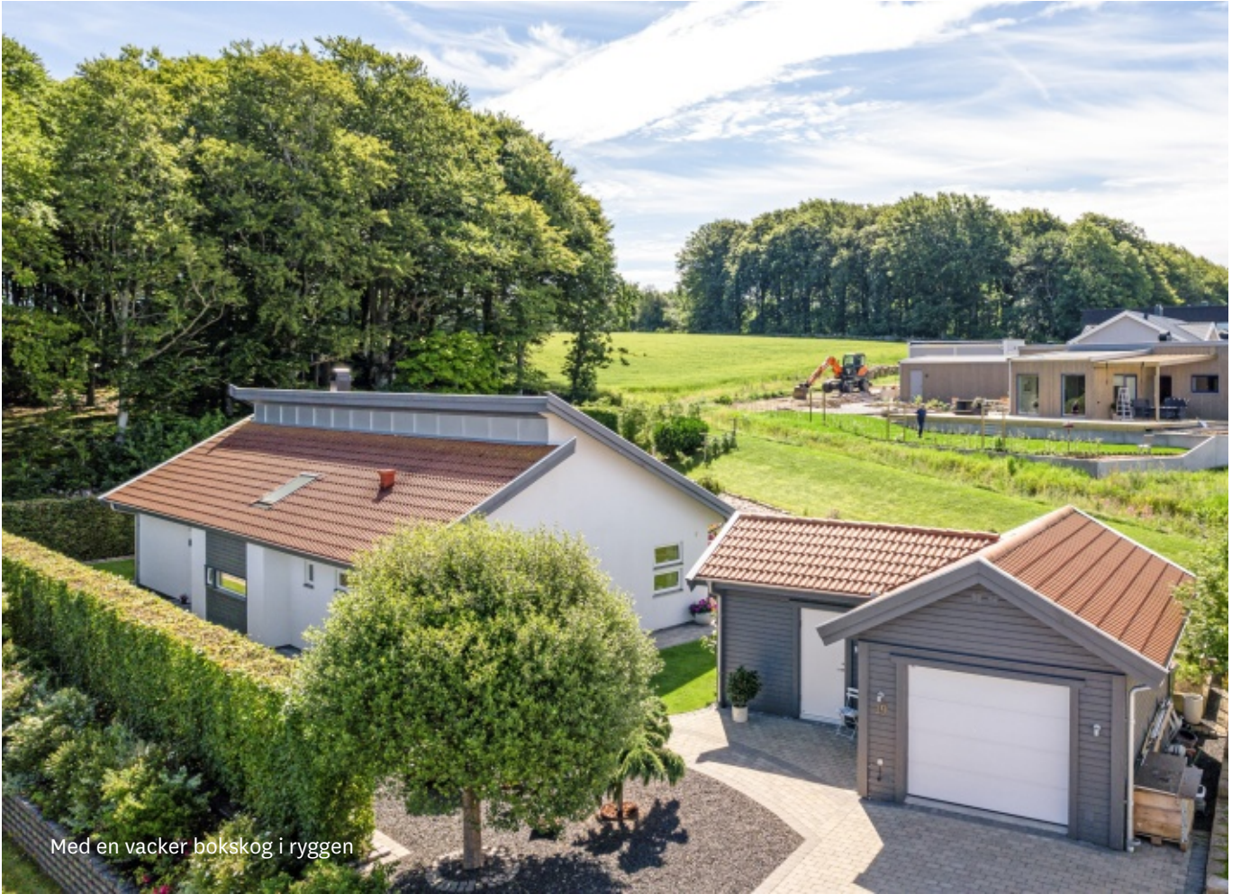
Med en vacker bokskog i ryggen