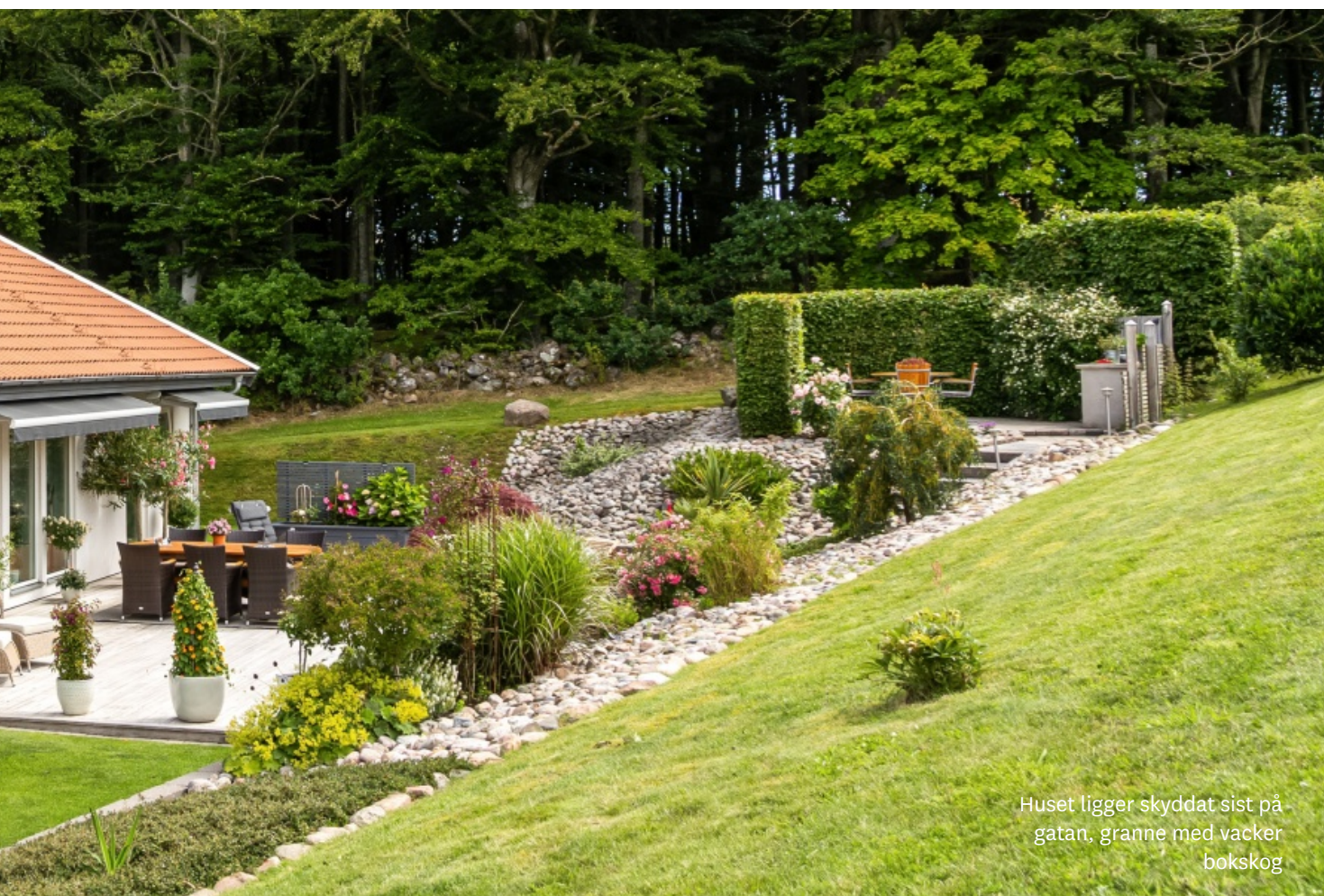
Huset ligger skyddat sist på gatan, granne med vacker bokskog