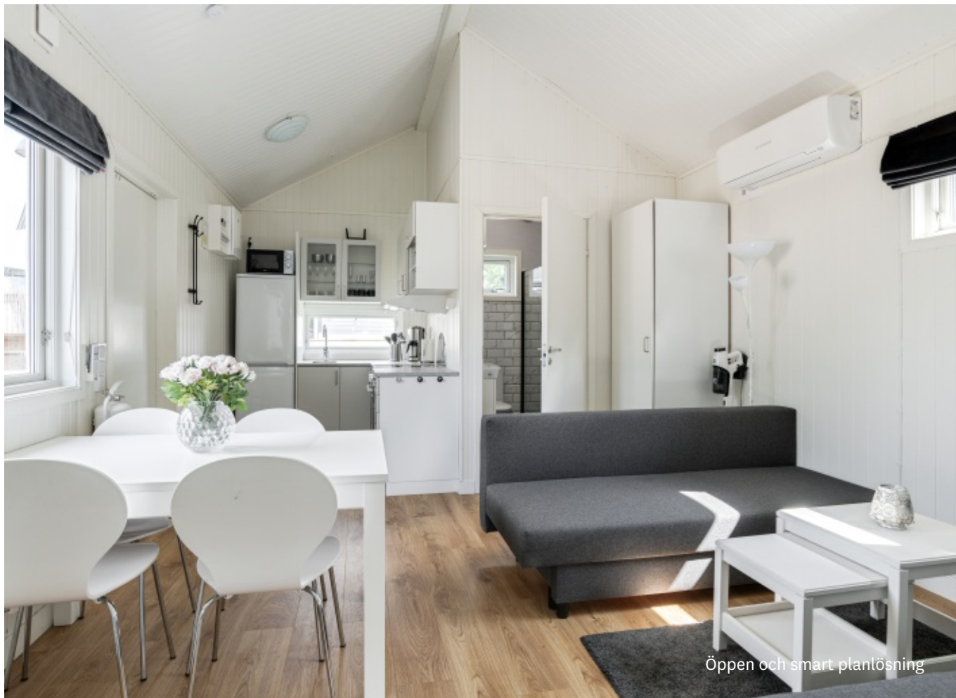
Öppen och smart planlösning