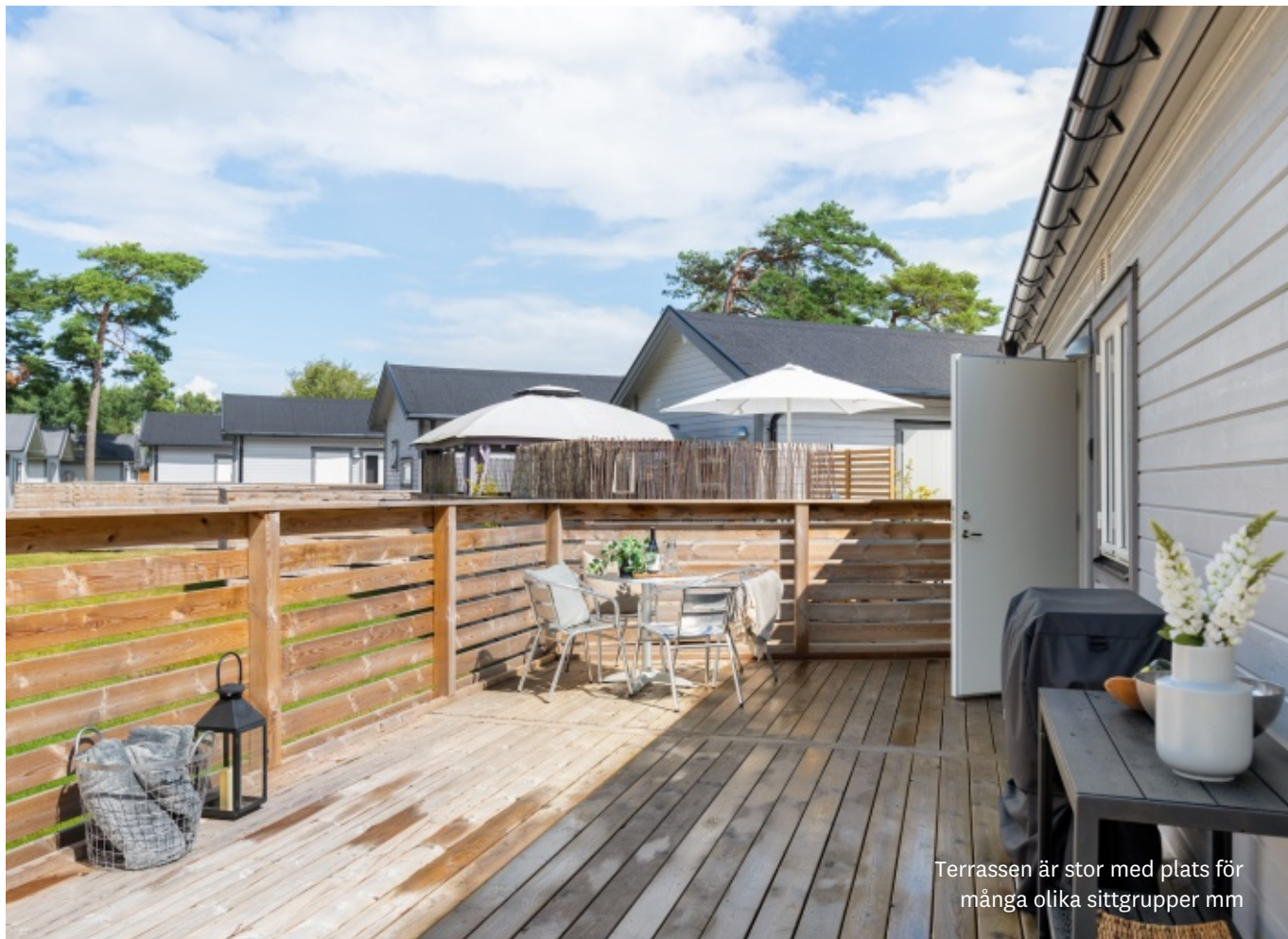
Terrassen är stor med plats för många olika sittgrupper mm