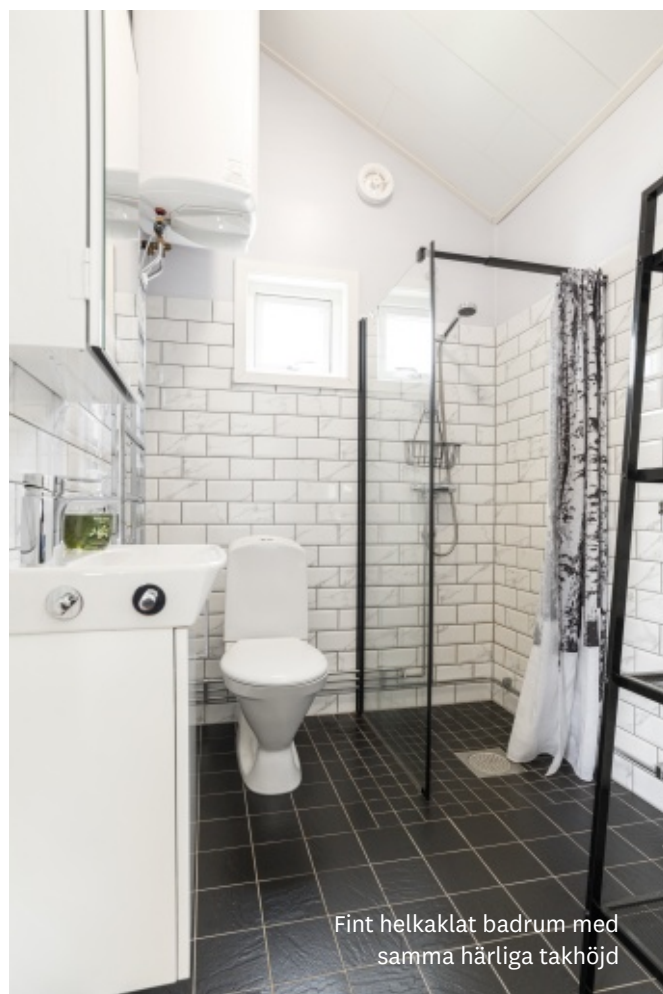
Fint helkaklat badrum med samma härliga takhöjd