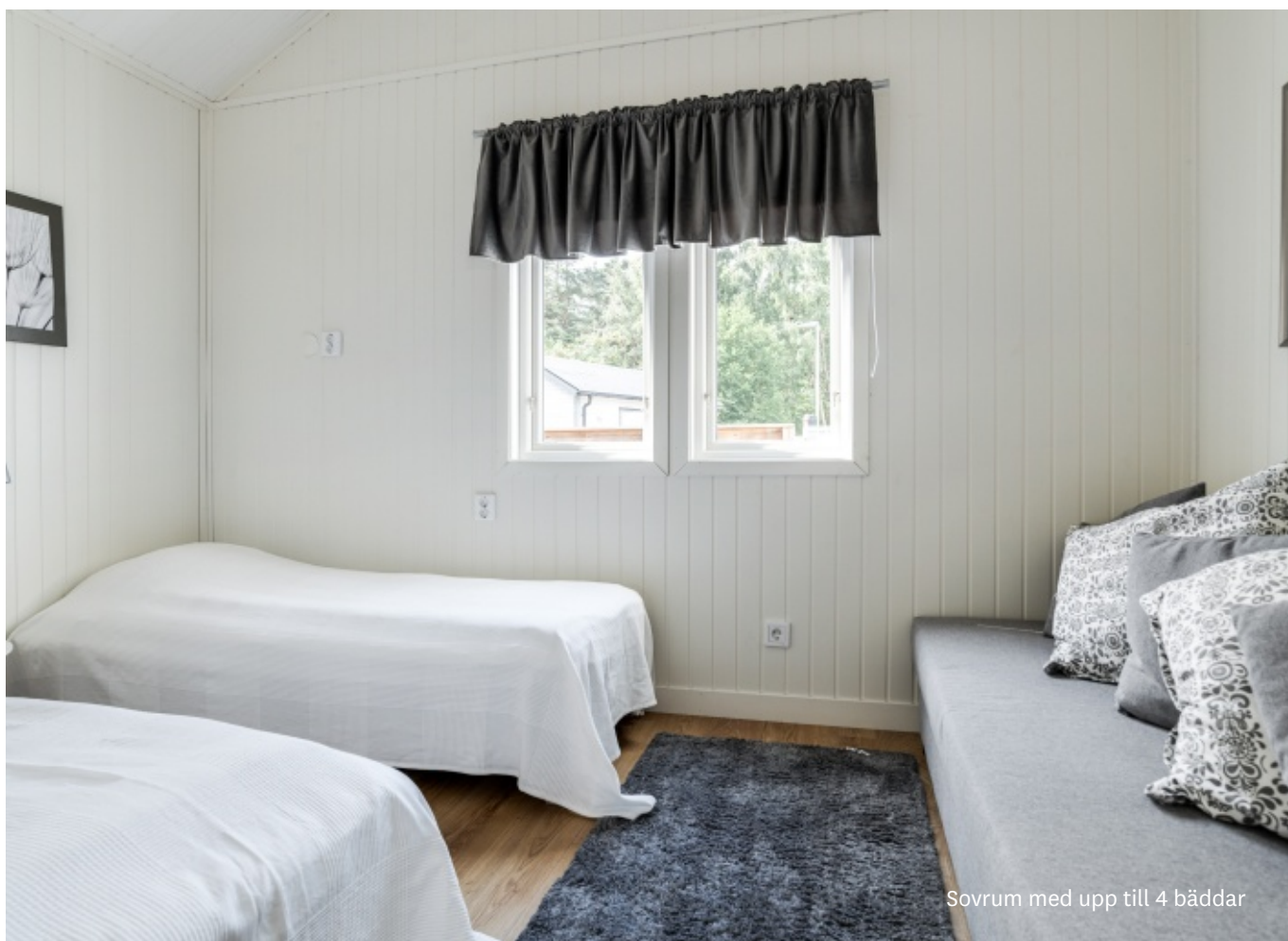
Sovrum med upp till 4 bäddar