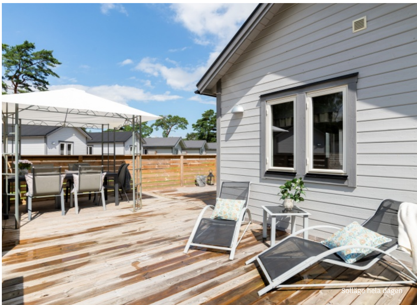
Solläge hela dagen