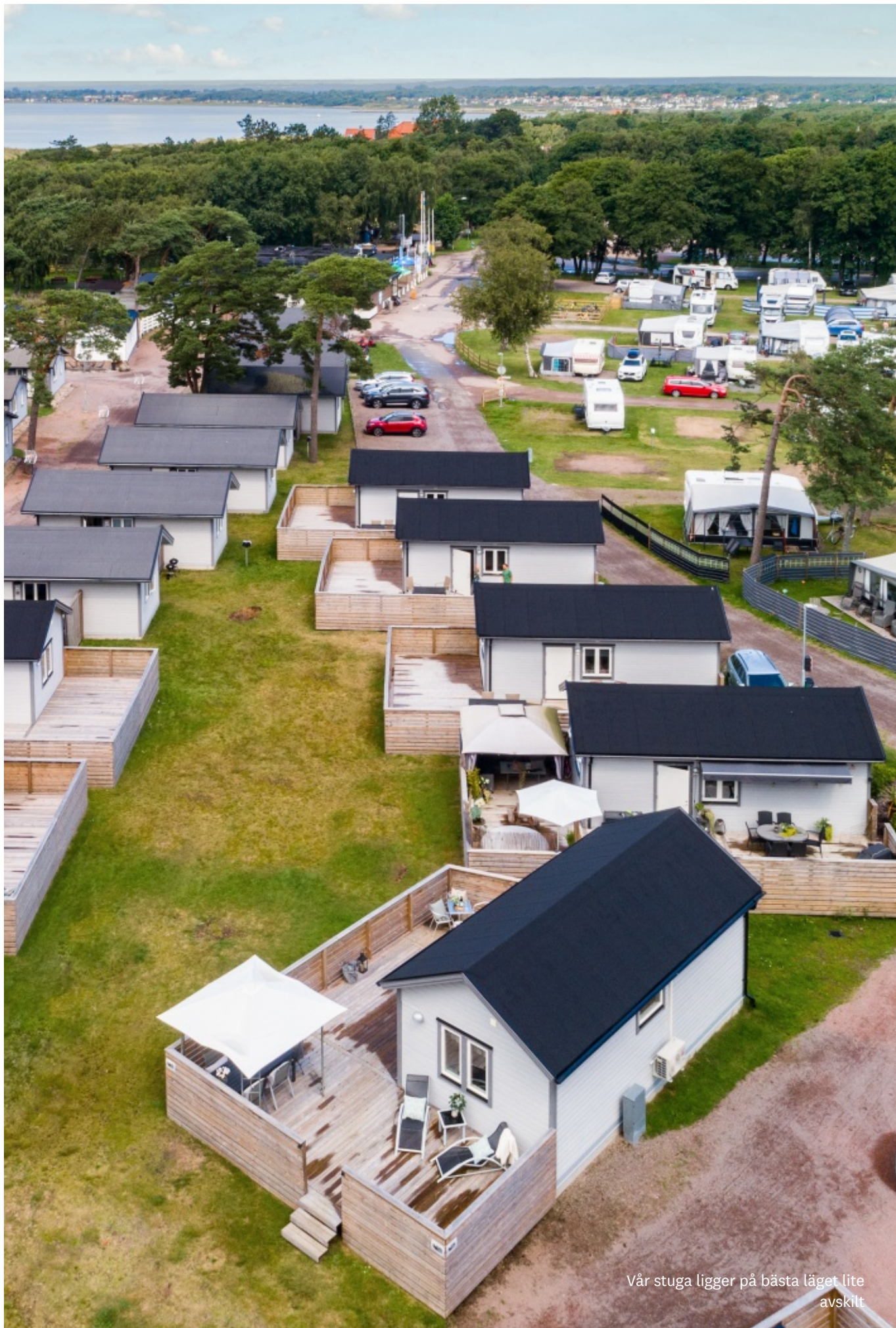
Vår stuga ligger på bästa läget lite avskilt