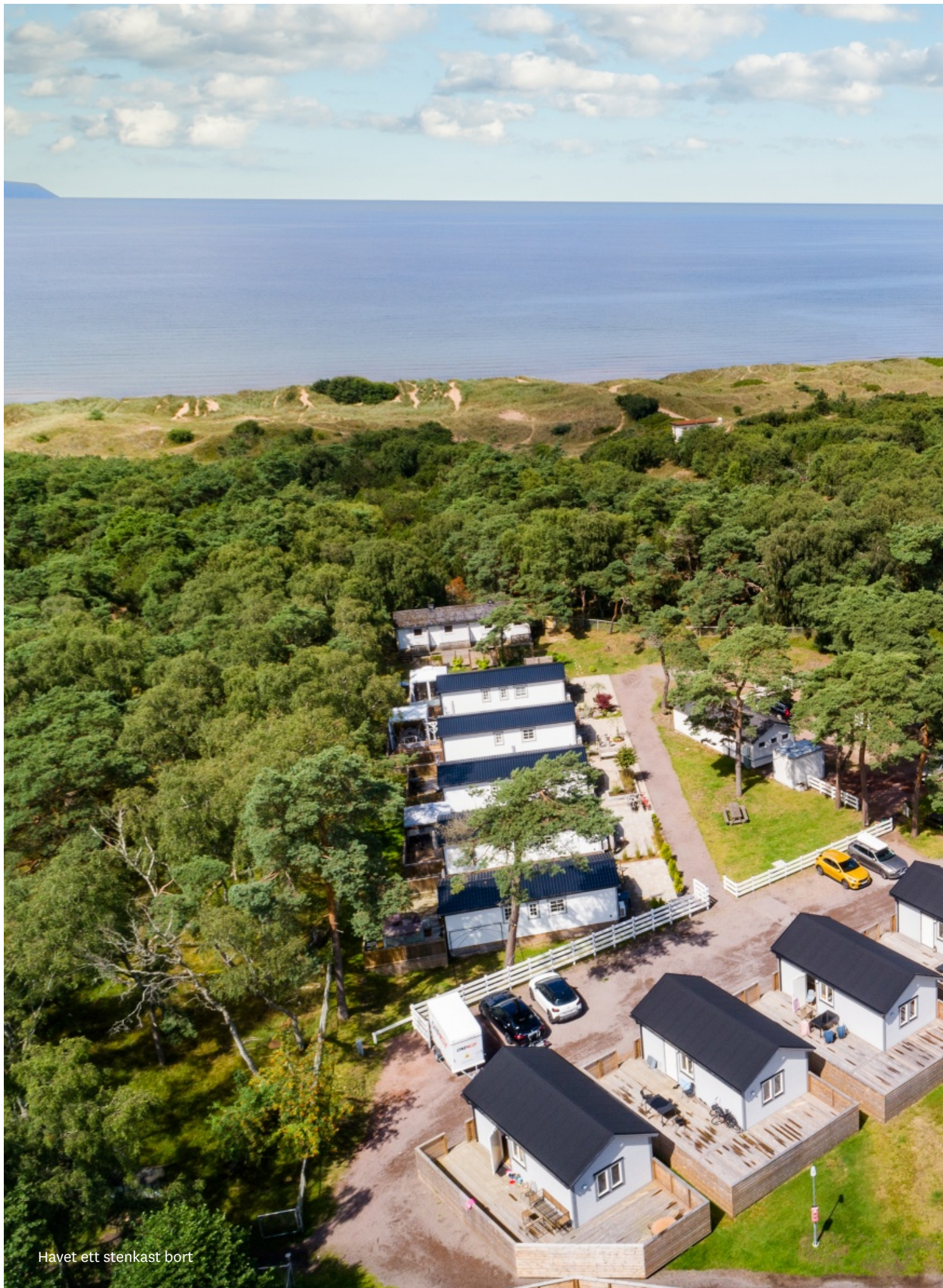
Havet ett stenkast bort