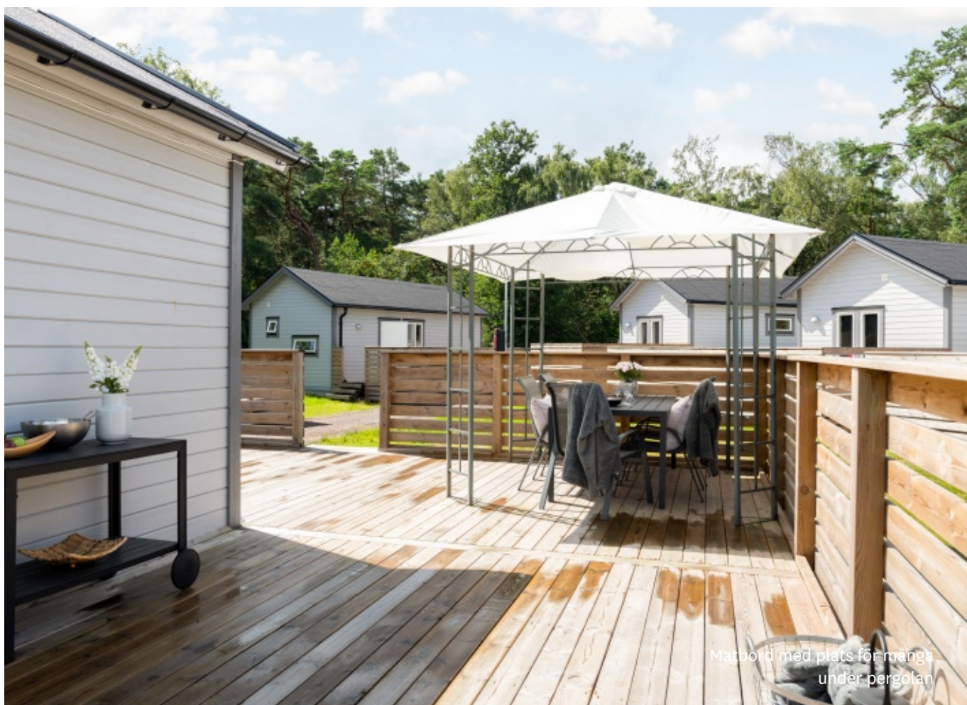
Matbord med plats för många under pergolan