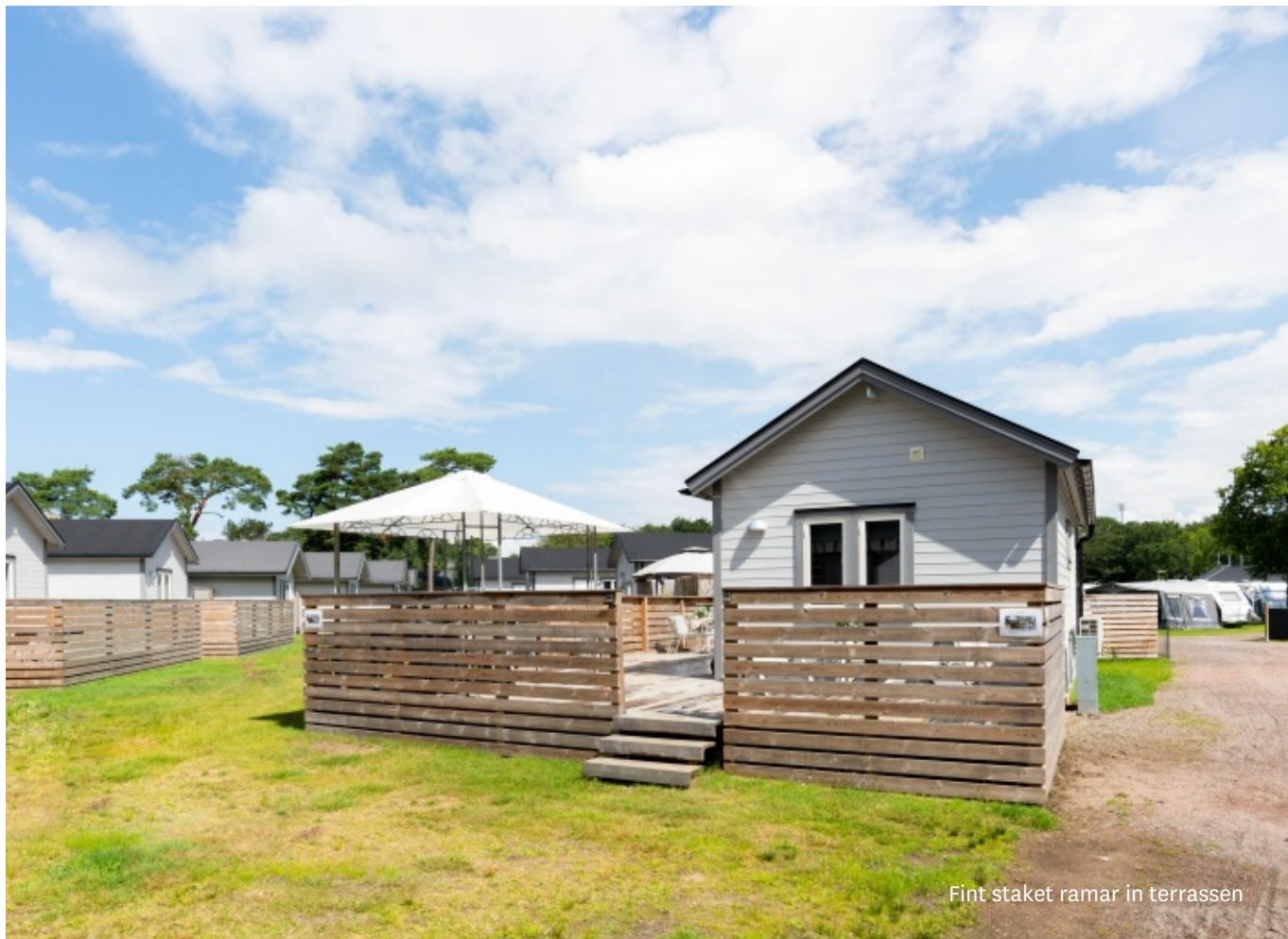
Fint staket ramar in terrassen