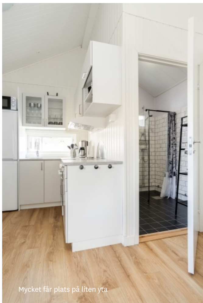
Mycket får plats på liten yta