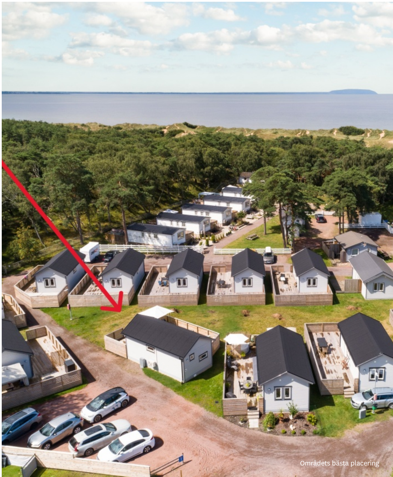
Områdets bästa placering