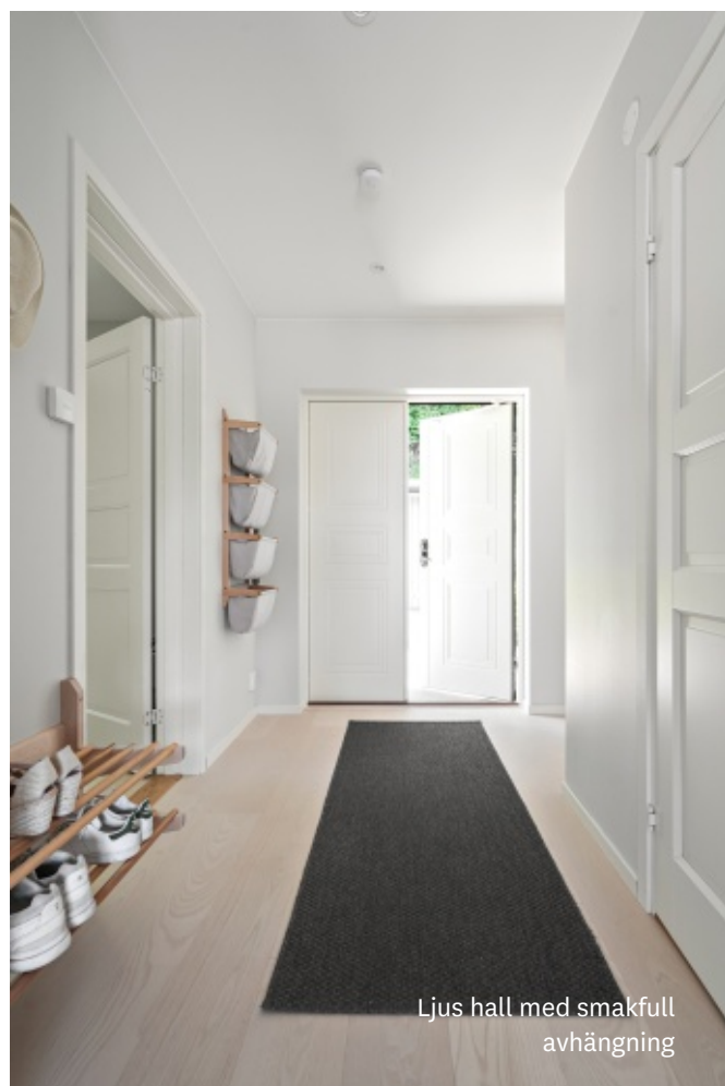
Ljus hall med smakfull avhängning