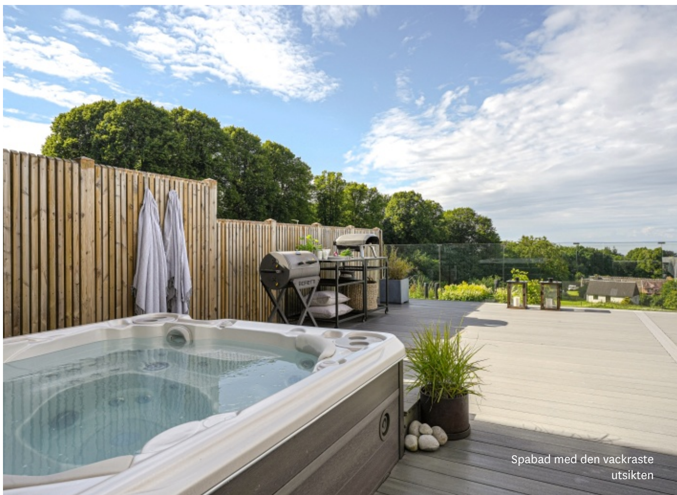
Spabad med den vackraste utsikten