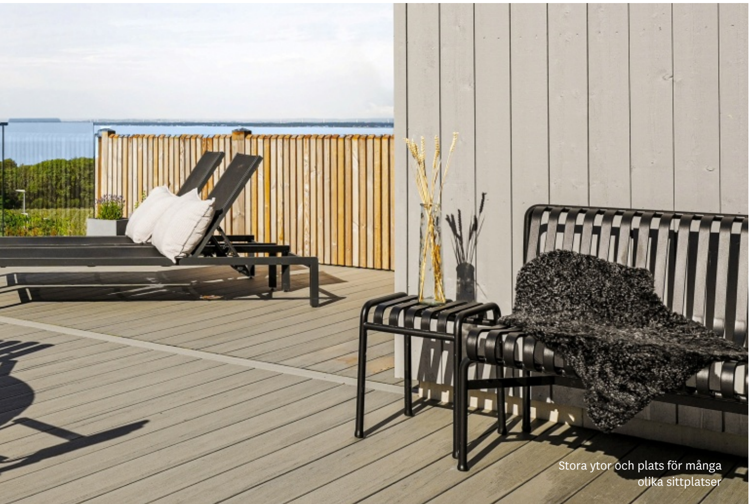
Stora ytor och plats för många olika sittplatser