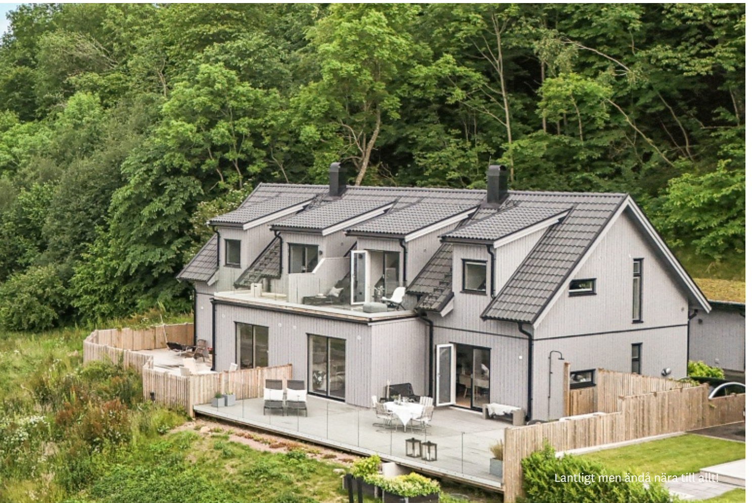
Lantligt men ändå nära till allt!