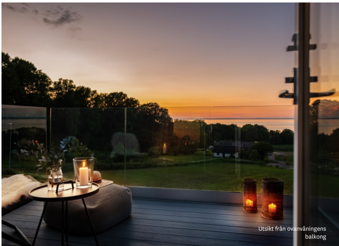
Utsikt från ovanvåningens balkong