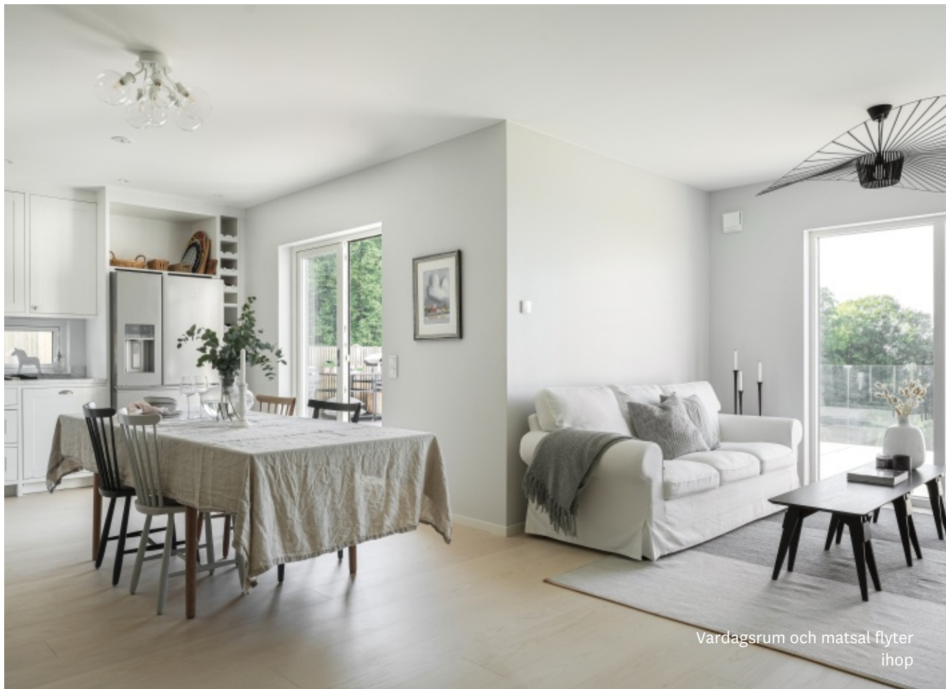
Vardagsrum och matsal flyter ihop