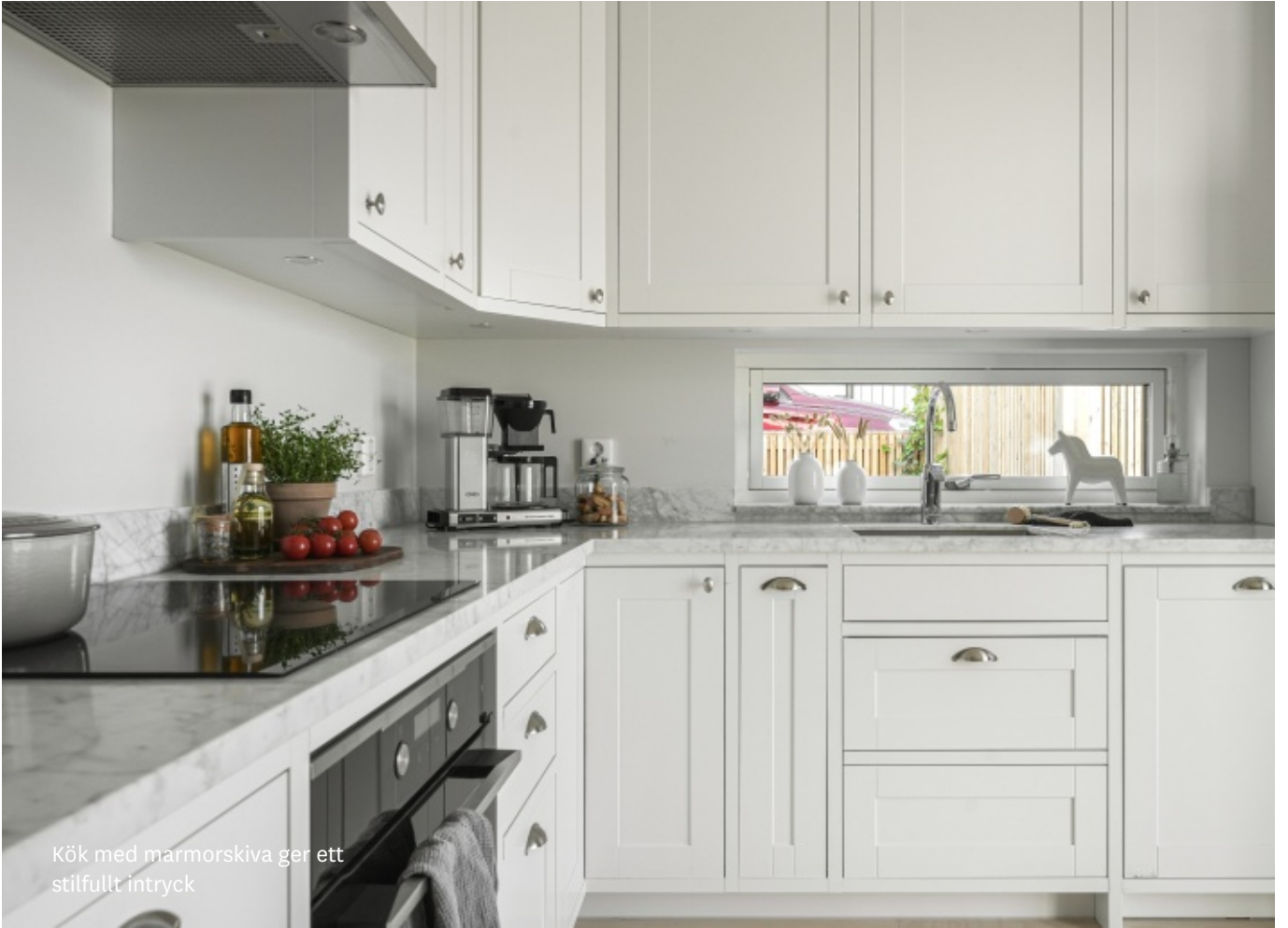
Kök med marmorskiva ger ett stilfullt intryck