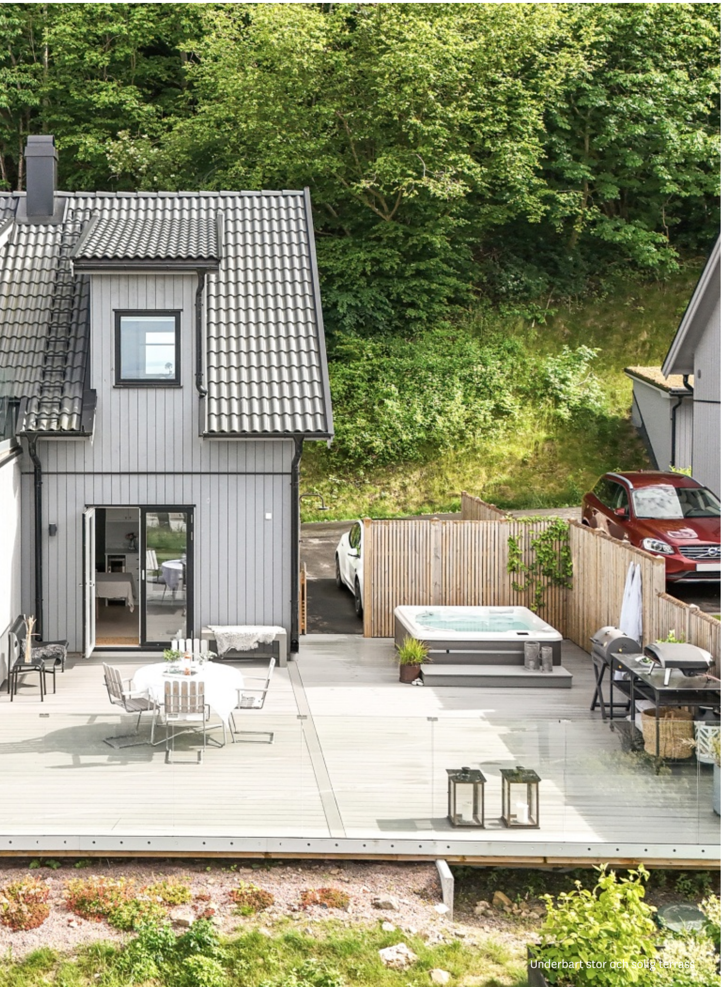
Underbart stor och solig terrass