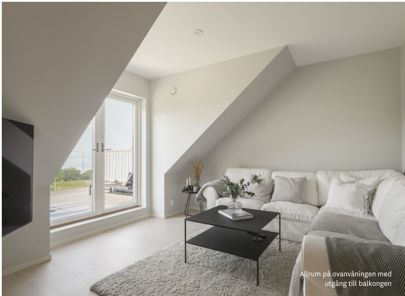
Allrum på ovanvåningen med utgång till balkongen