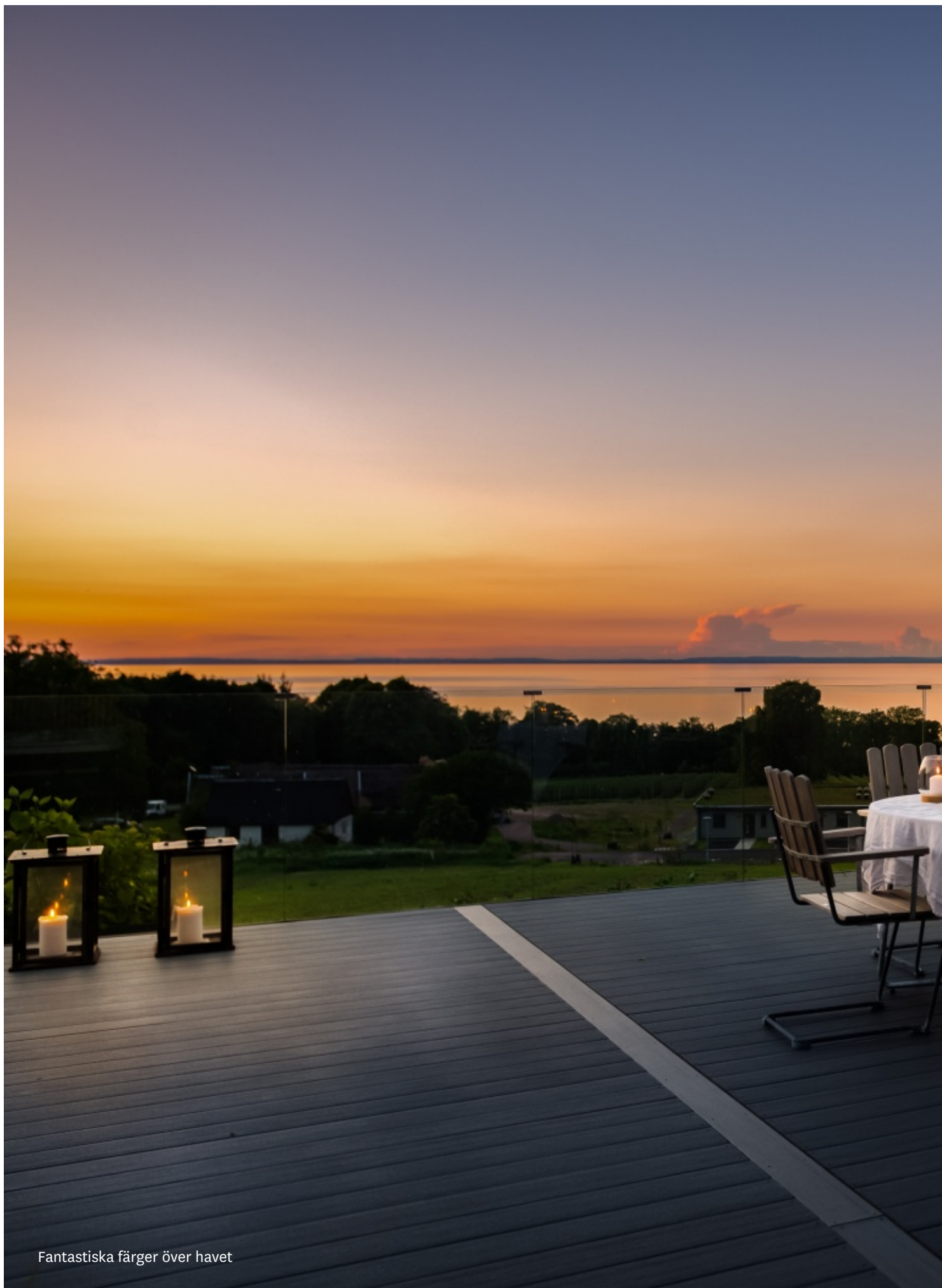
Fantastiska färger över havet