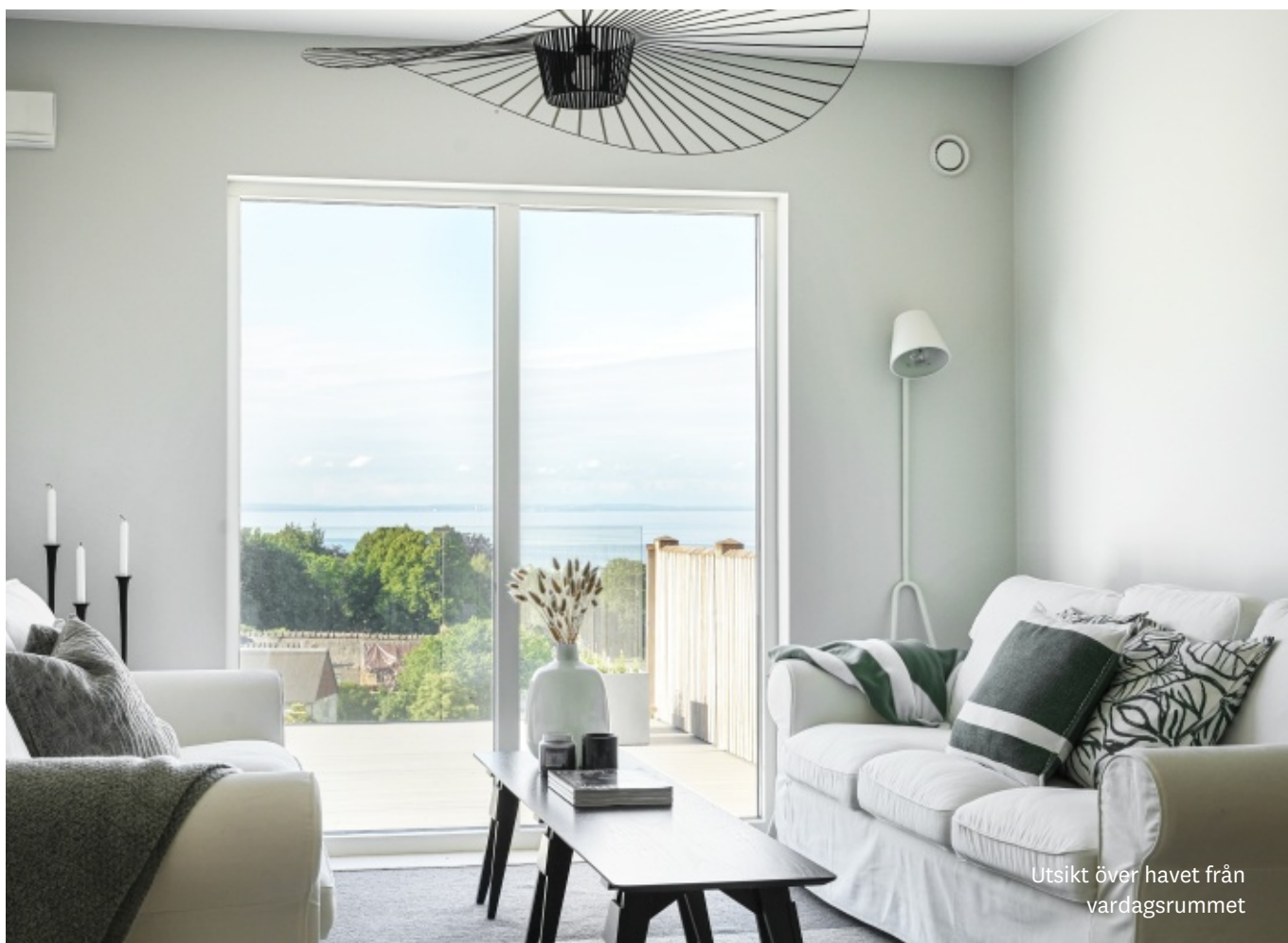
Utsikt över havet från vardagsrummet