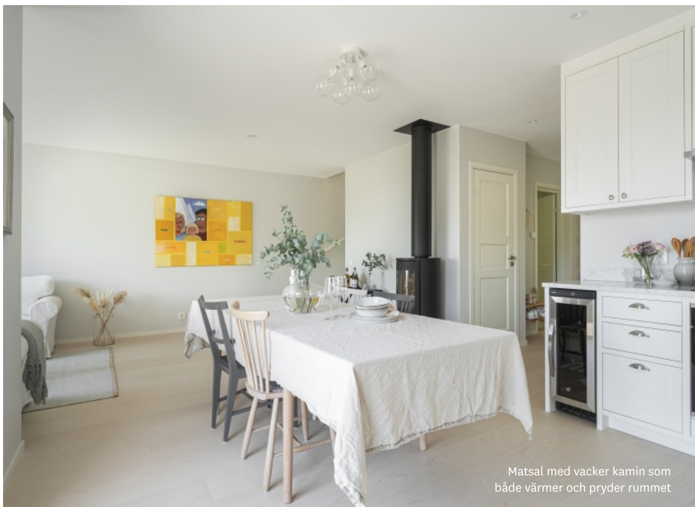
Matsal med vacker kamin som både värmer och pryder rummet