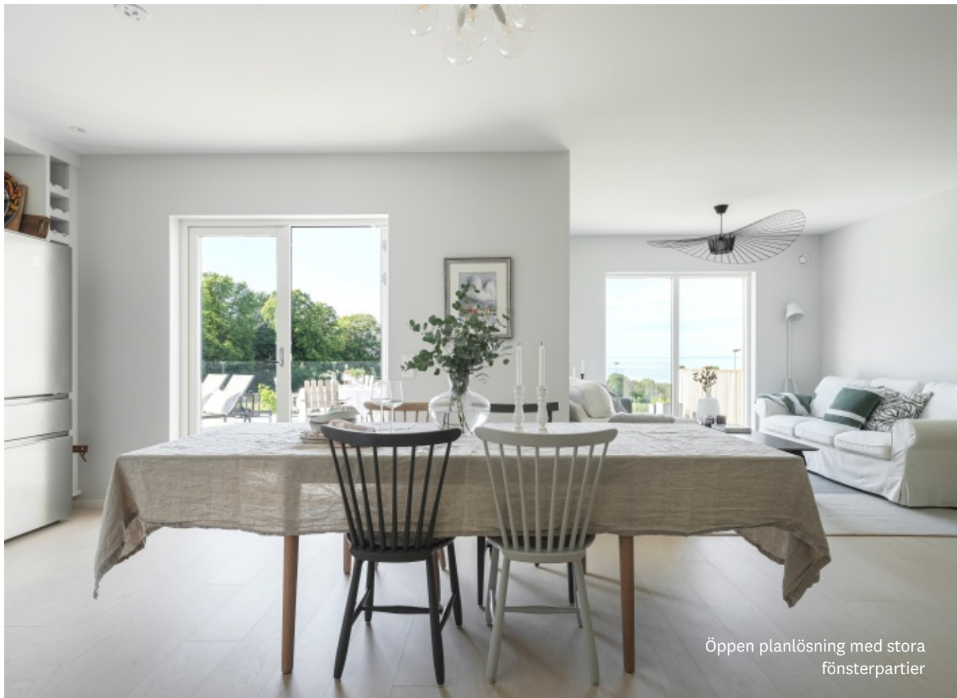
Öppen planlösning med stora fönsterpartier