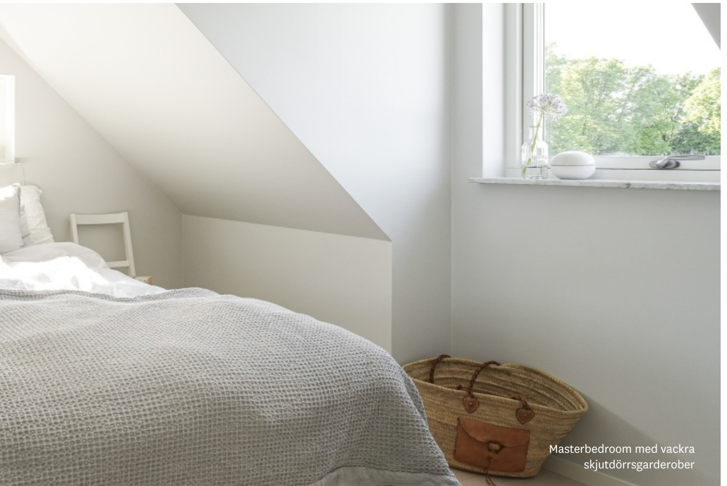
Masterbedroom med vackra skjuddörrsgarderober