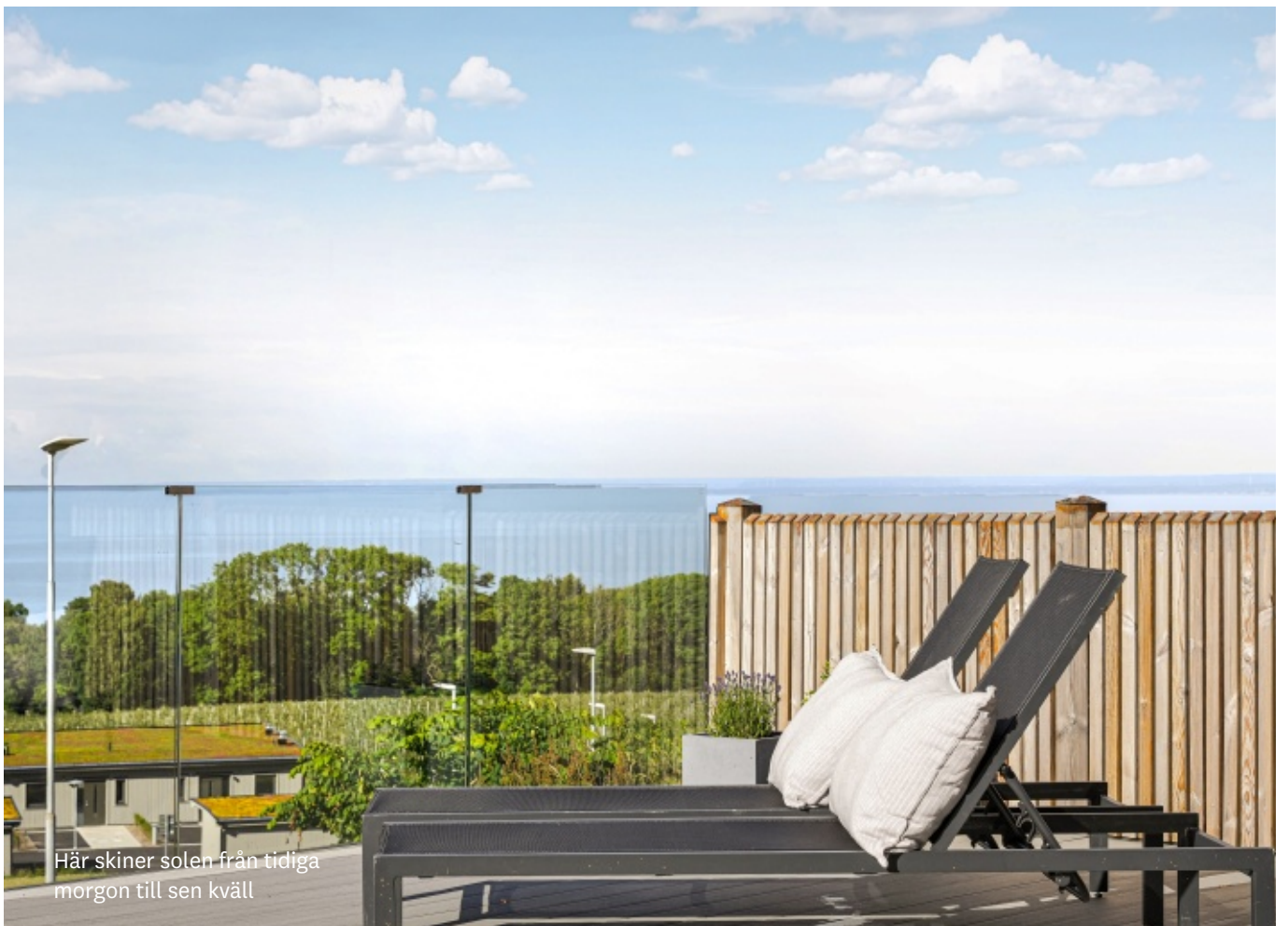
Här skiner solen från tidiga morgon till sen kväll