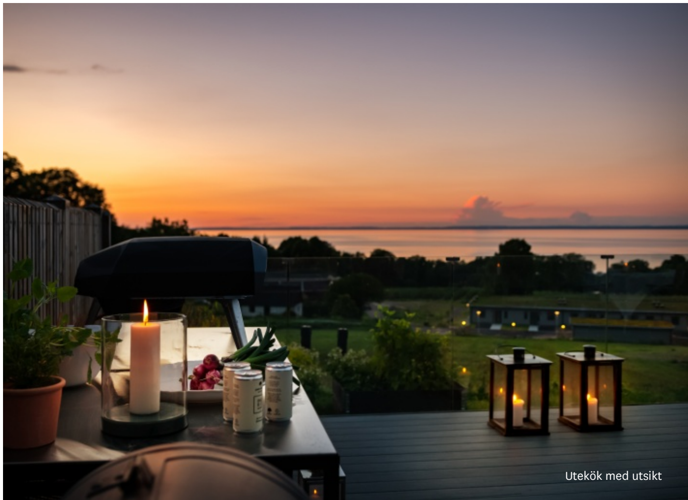
Utekök med utsikt