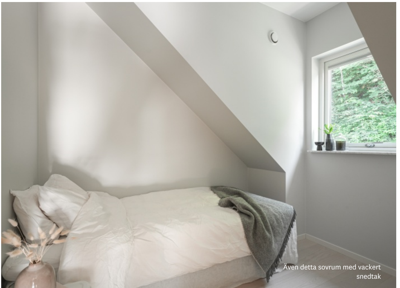
Även detta sovrum med vackert snedtak