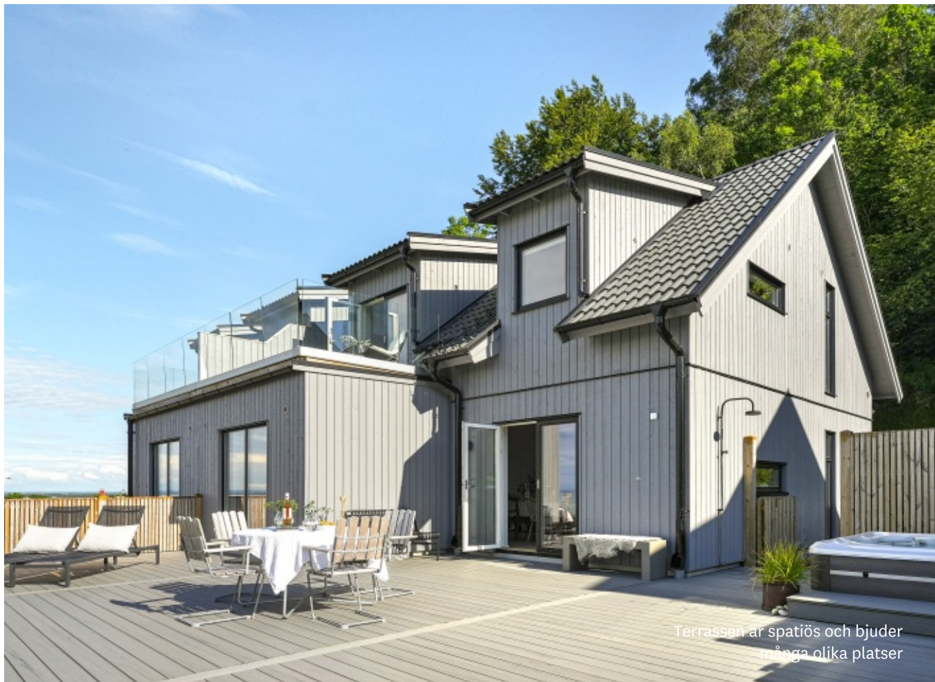
Terrassen är spaciös och bjuder många olika platser