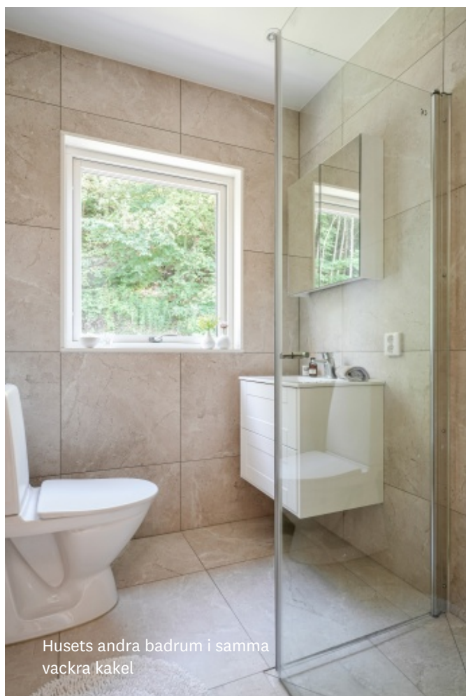
Husets andra badrum i samma vackra kakel