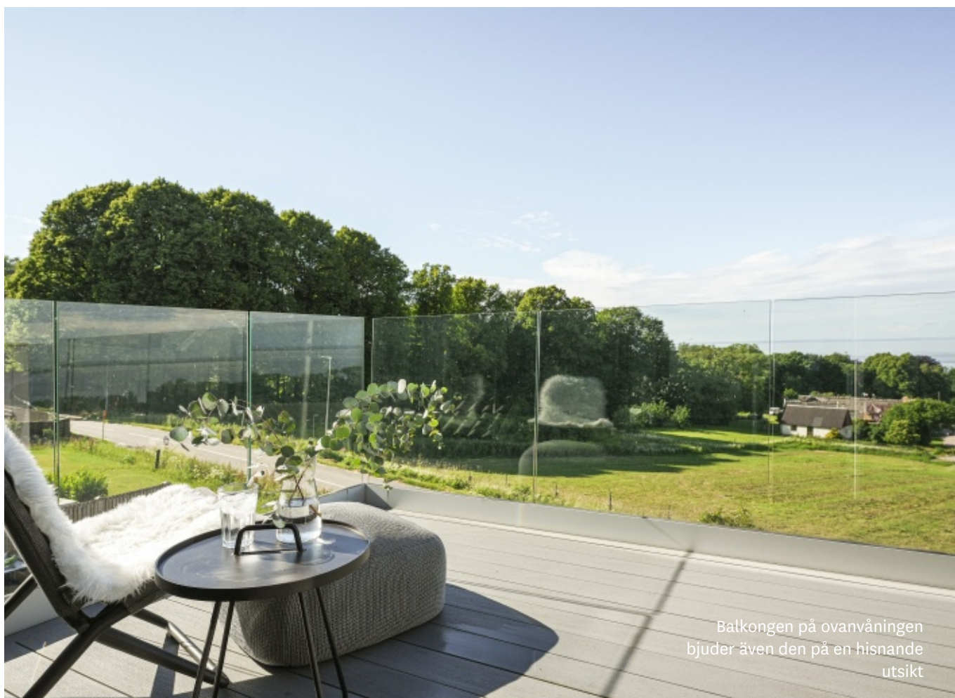
Balkongen på ovanvåningen bjuder även den på en hisnande utsikt