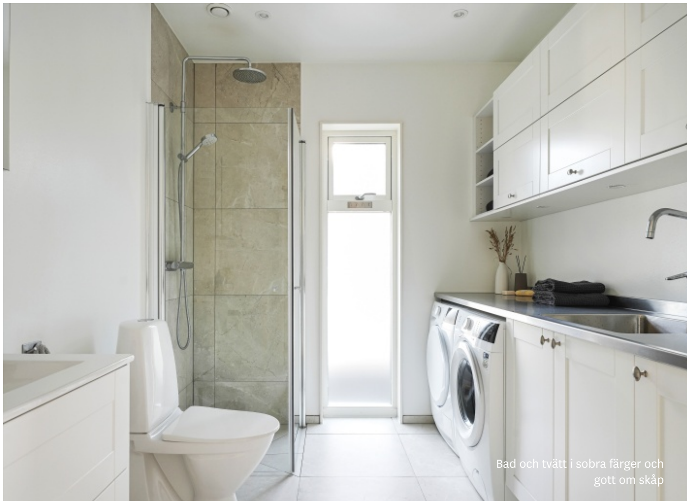
Bad och tvätt i sobra färger och gott om skåp