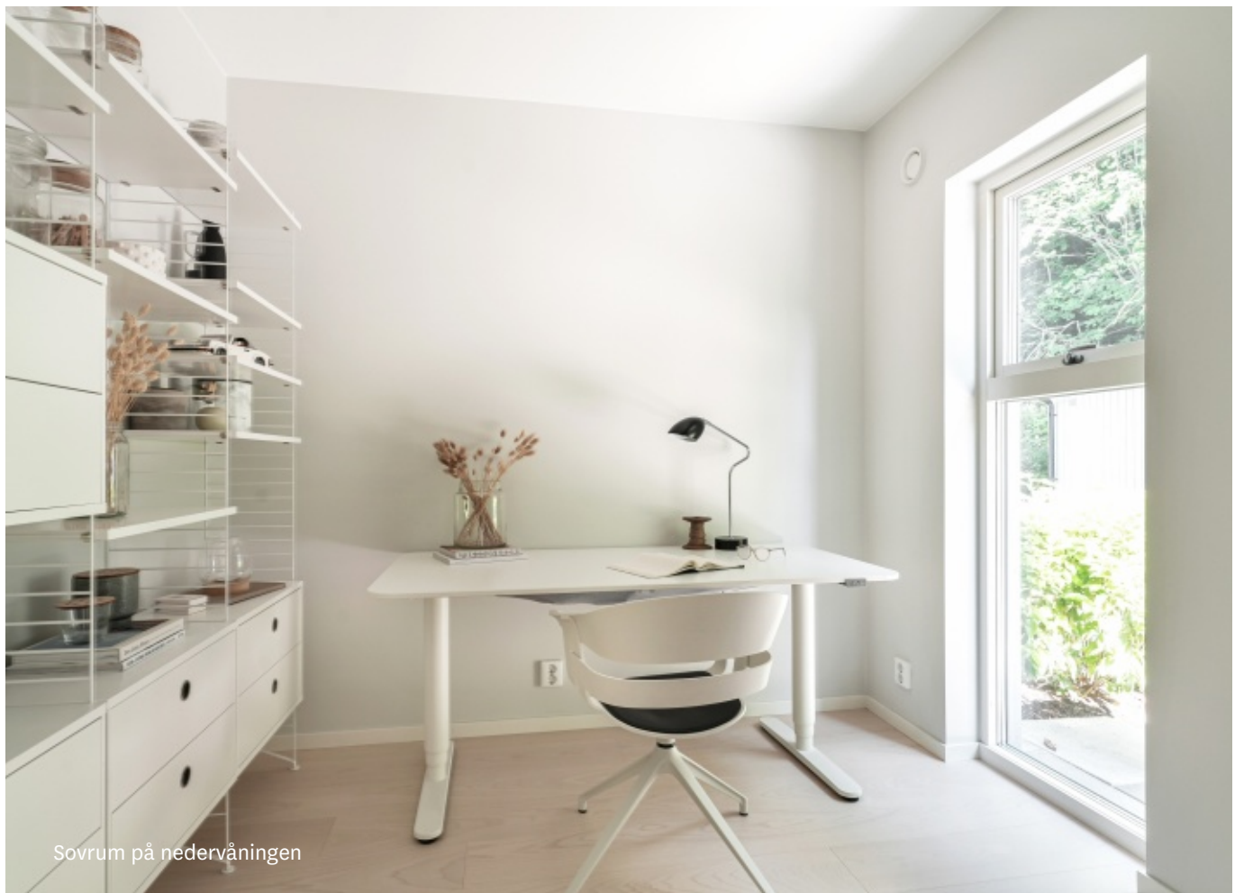
Sovrum på nedervåningen