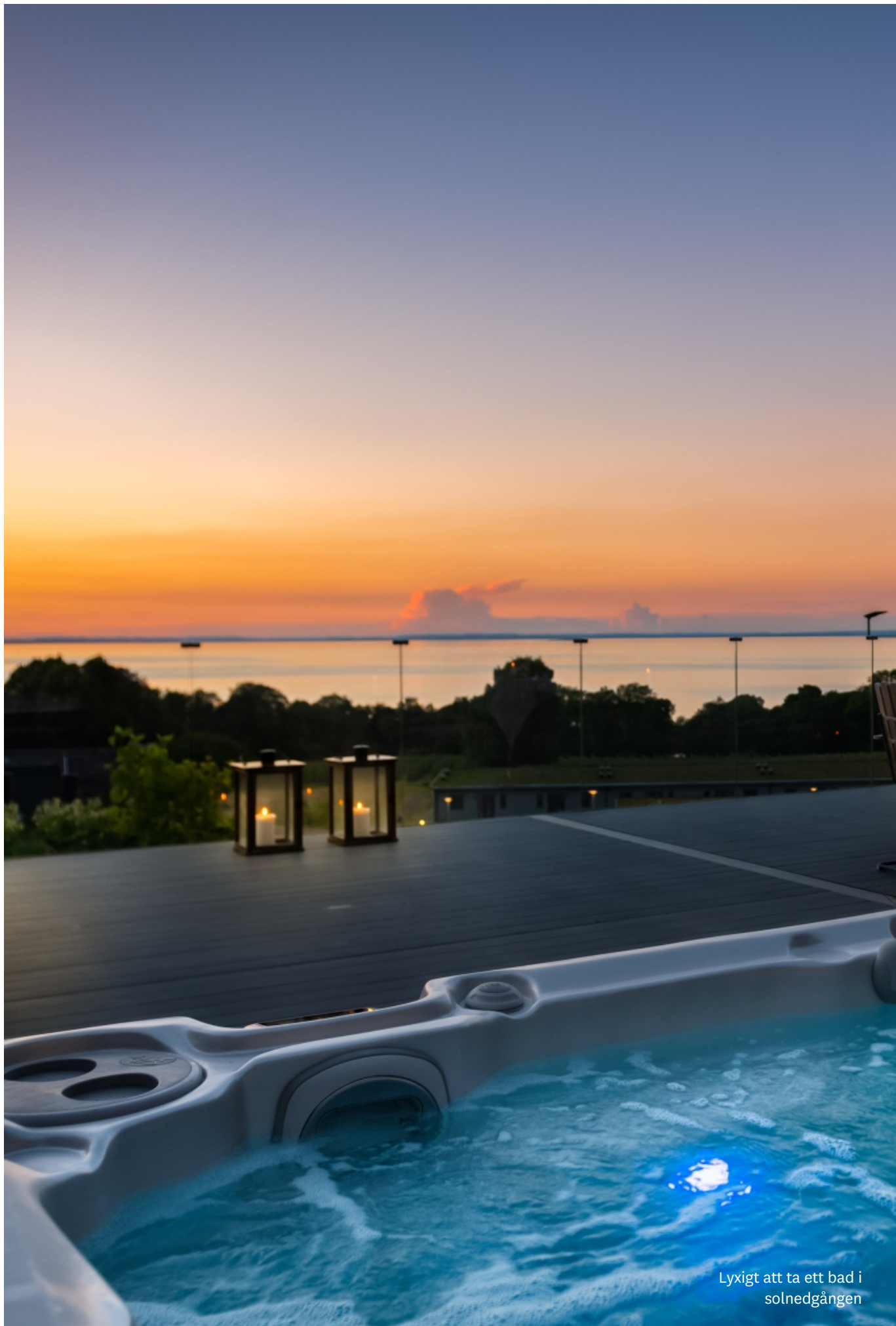
Lyxigt att ta ett bad i solnedgången