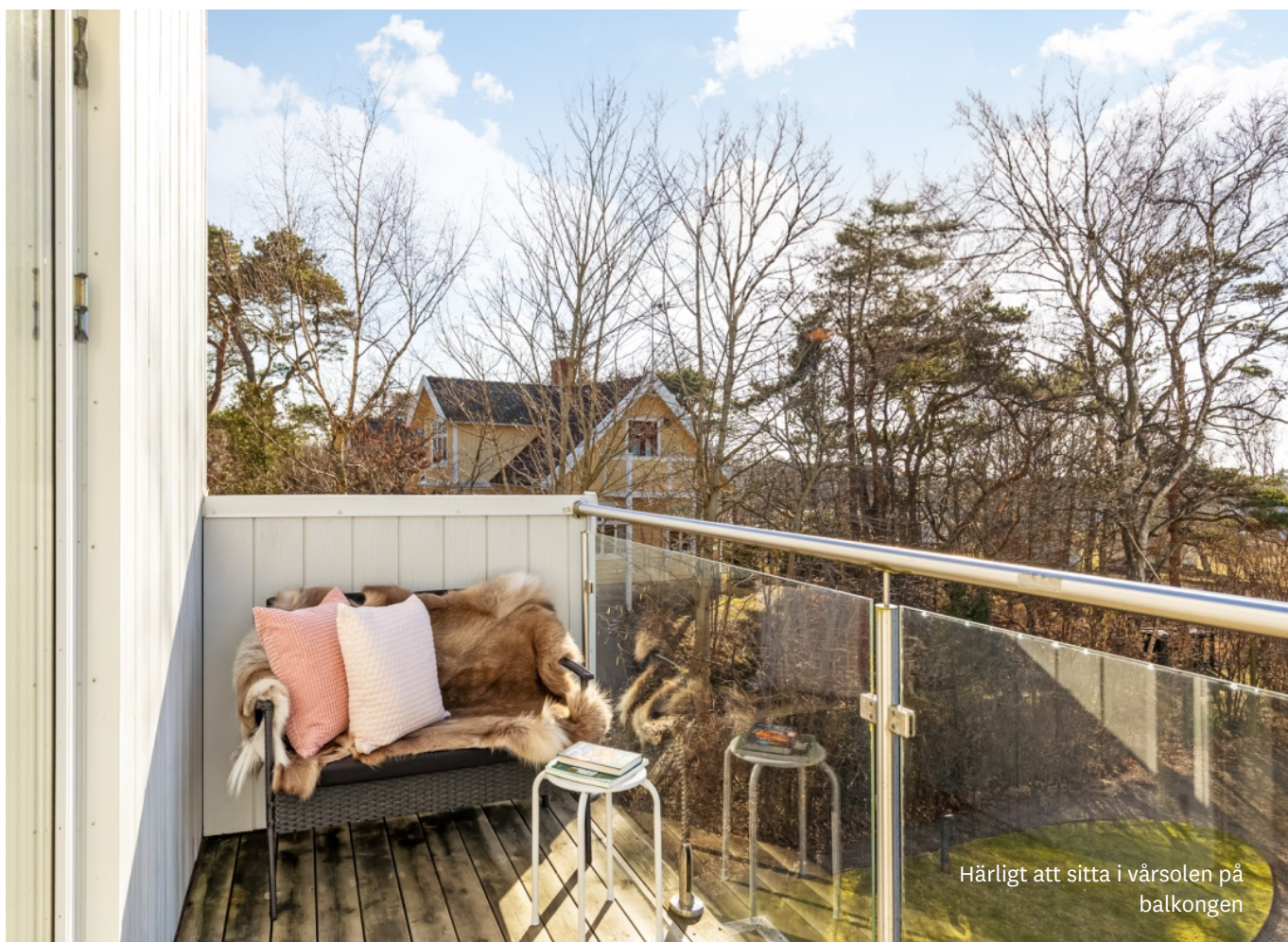
Härligt att sitta i vårsolen på balkongen