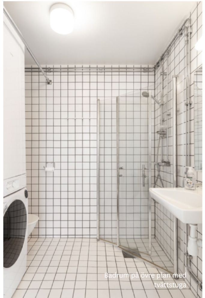
Badrum på övre plan med tvättstuga