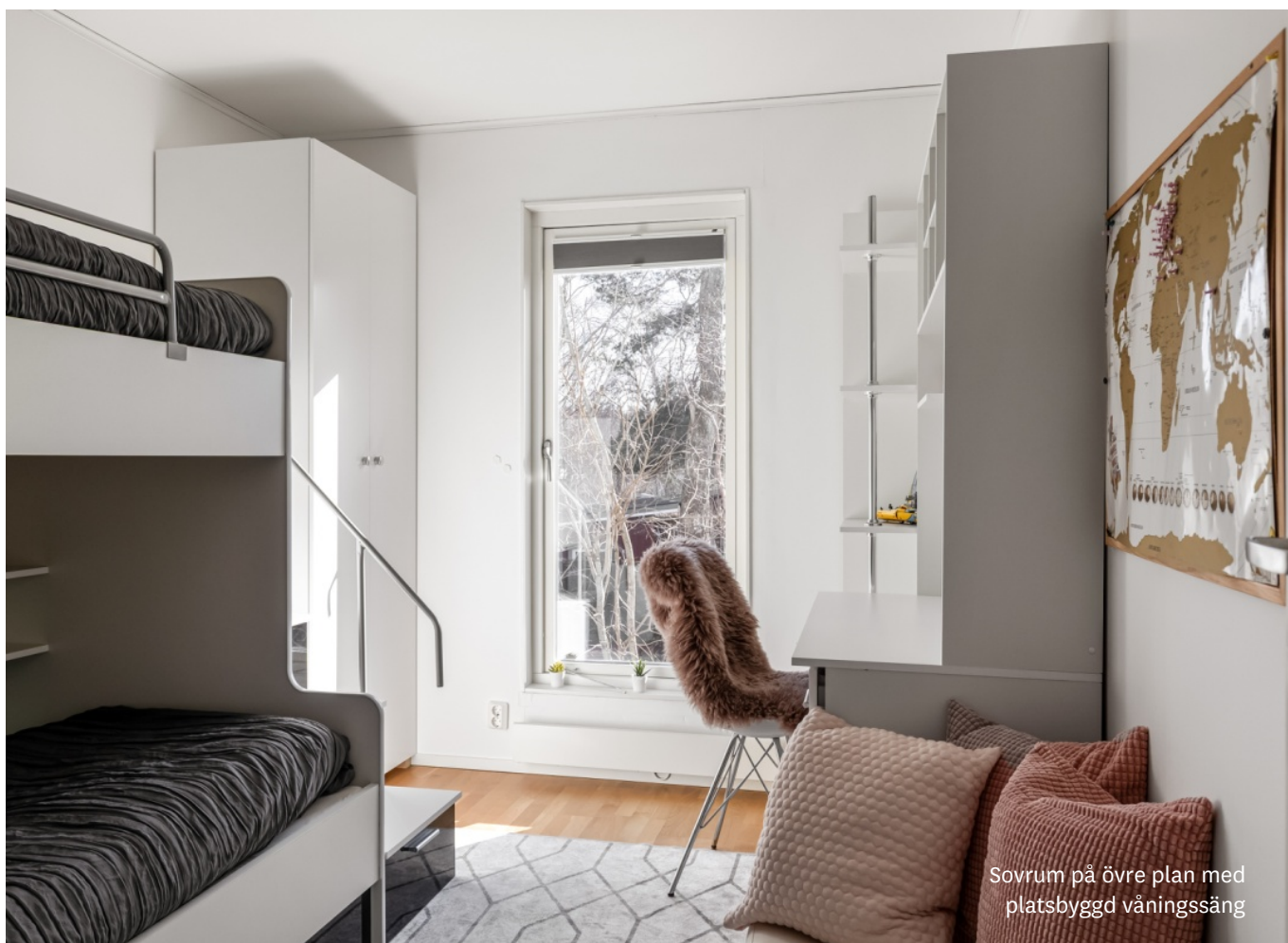
Sovrum på övre plan med platsbyggd våningssäng