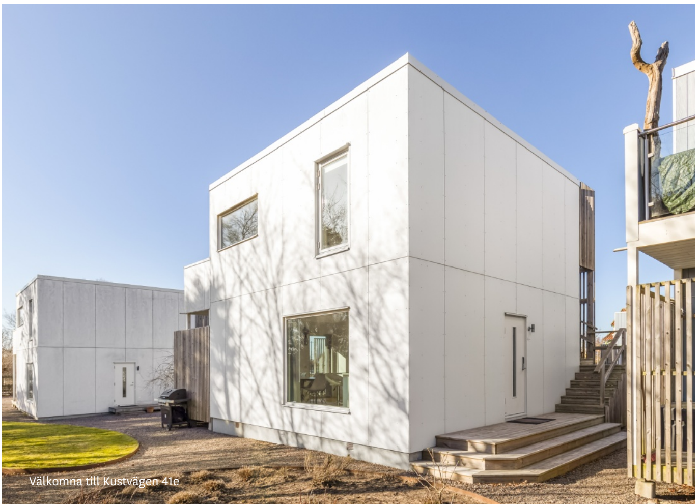
Välkomna till Kustvägen 41e