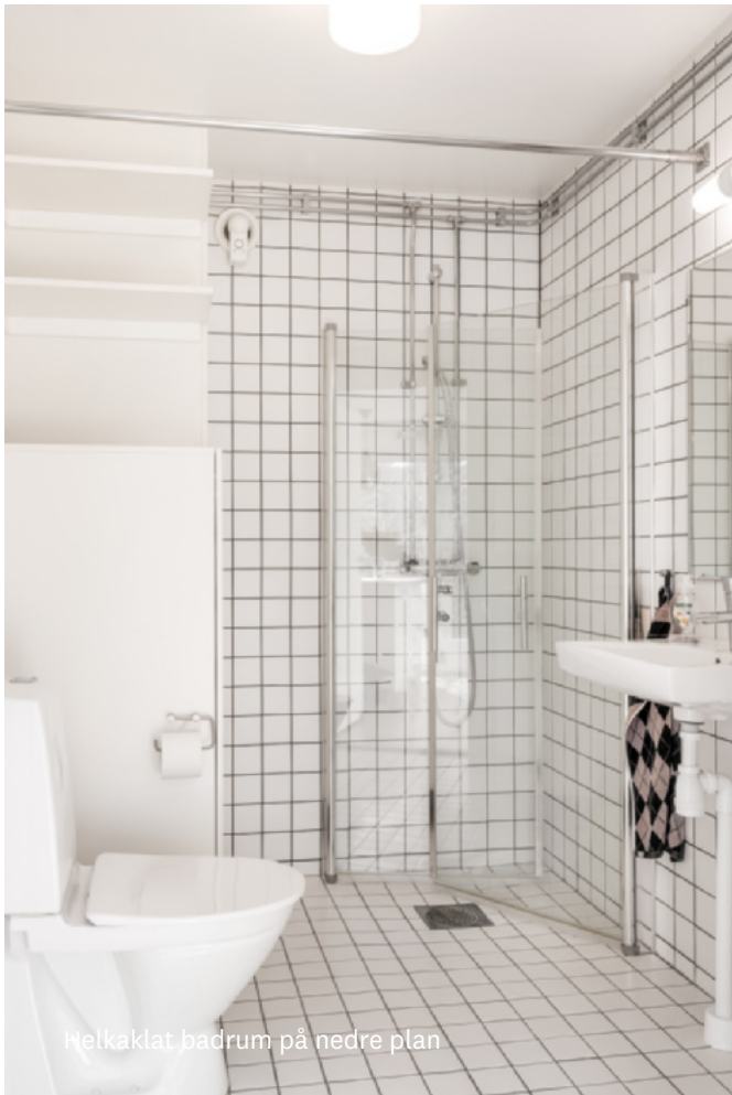
Helkaklat badrum på nedre plan