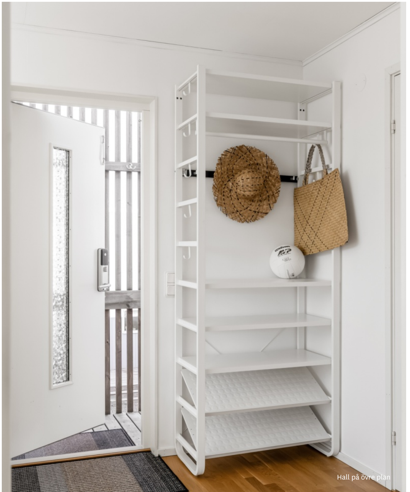
Hall på övre plan