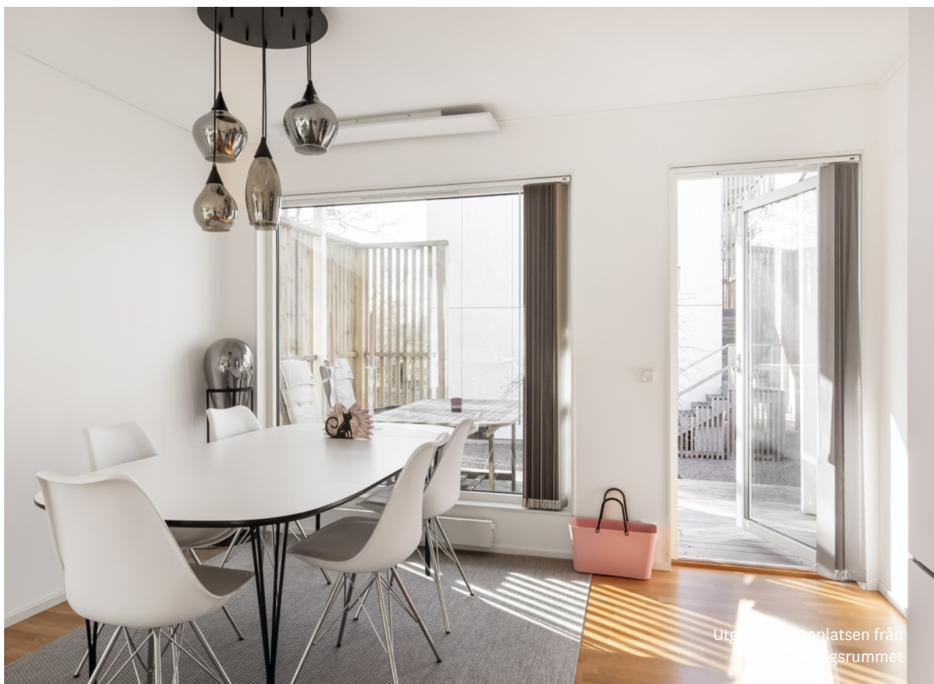
Utgång till terrassplatsen från kök och matsalsrummet