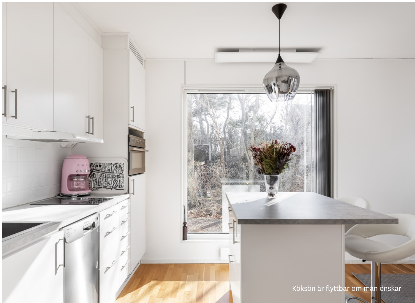
Köksön är flyttbar om man önskar