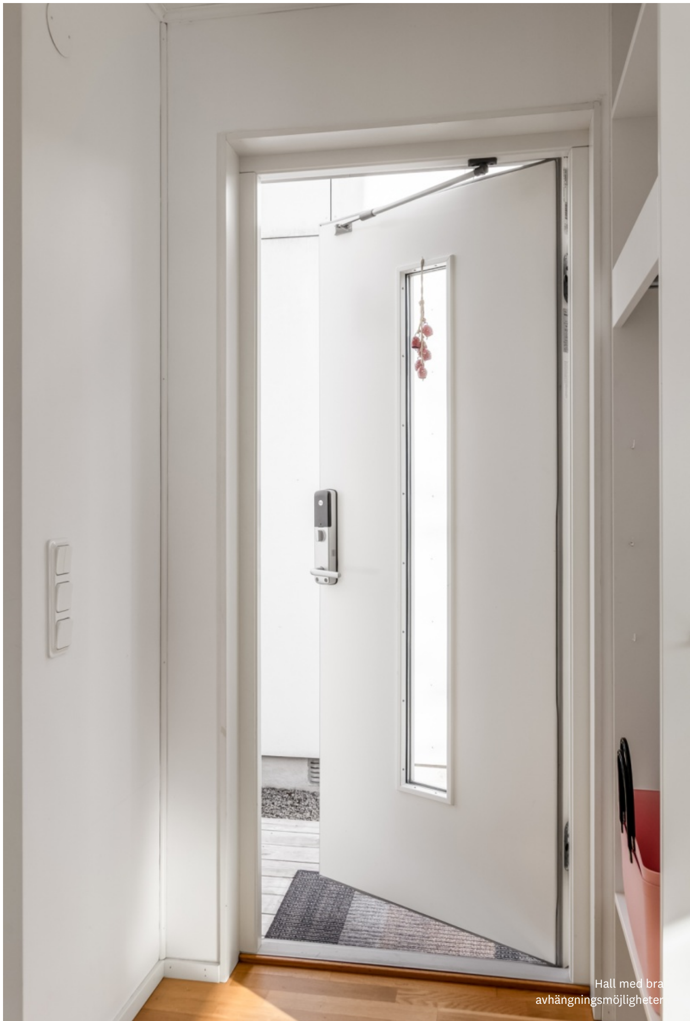
Hall med bra avhängningsmöjligheter