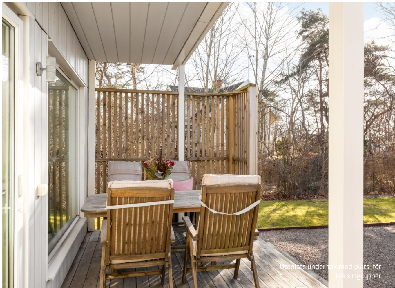
Uteplats under tak med plats för två sittgrupper