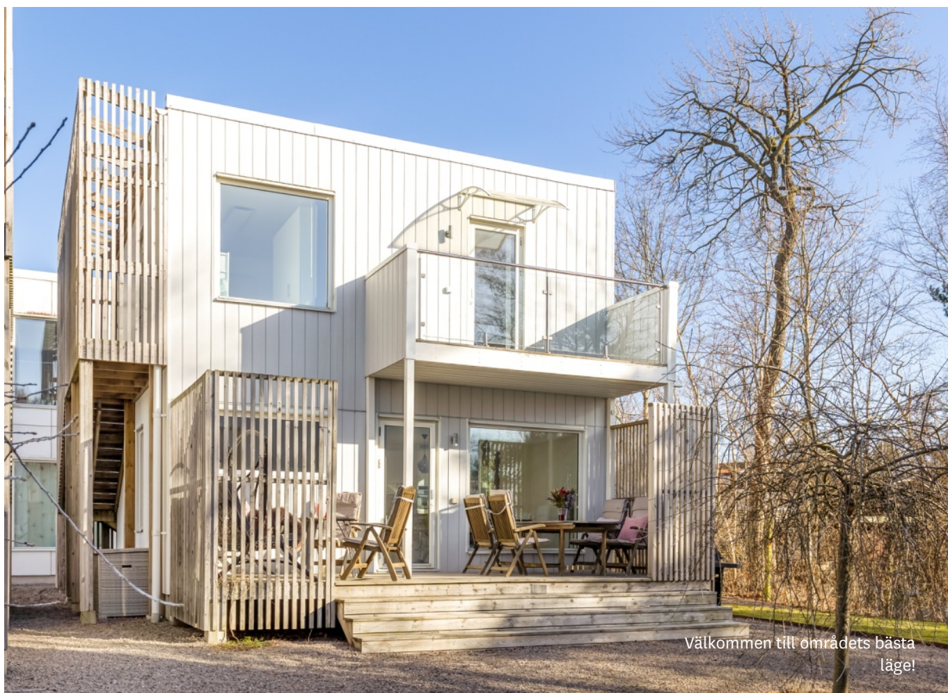
Välkommen till områdets bästa läge!