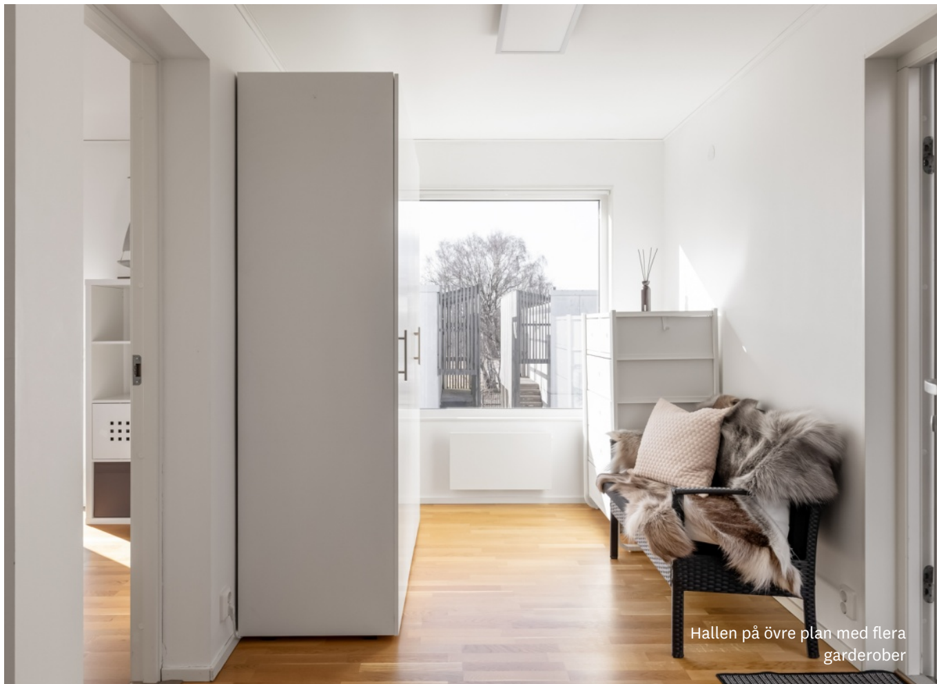
Hallen på övre plan med flera garderober