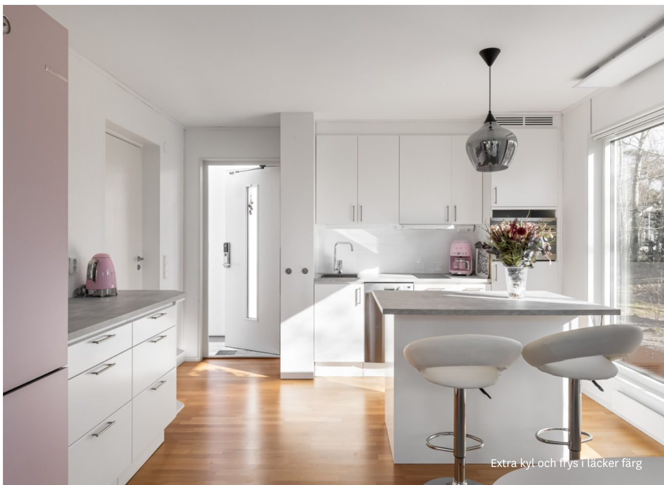
Extra kyl och frys i läcker färg