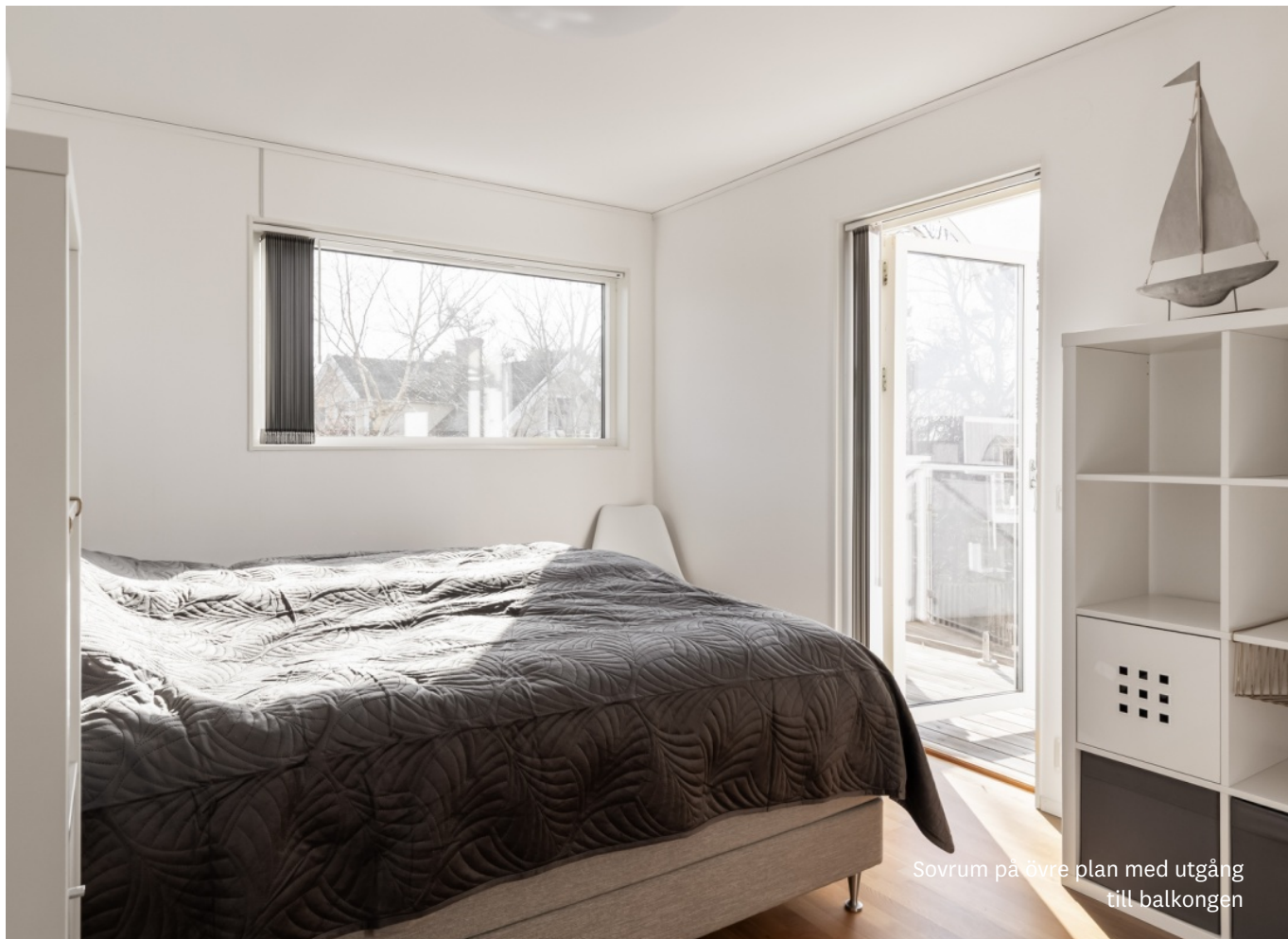
Sovrum på övre plan med utgång till balkongen