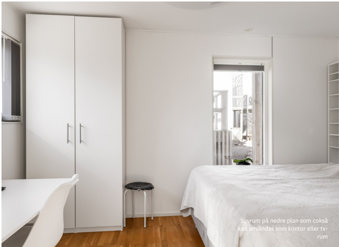
Sovrum på nedre plan som också kan användas som kontor eller tv-rum