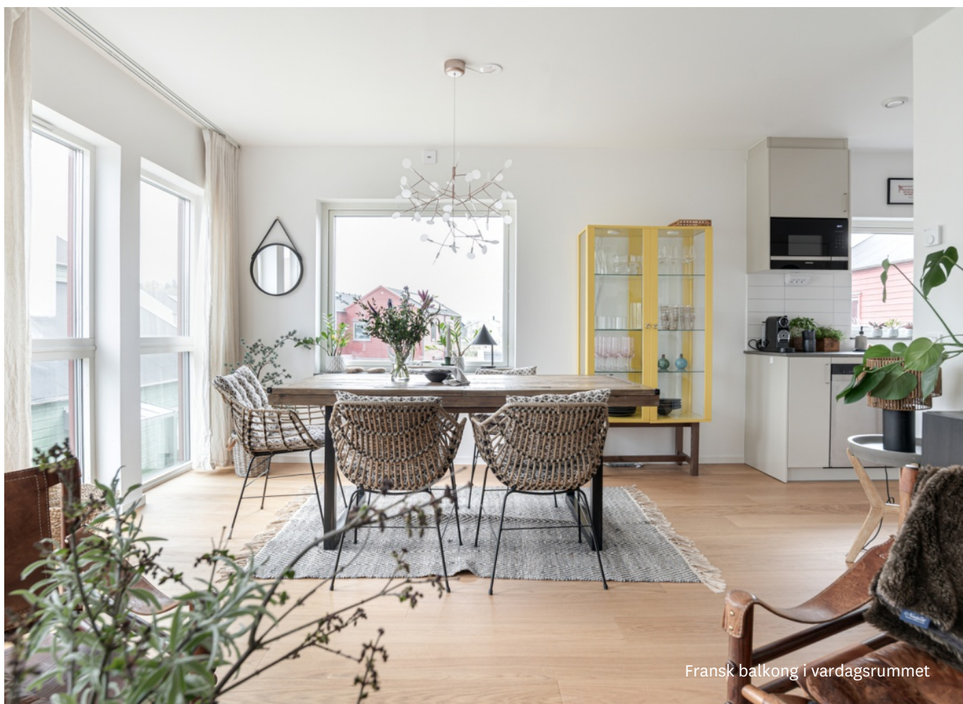
Fransk balkong i vardagsrummet