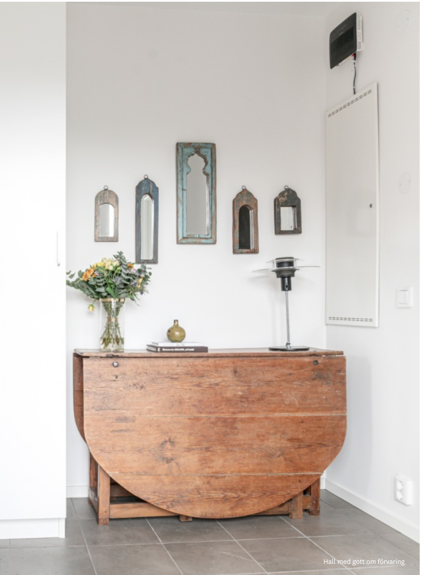
Hall med gott om förvaring