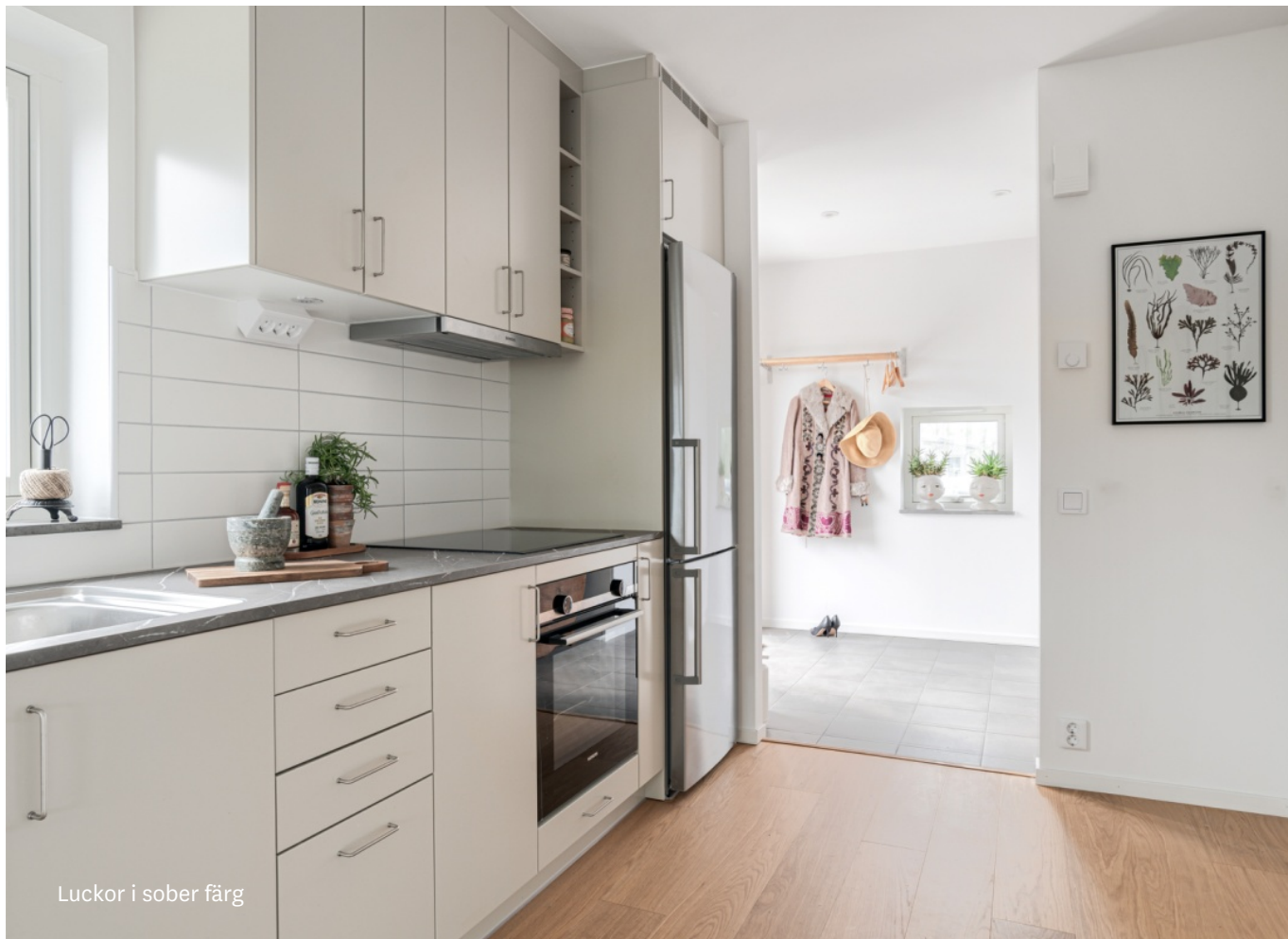
Luckor i sober färg