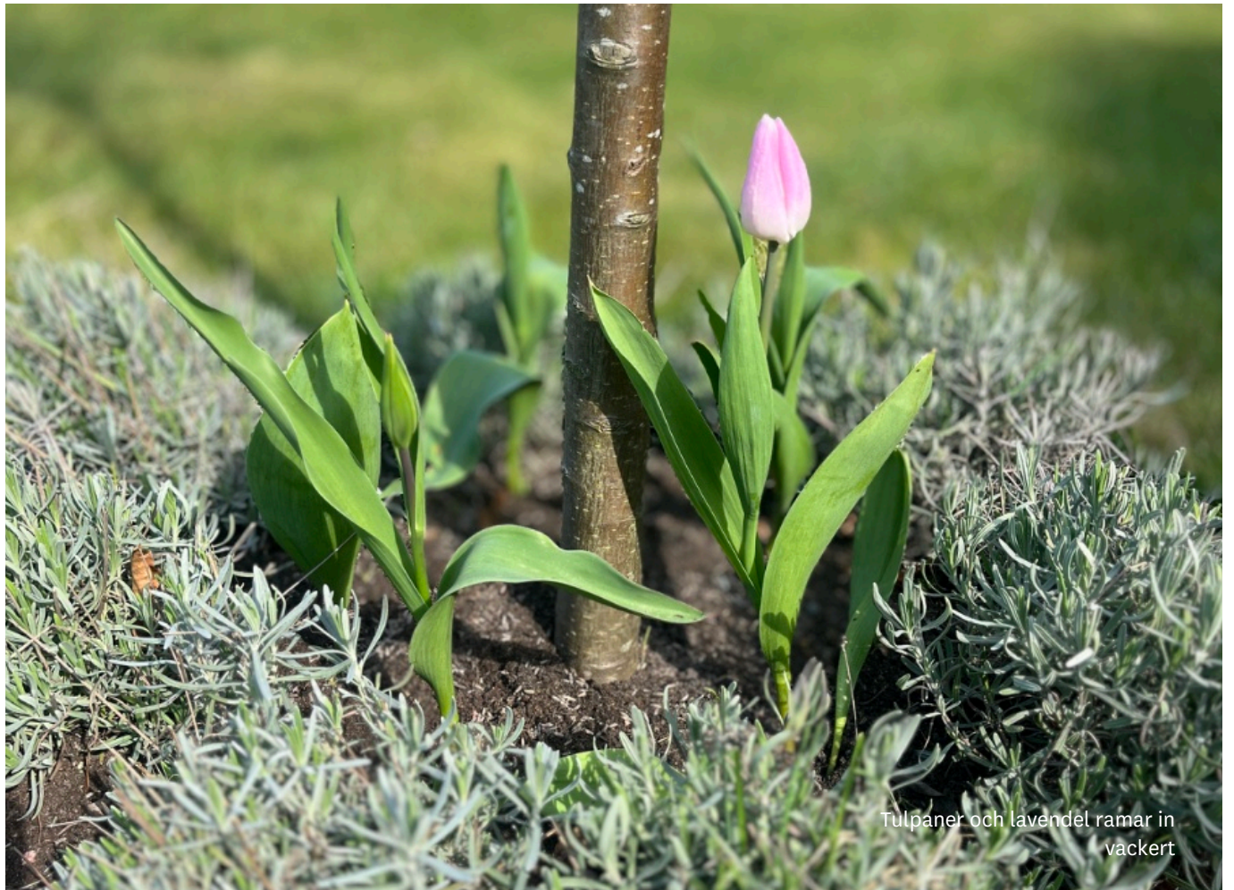
Tulpaner och lavendel ramar in vackert