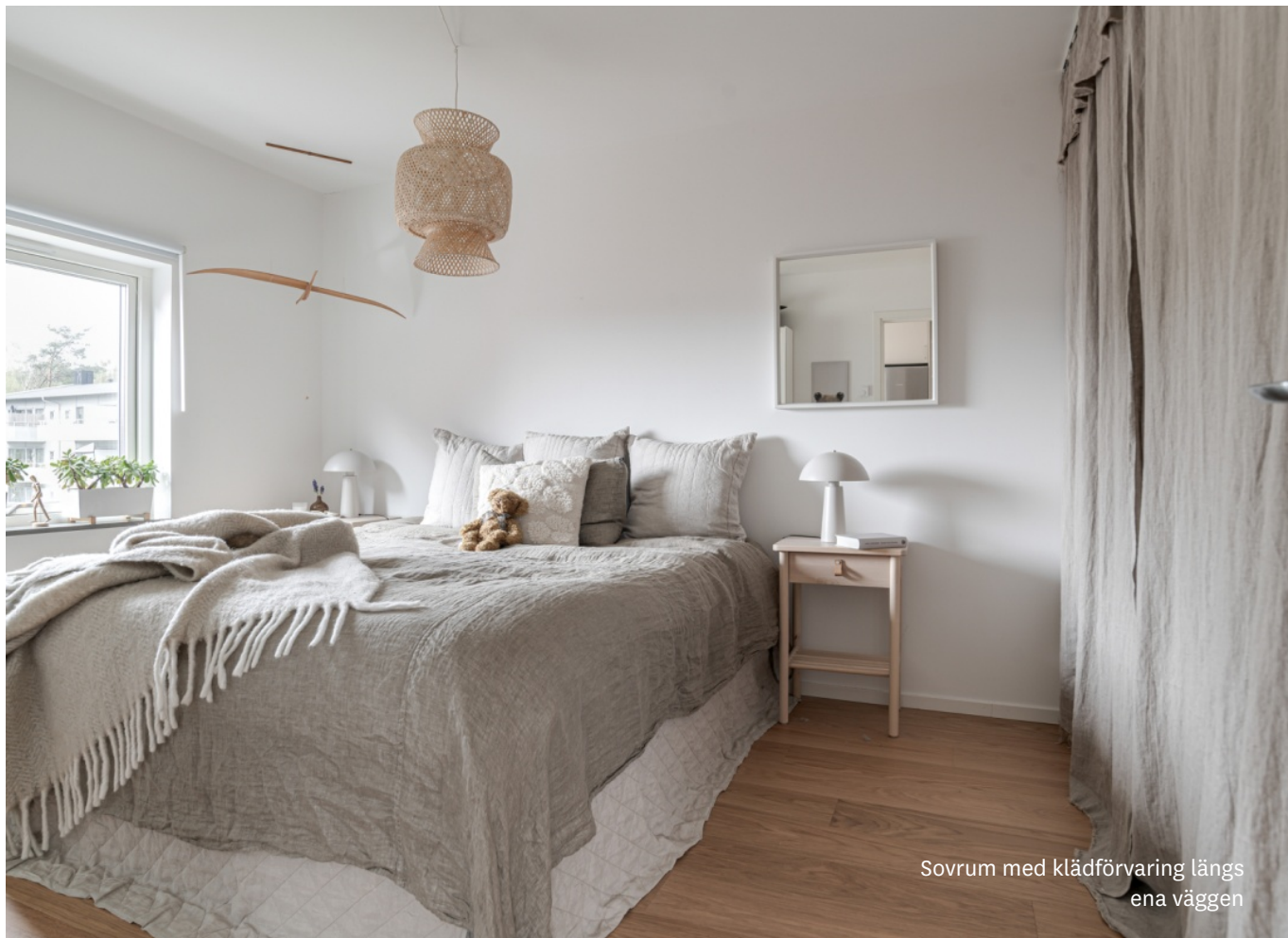
Sovrum med klädförvaring längs ena väggen