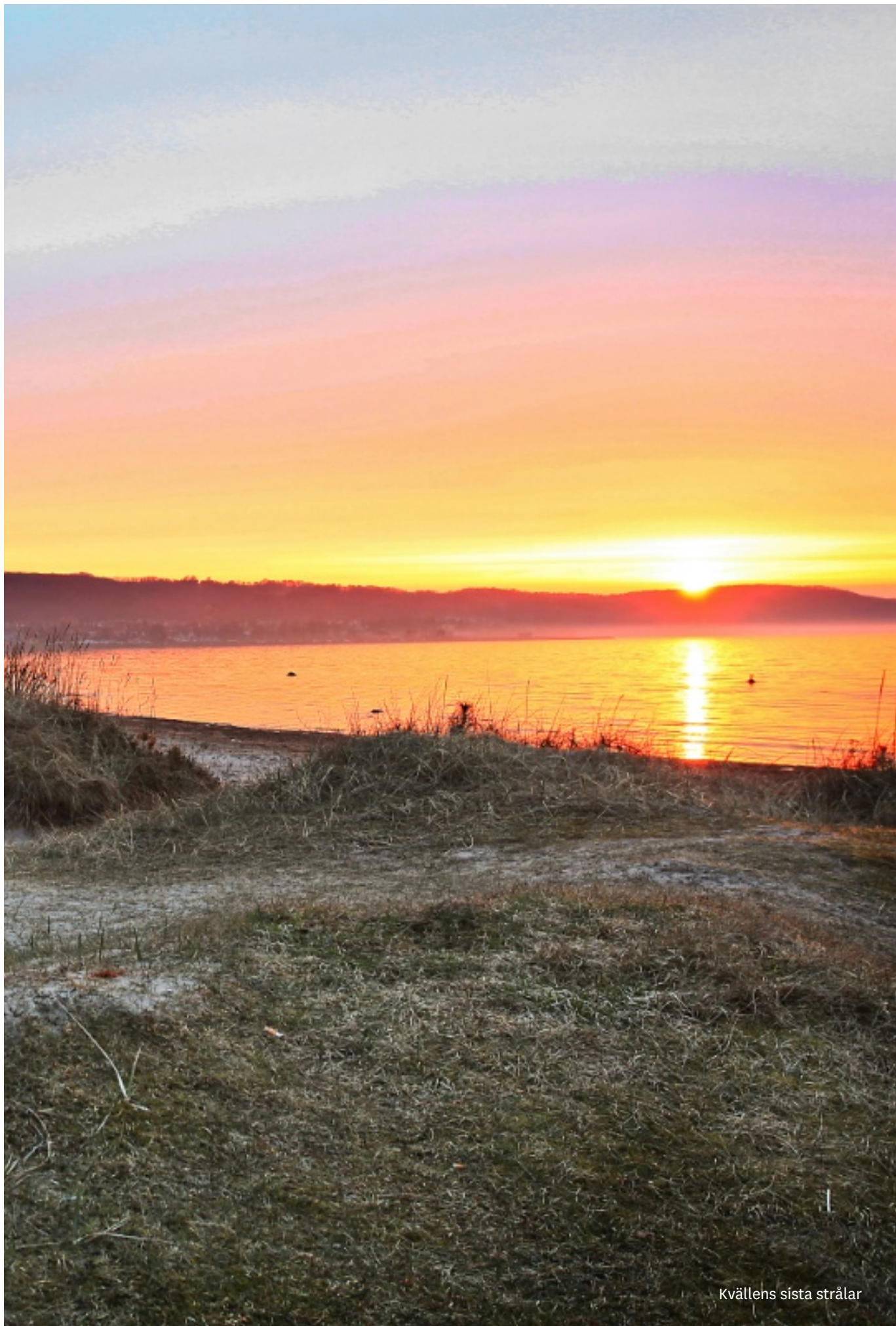
Kvällens sista strålar