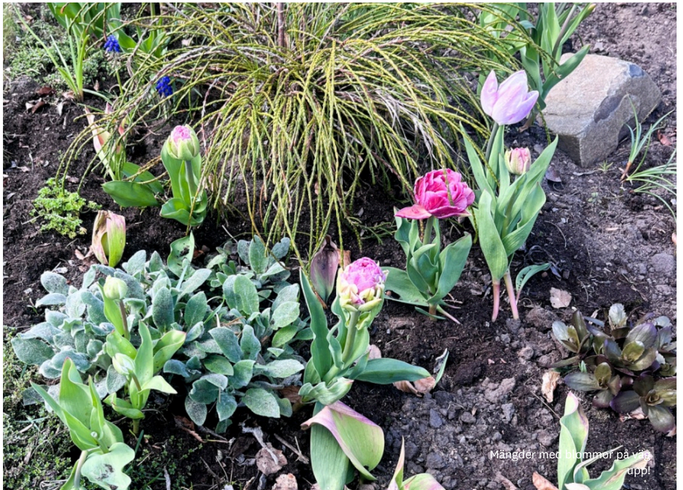
Mängder med blommor på väg upp!