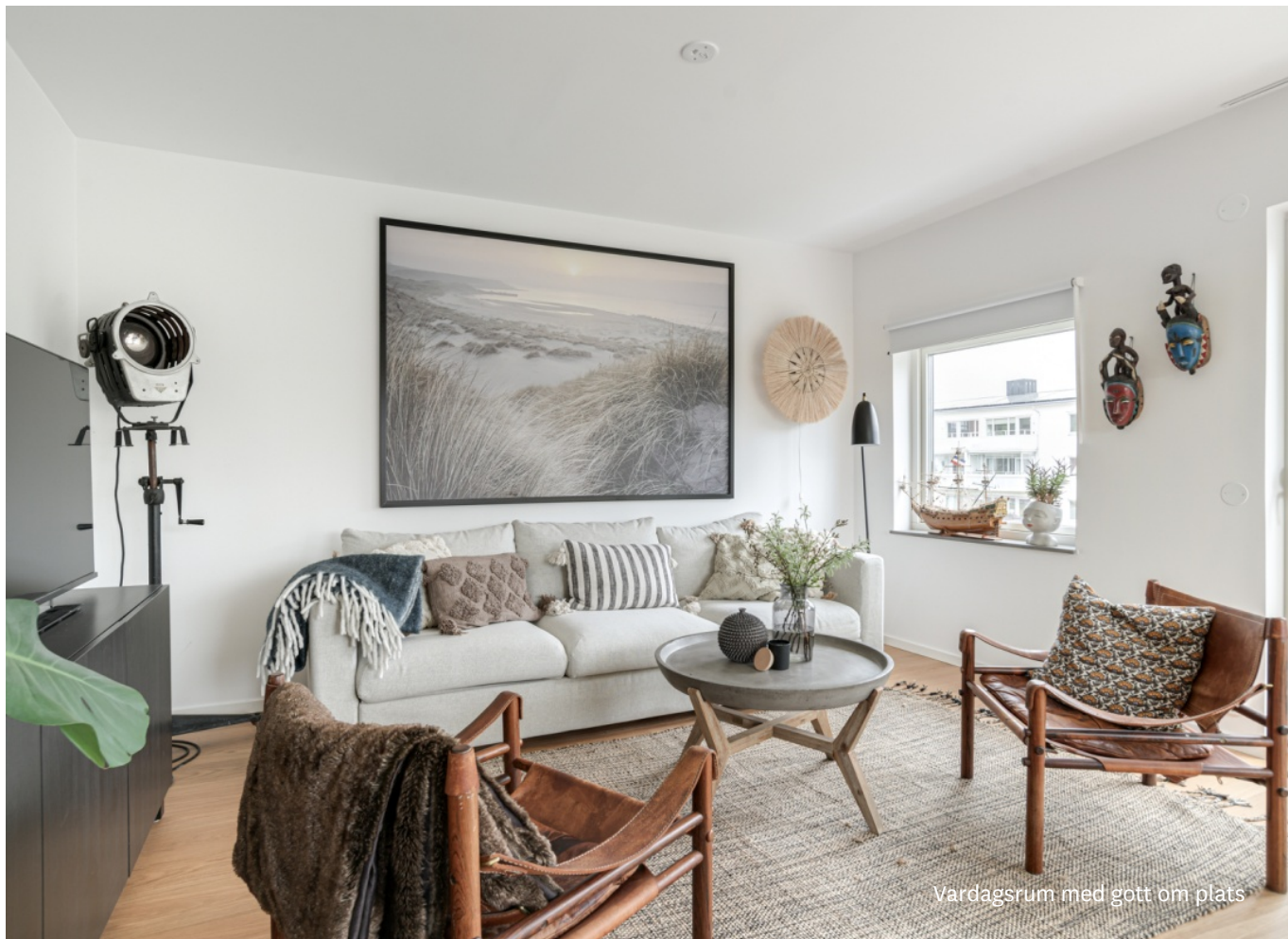
Vardagsrum med gott om plats