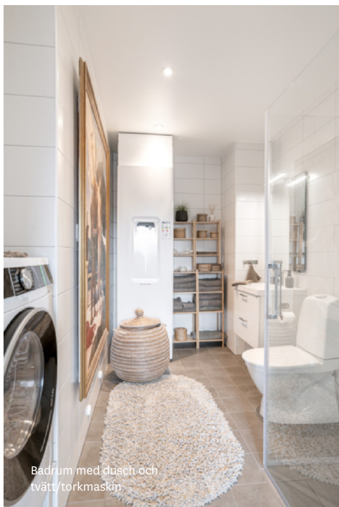
Badrum med dusch och tvätt/torkmaskin