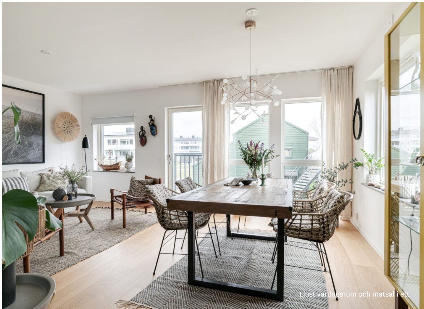
Ljust vardagsrum och matsal i ett