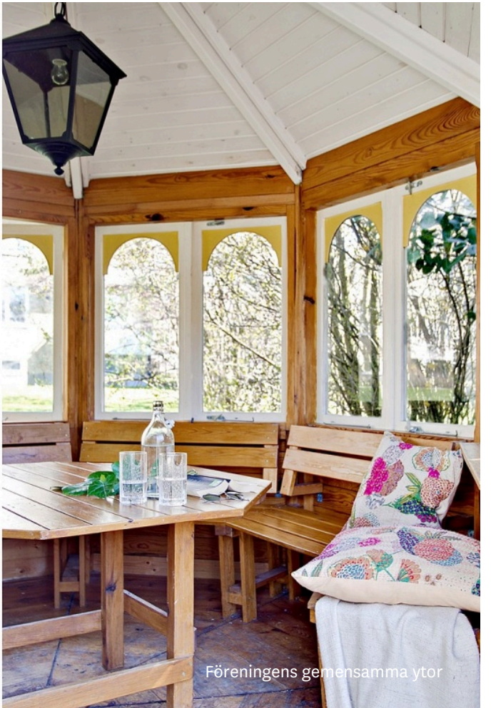
Föreningens gemensamma ytor