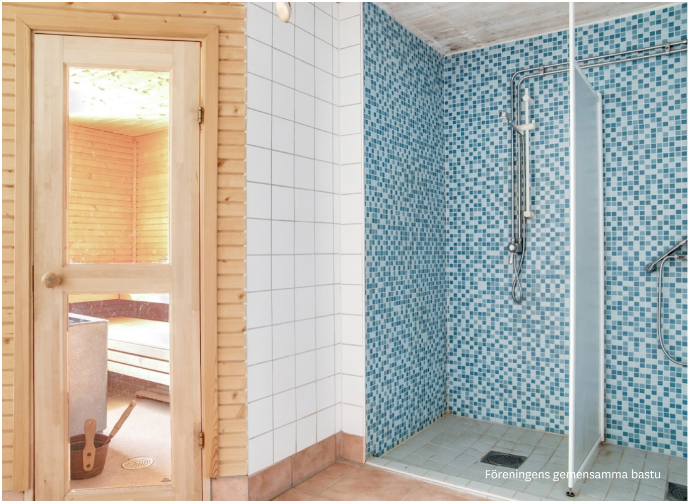
Föreningens gemensamma bastu