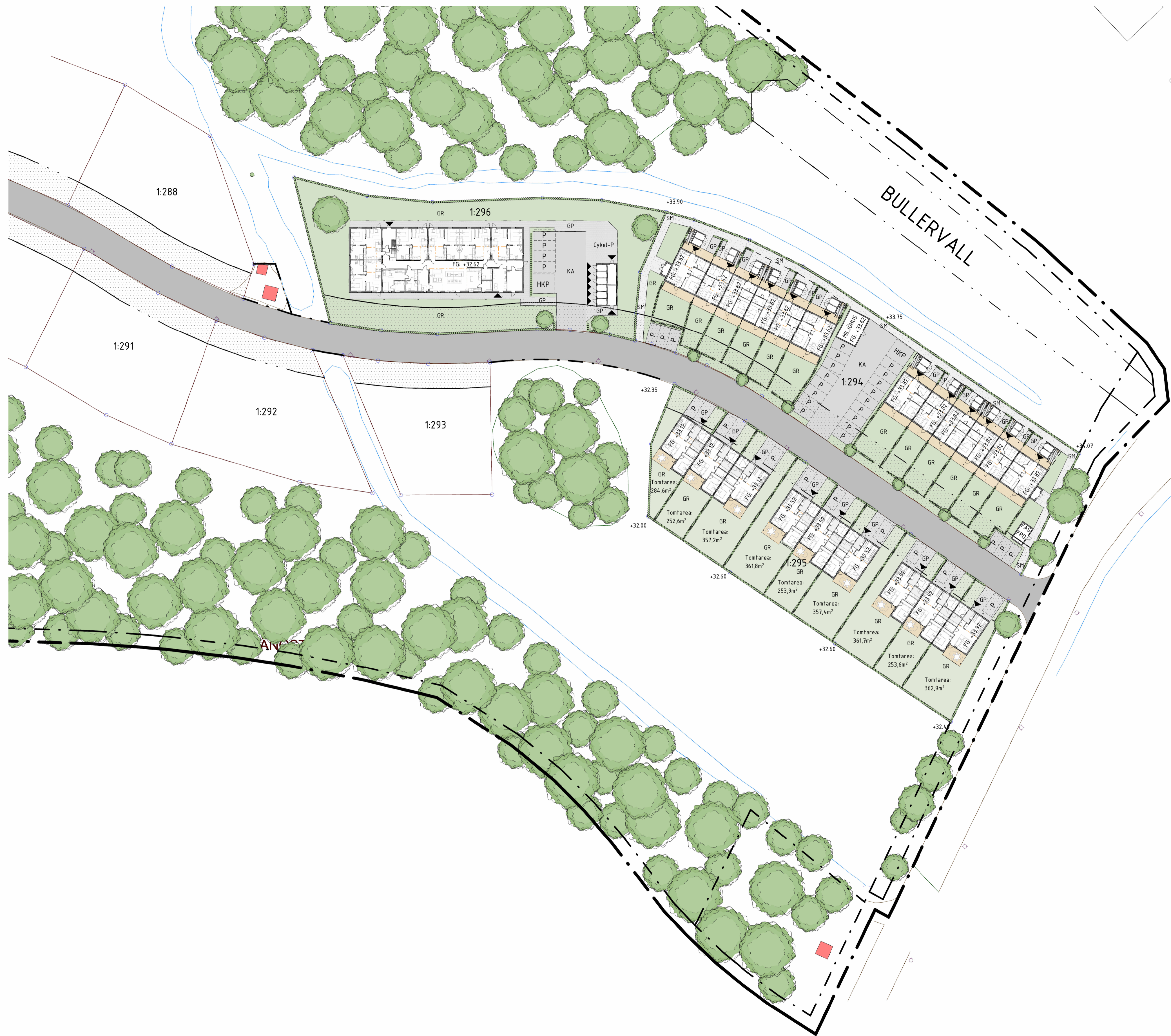
Situationsplan Prospekt 1 : 500