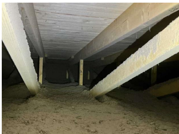
Bild 3: Invändigt, Vind, Vinden är besiktad i anslutning till vindslucka pga för trångt utrymme ca 1 takstolsfack Inget särskilt att notera