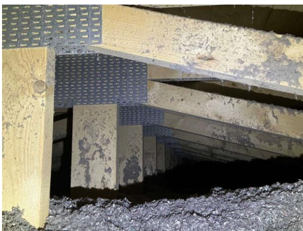
Bild 4: Invändigt, Vind, Vinden är besiktad i anslutning till vindslucka pga för trångt utrymme ca 1 takstolsfack Inget särskilt att notera