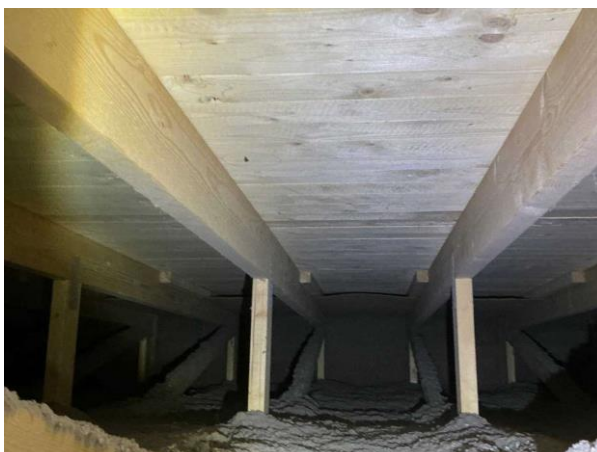
Bild 2: Invändigt, Vind, Vinden är besiktad i anslutning till vindslucka pga för trångt utrymme ca 1 takstolsfack Inget särskilt att notera