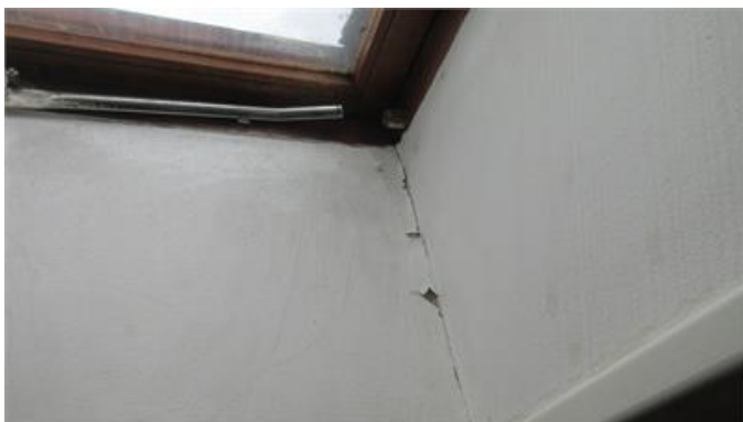
Missfärgningar/formförändringar i anslutning till takfönster.