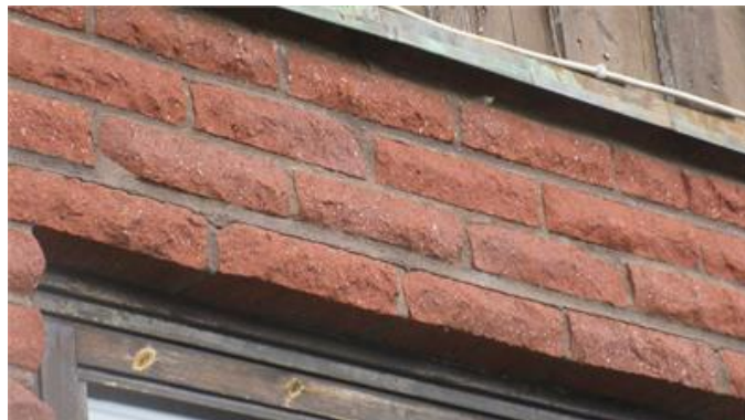
Fogsläpp ovan ett fönster.