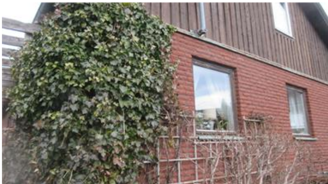
Vegetation intill husliv.