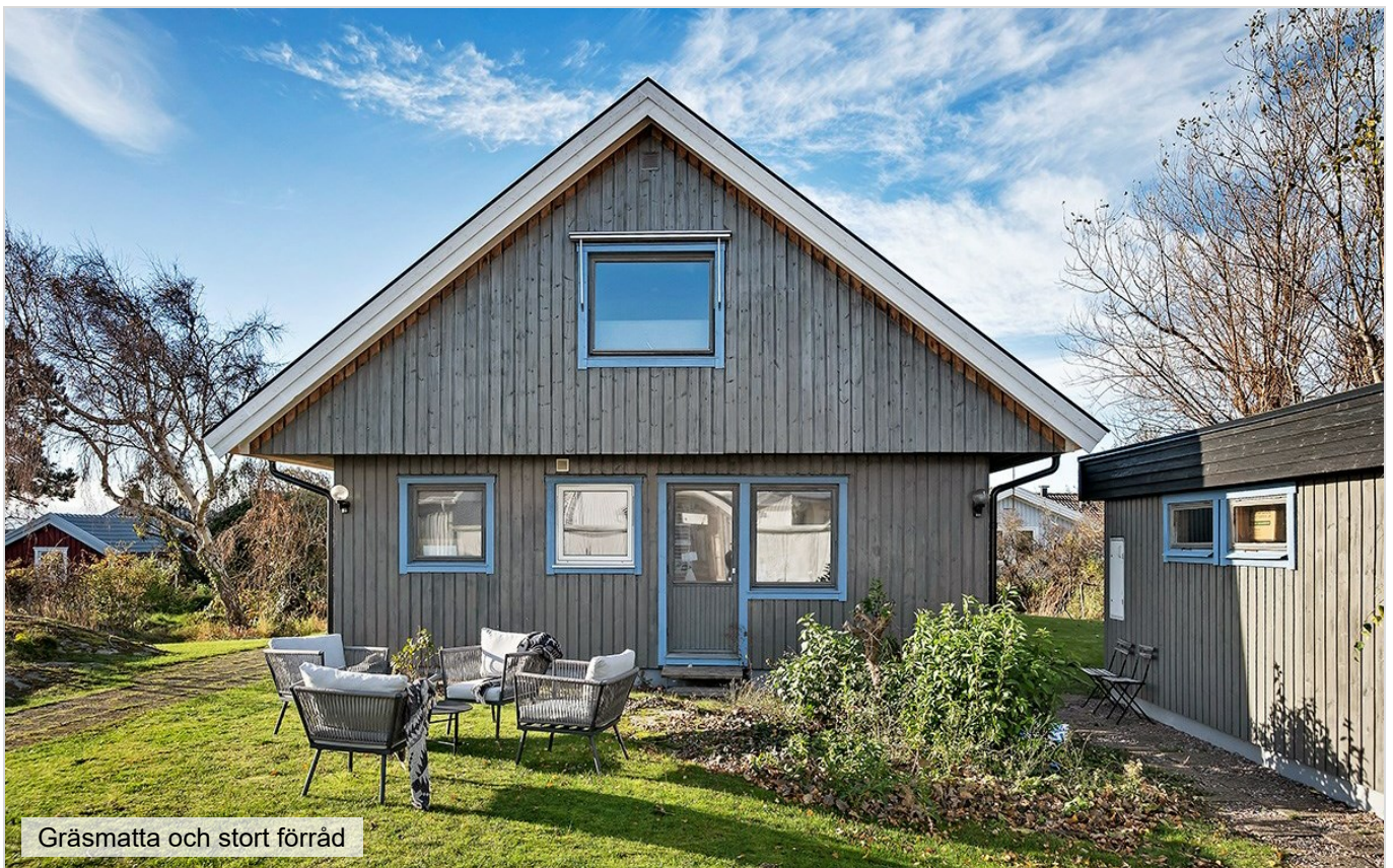
Gräsmatta och stort förråd