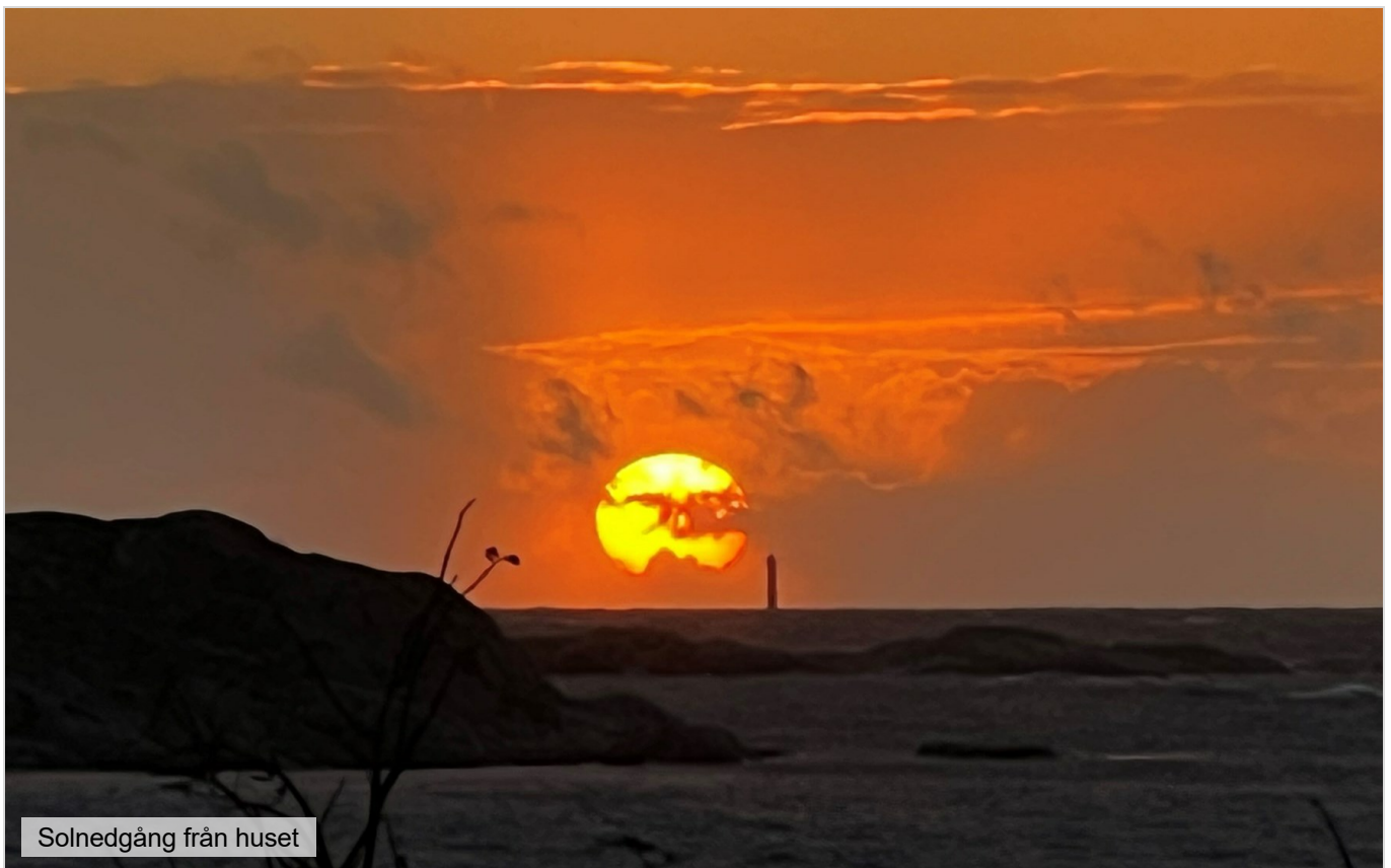
Solnedgång från huset