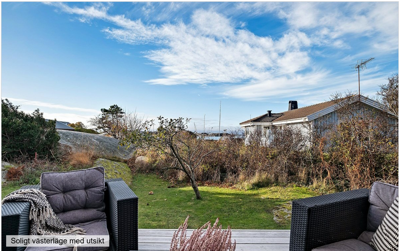
Soligt västerläge med utsikt