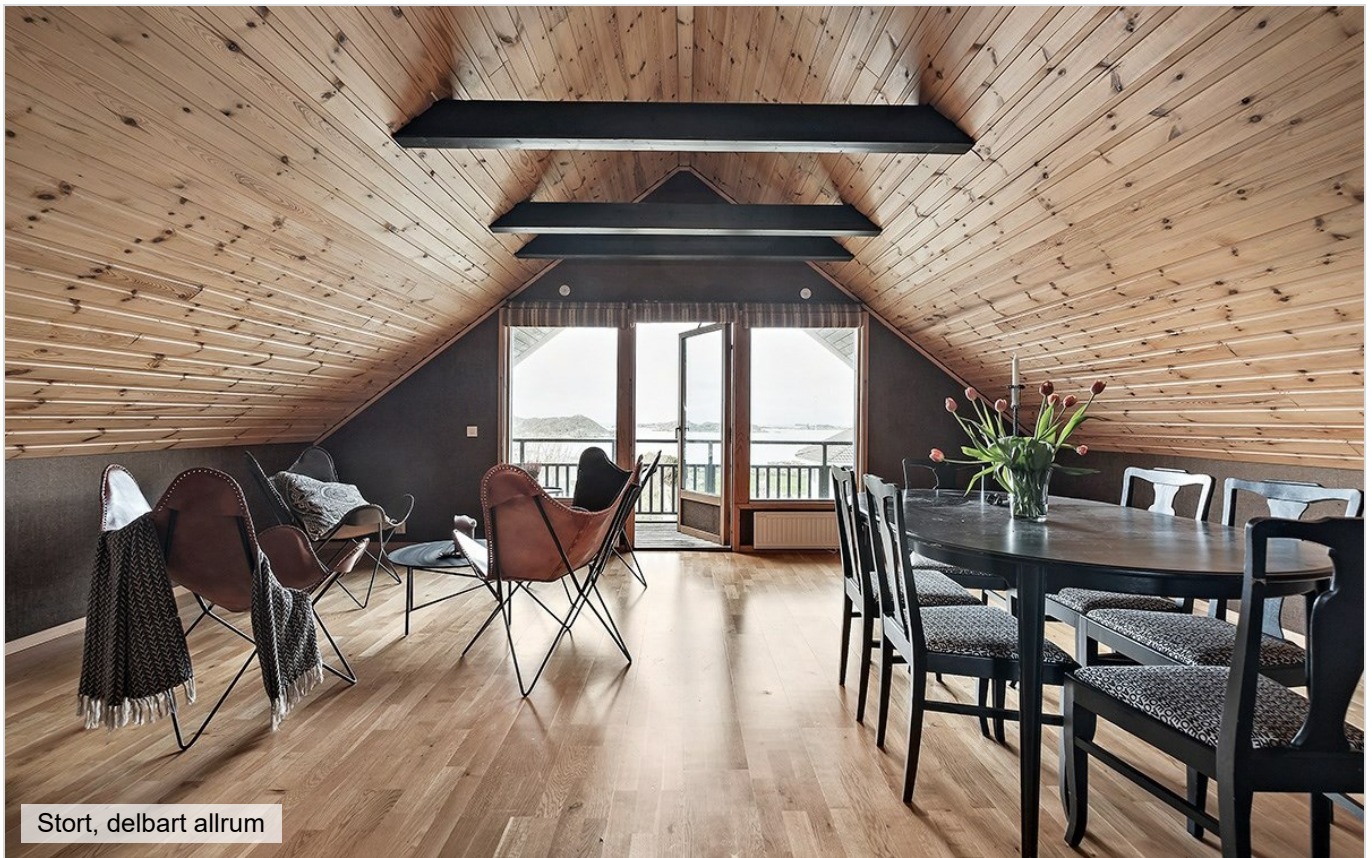
Stort, delbart allrum