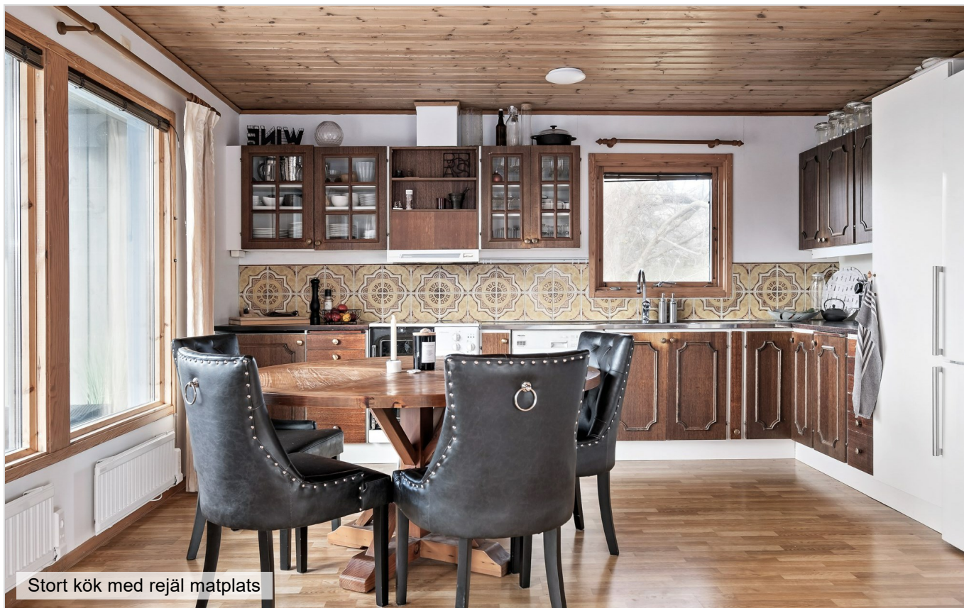
Stort kök med rejäl matplats