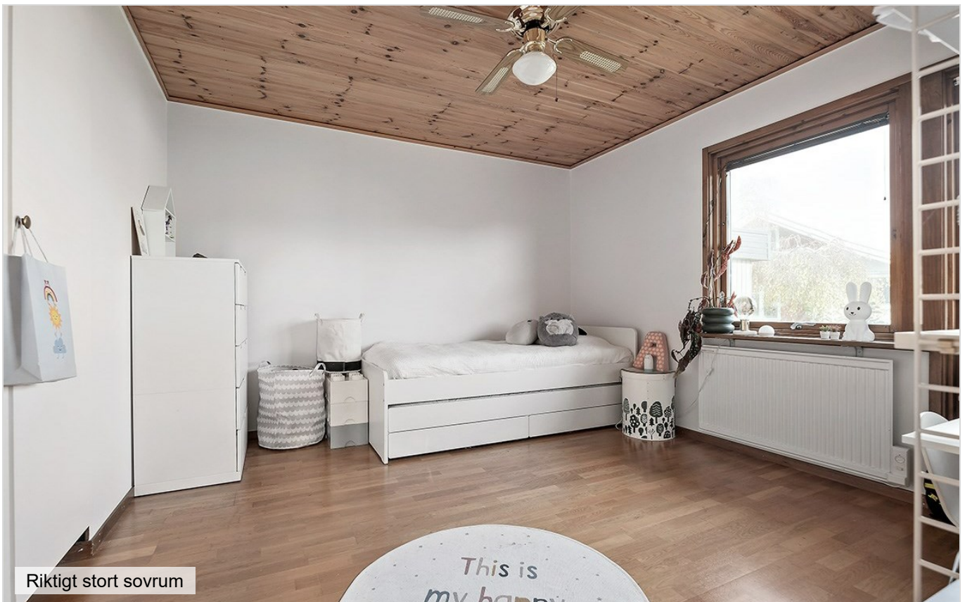
Riktigt stort sovrum