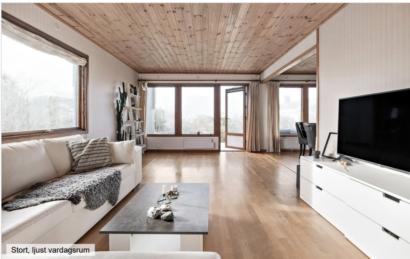
Stort, ljusst vardagsrum