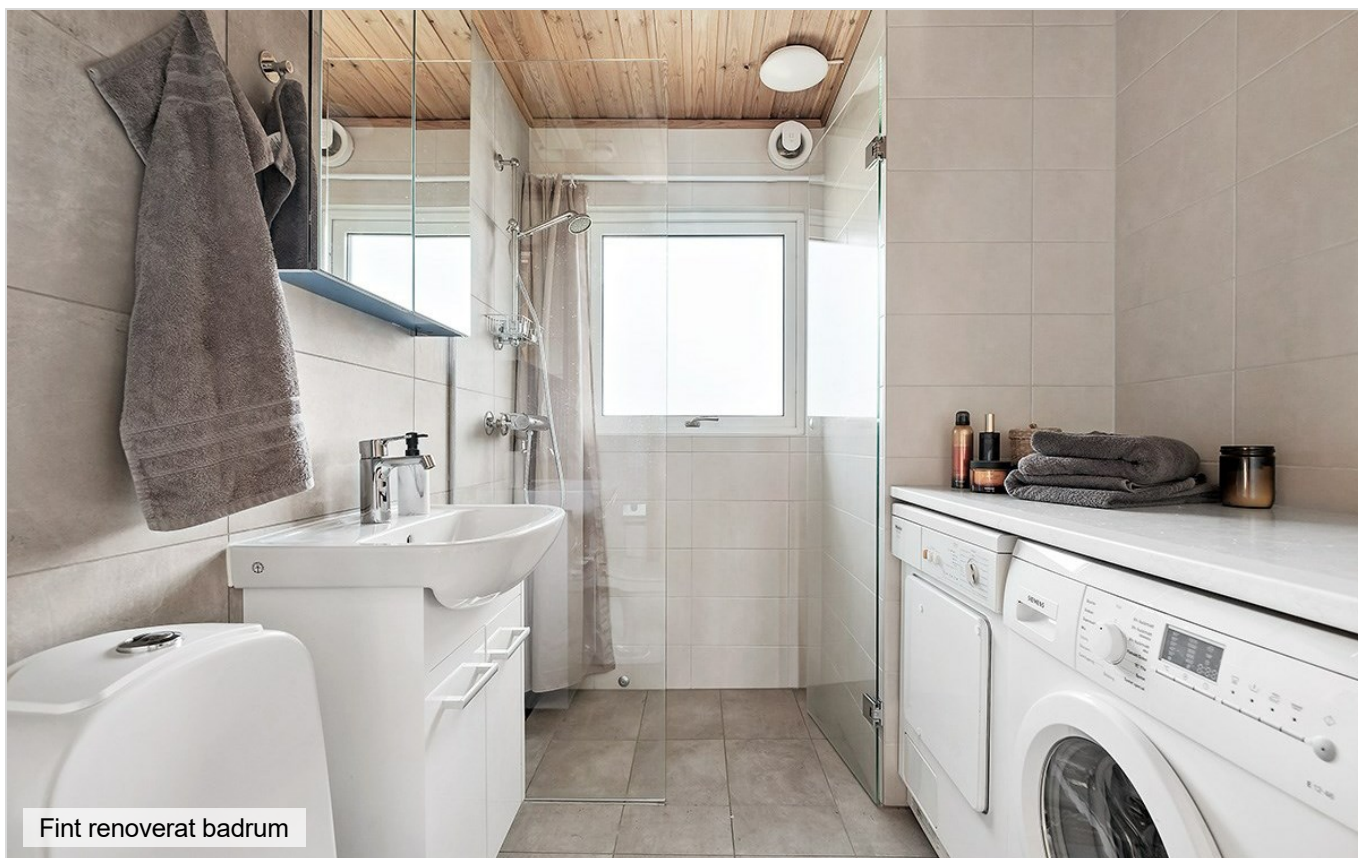
Fint renoverat badrum