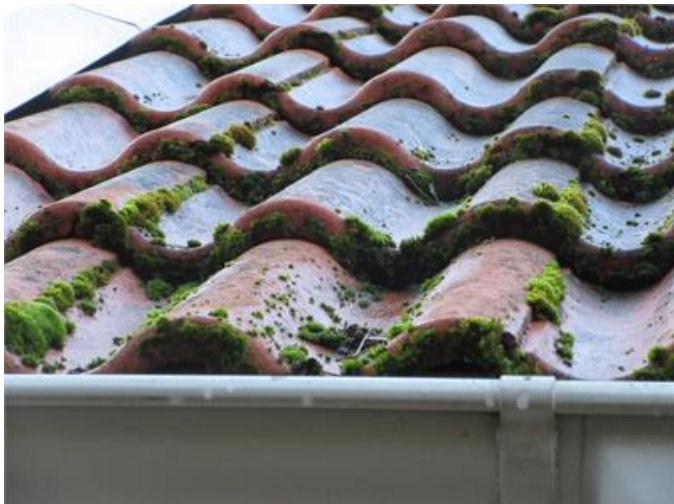
Mossa på tak.