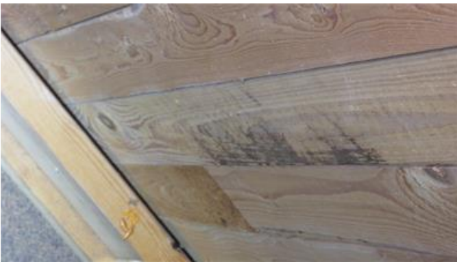
Mikrobiell påväxt på nockvindens underlagstak.