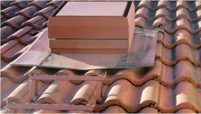
Plåthuv på tak täcker dåligt över pannor.