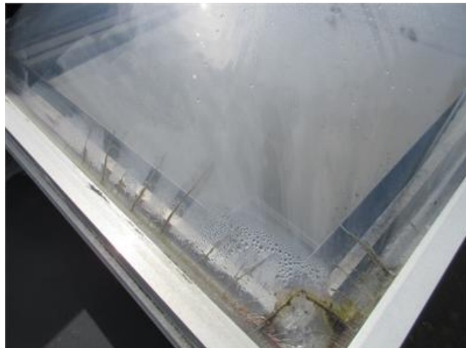
Sprucken och anlöpt takkupol.