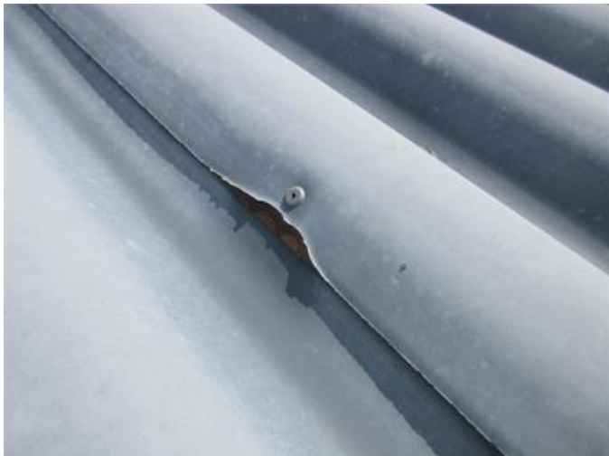
Ytrost på takbeklädnad.