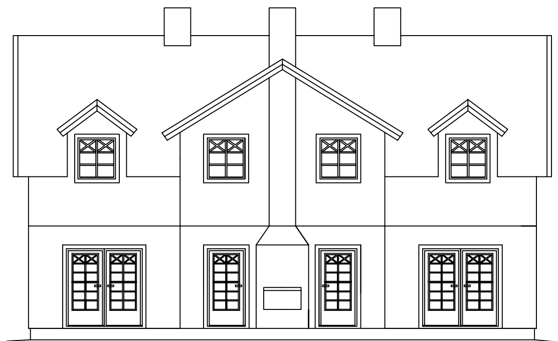
Fasad mot Sö