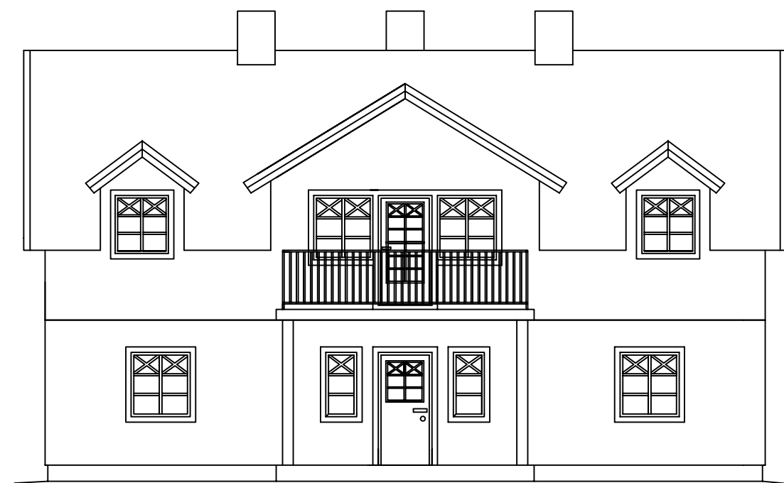
Fasad mot NV

NYNÄSHAMNS KOMMUN Samhällsbyggnadsnämnden Ankomst: 2021-08-30 Dnr: 2021/1359/237-1