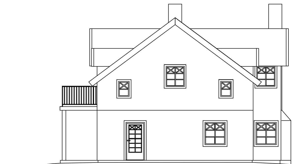
Fasad mot SV