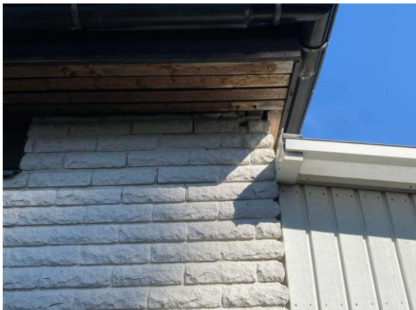
Bild 1: Utvändigt, Fasad, Färgsläpp finns på träpanelen Sprickor finns i tegelfasaden samt enstaka lösa stenar noterades vid murstocken