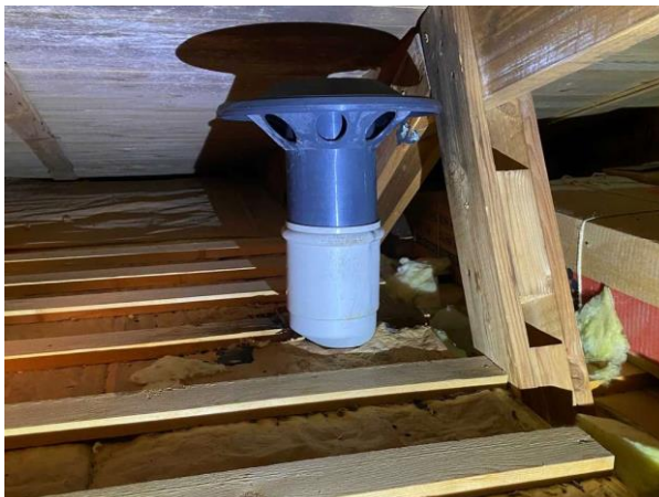
Bild 2: Utvändigt, Vind, Luftningen till avloppet avslutas på vinden (