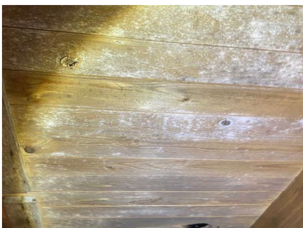
Bild 3: Utvändigt, Vind, Spår av tidigare läckage noterades Lokalt noterades det mikrobiell påväxt på underlagstaket