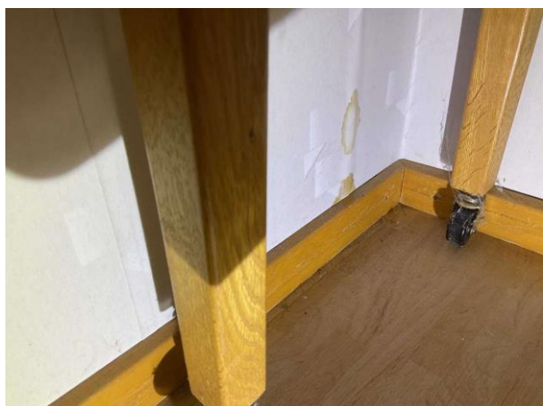
Bild 9: Invändigt, Entréplan, Sovrum 2, Fuktläck på vägg (torrt vid besiktningsstillfället)