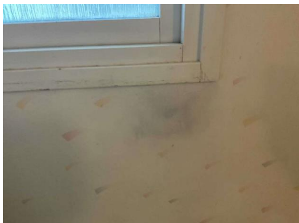
Bild 1: Invändigt, Entréplan, Badrum, fuktskada på vägg under fönster