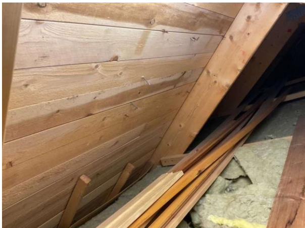
Bild 1: Utvändigt, Vind, Lokalt pånockvinden noterades det mikrobiell påväxt på underlagstaket...