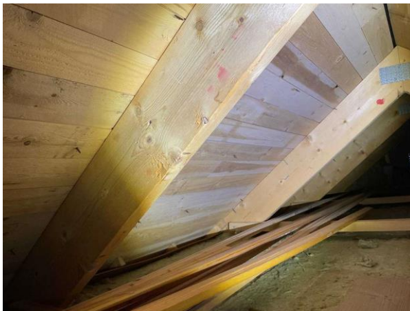
Bild 2: Utvändigt, Vind, Lokalt pånockvinden noterades det mikrobiell påväxt på underlagstaket...