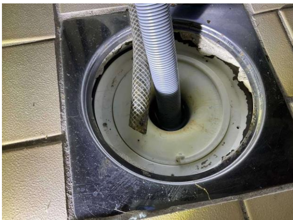
Bild 3: Invändigt, Entréplan, Groventré/tvättstuga, Äldre våtrum Klämring saknas i golvbrunnar Tätskiktet i golvbrunnen är synlig