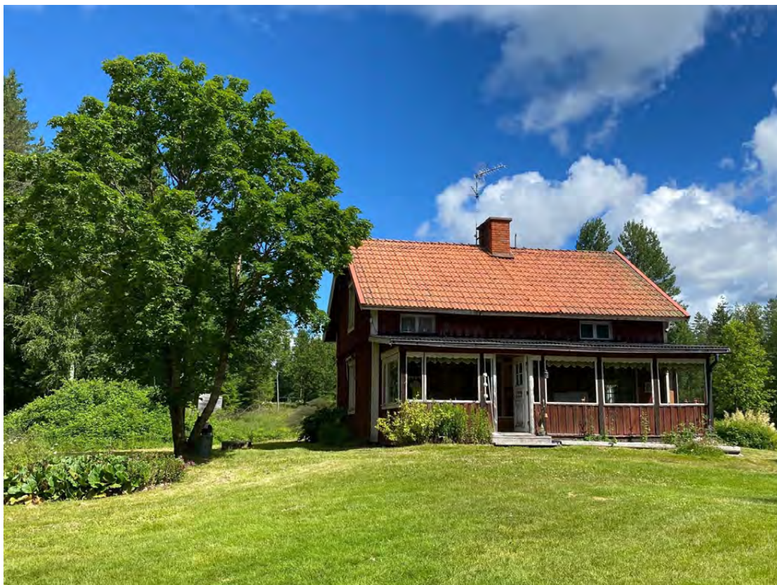
Hjärtligt välkommen till Östra Näsberg 53