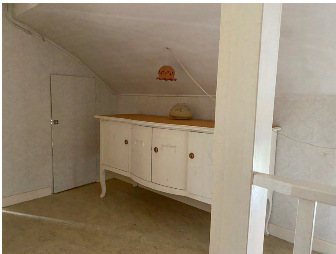
Kattvind rakt fram