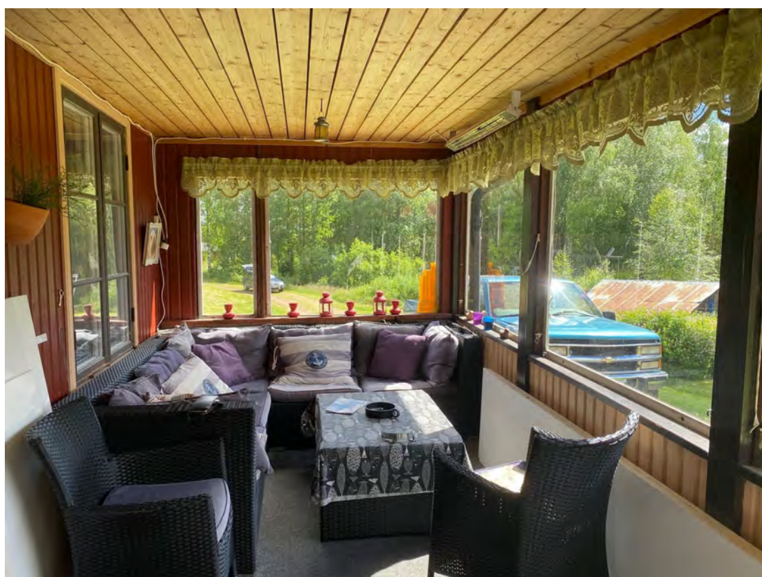
Skönt med inglasad veranda som förlänger säsongen