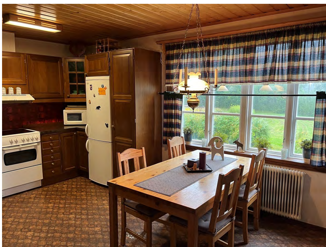
Köket med sitt stora fönster