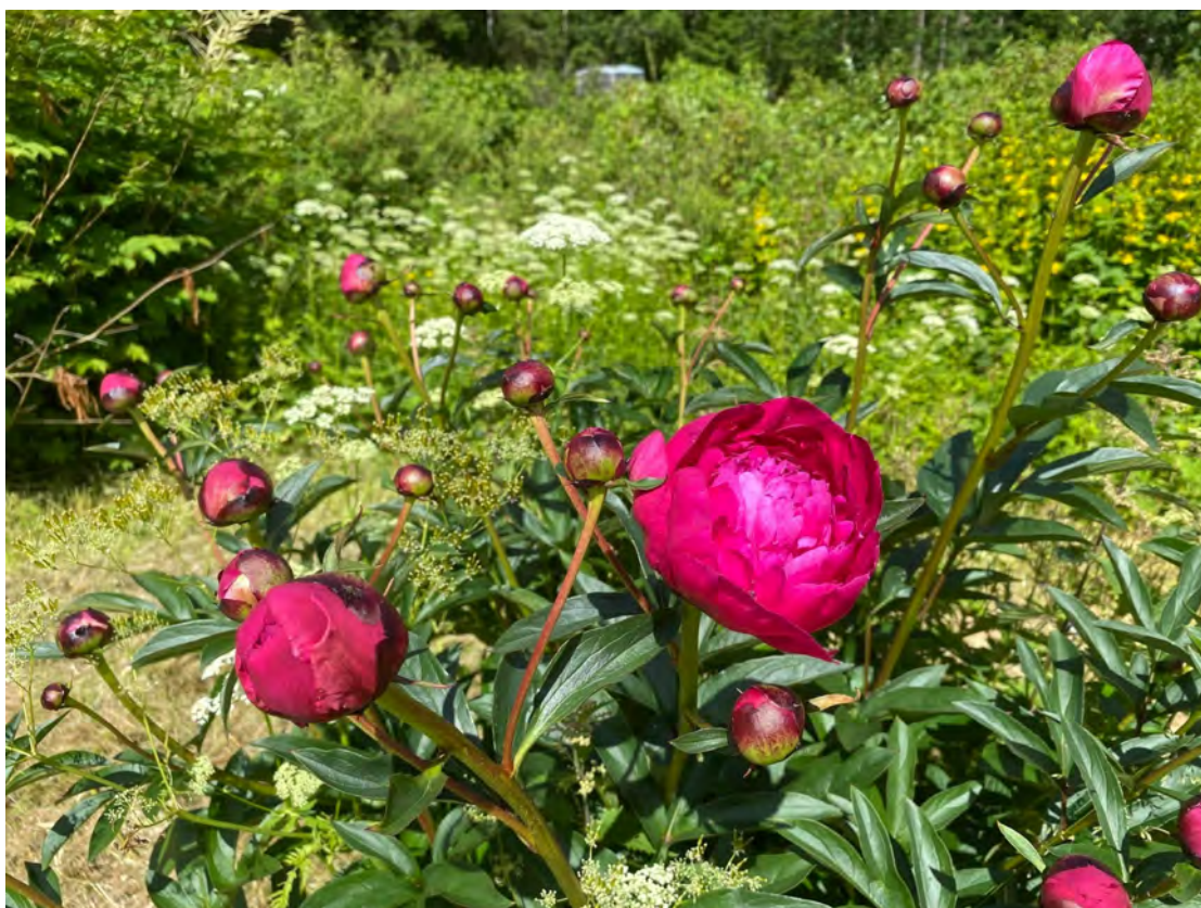
Bondpionen är en stadig bekant i äldre miljöer