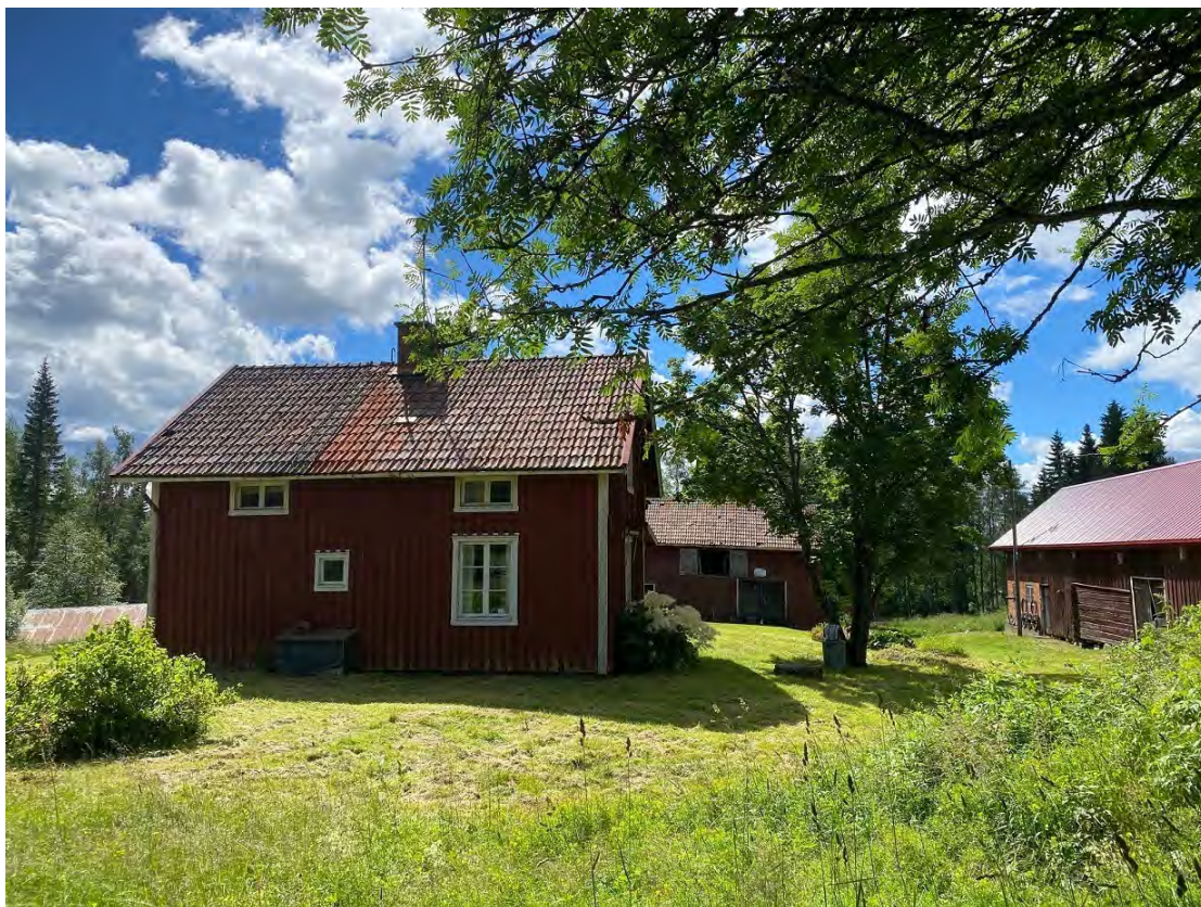
Härlig gammal gårdsbild