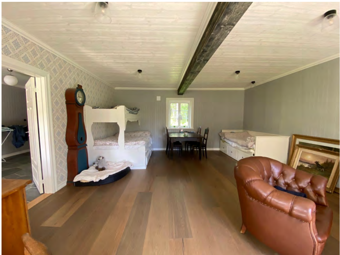
Rummet i utbygget, perfekt för gäster