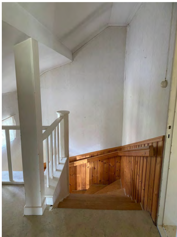
Hallen på övervåningen