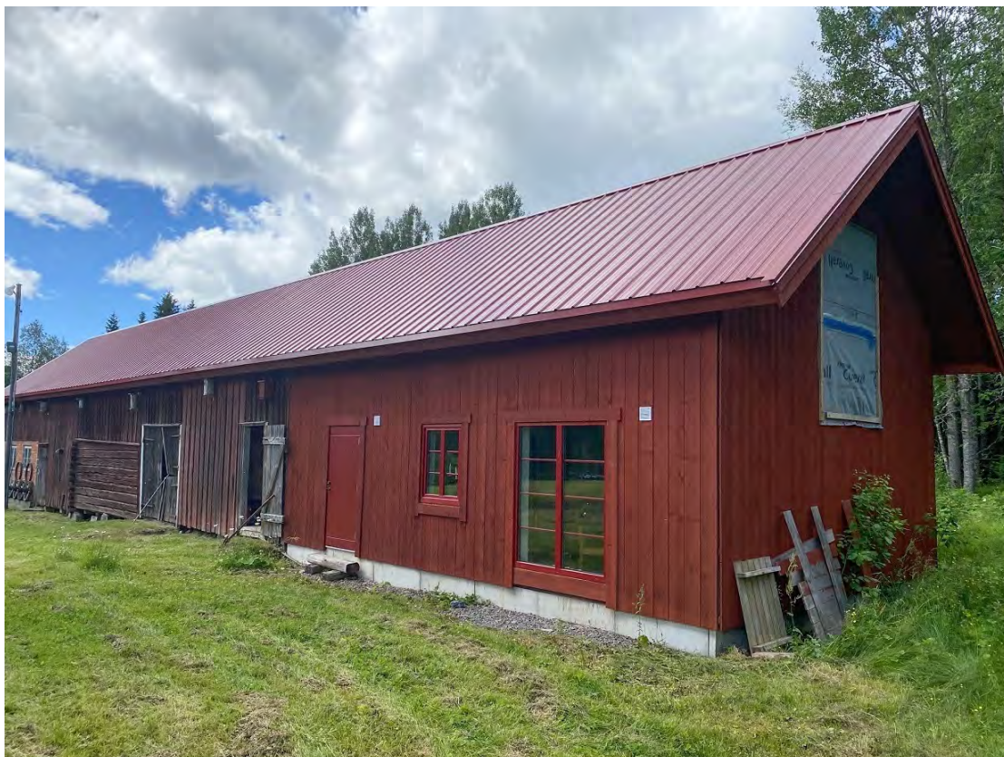
Utbygget på ekonomibygnaden