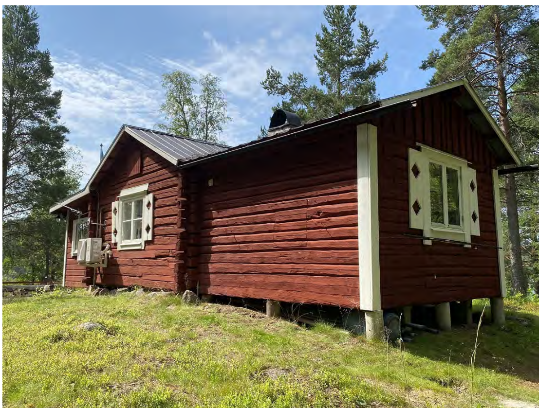
Huvudbyggnaden på baksidan