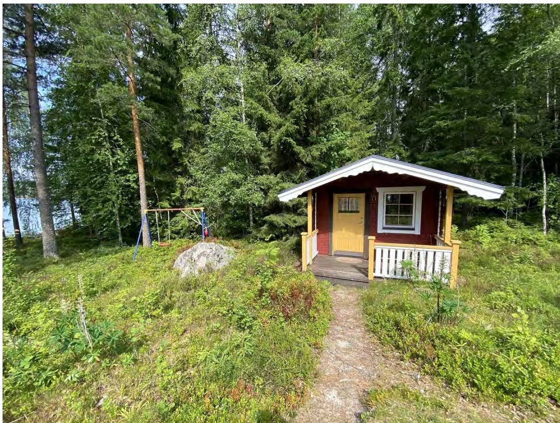
Gästhus med 4 bäddar.