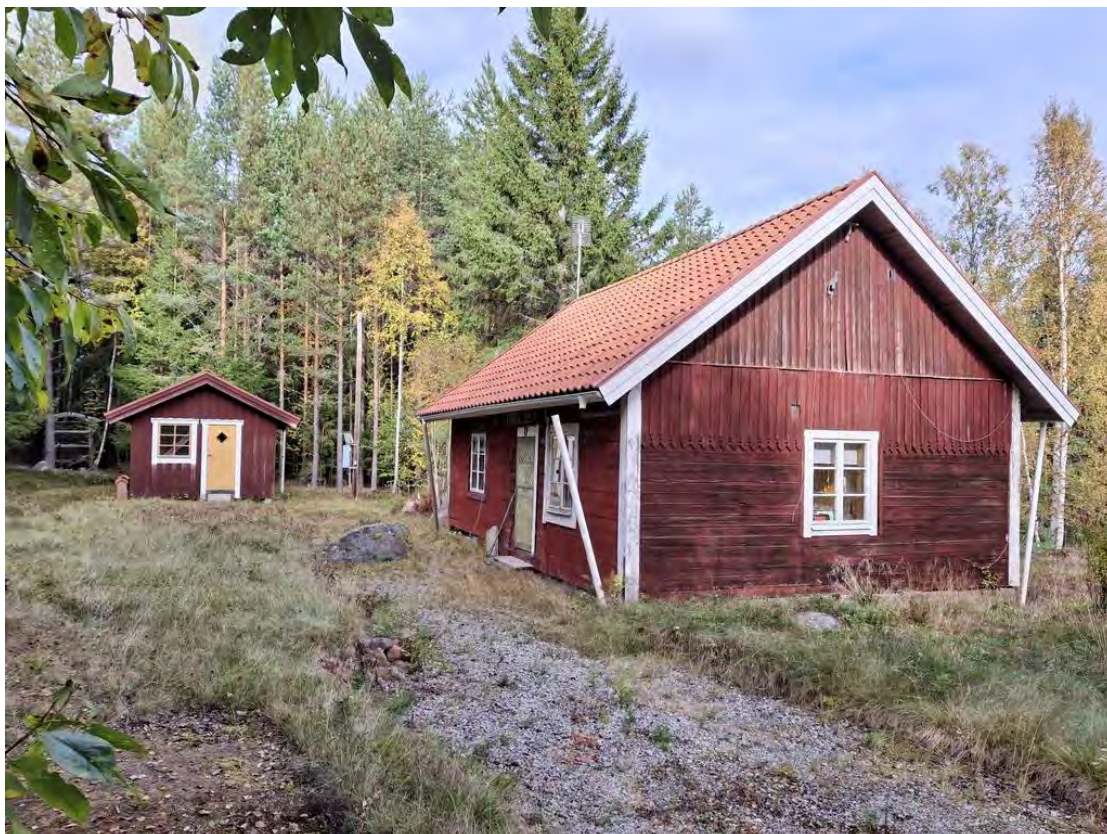
Huvudbyggnad samt gästhus/förråd