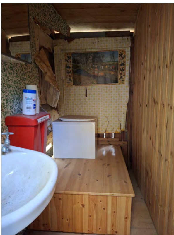
Hemlighuset med PACTO-toalett