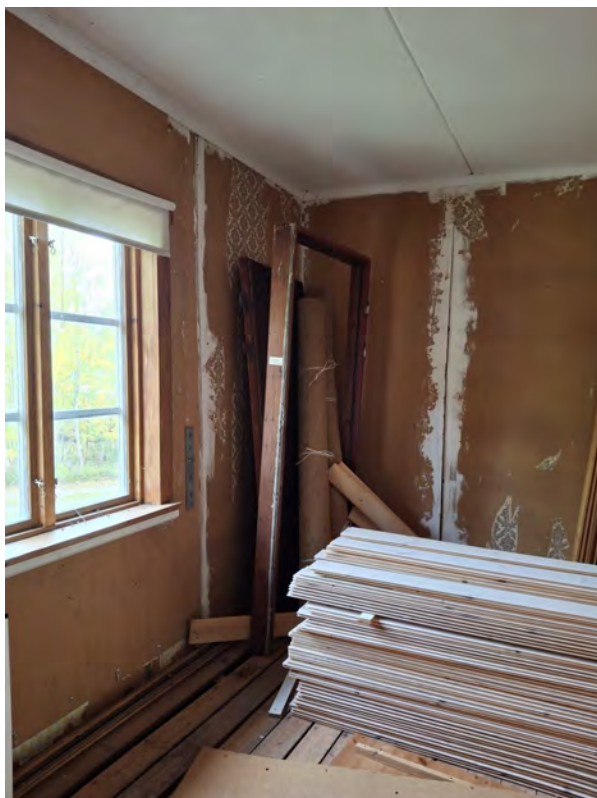
Kammaren innanför köket