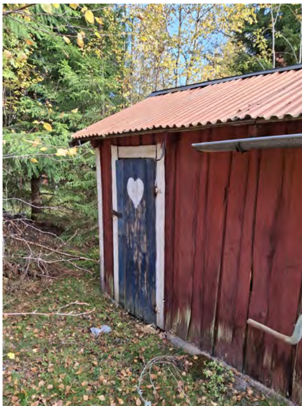
Hemlighuset i änden av boden