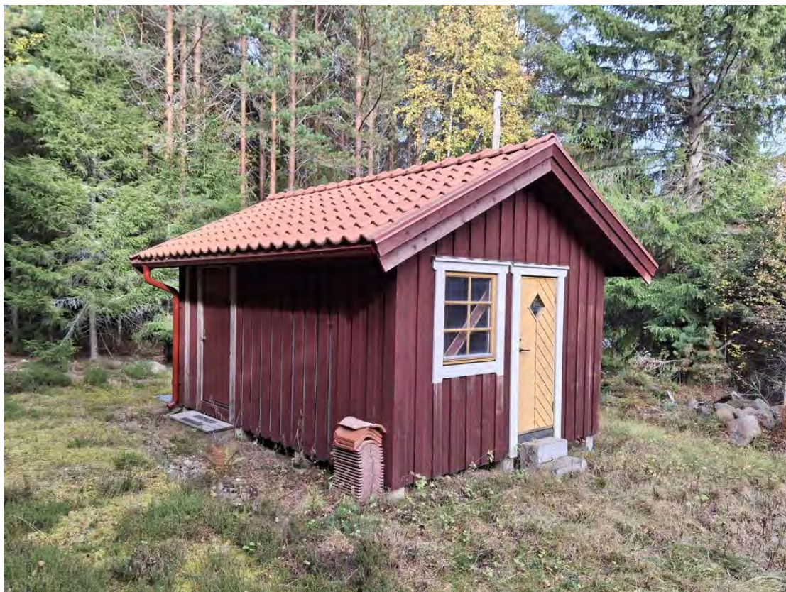
Lillstuga/förråd med 2 rum