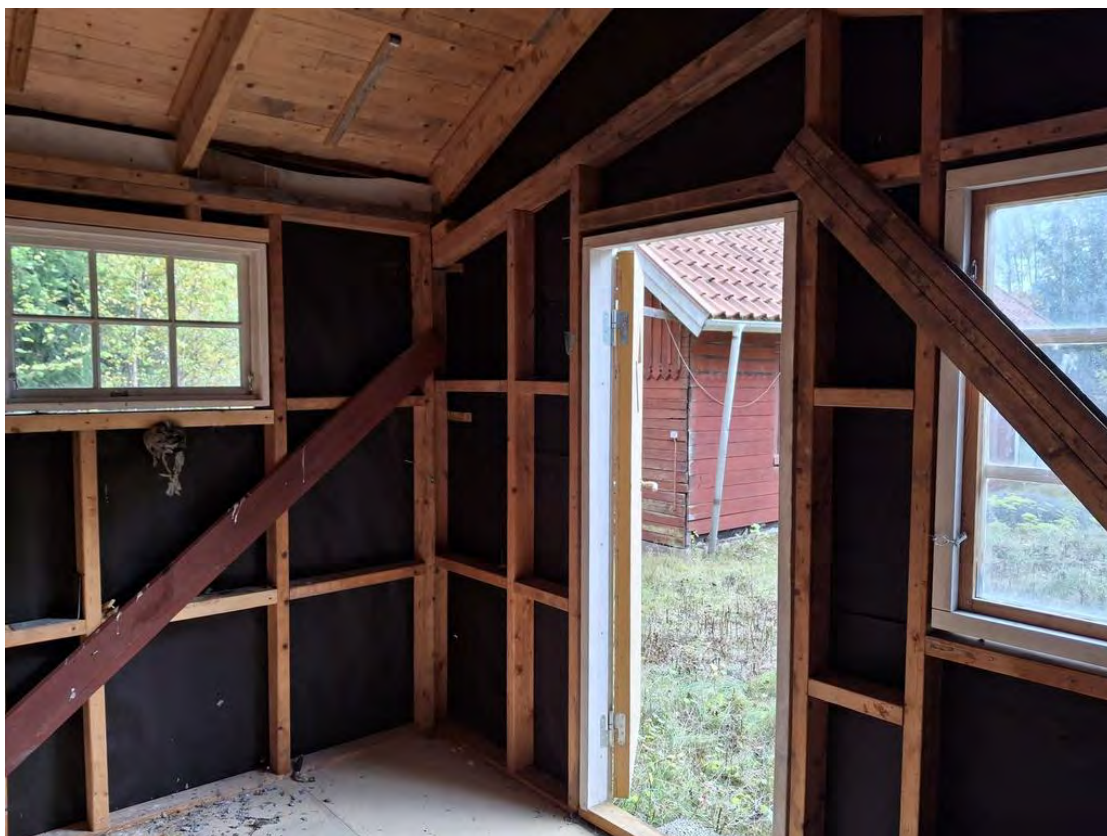
Rum i lillstugan