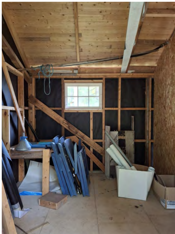
Bakre rummet i lillstugan