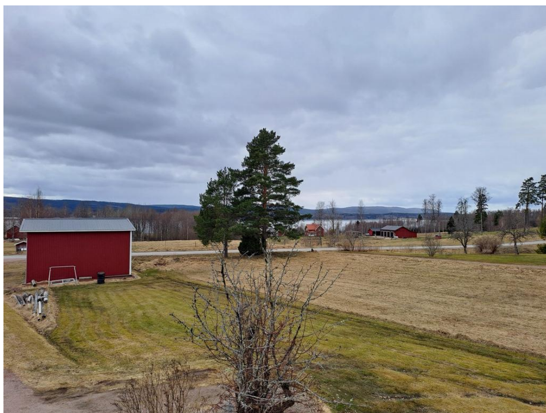
Utsikt från hallen på övervåningen