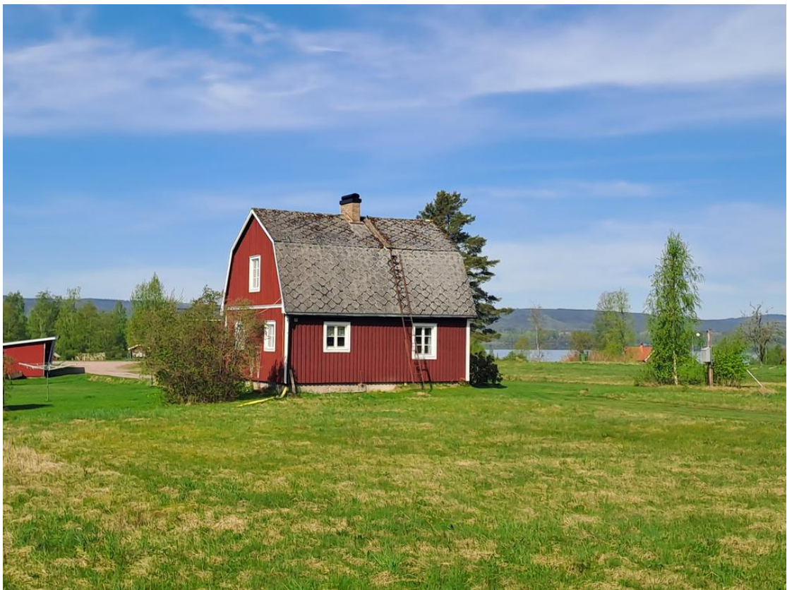
Utsikt mot sjön