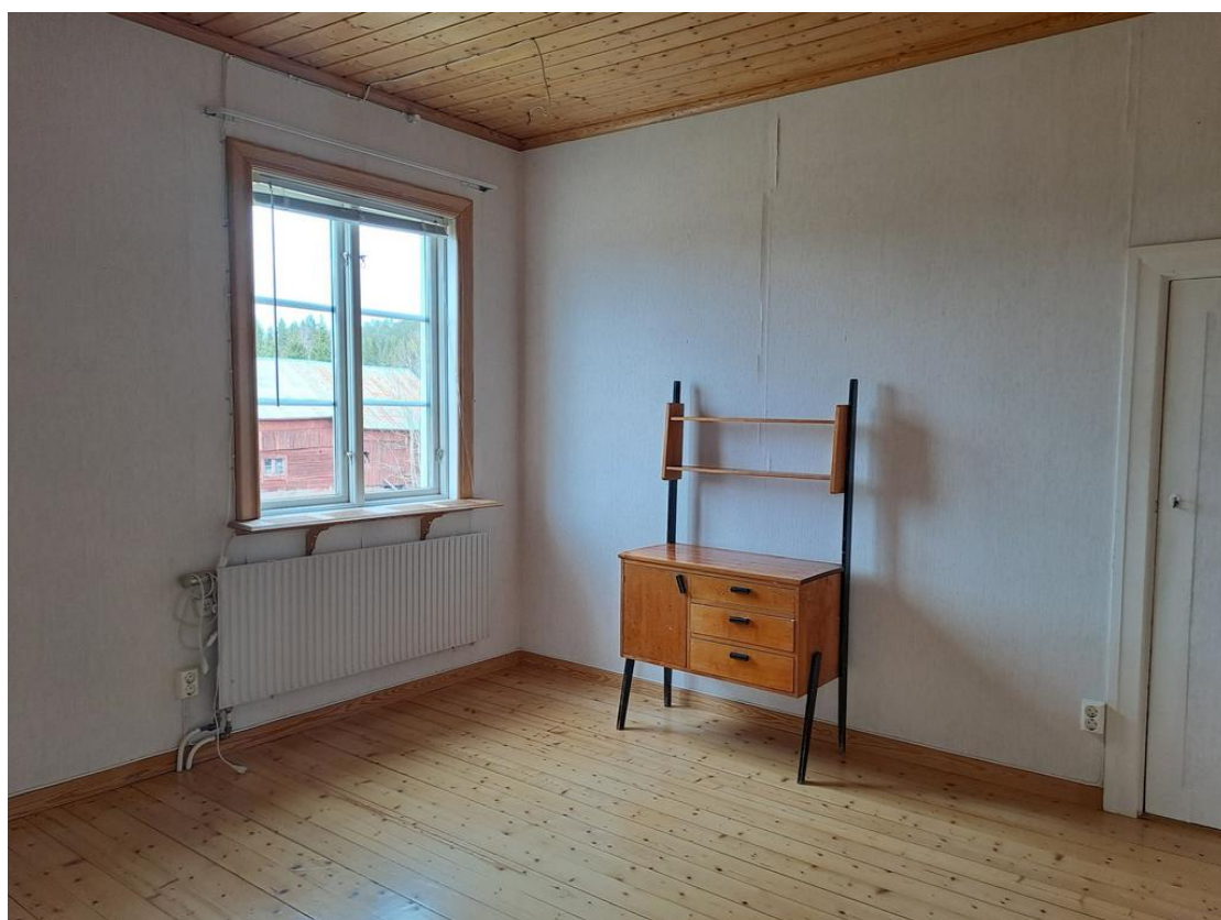
Sovrummet till vänster med kallgarderob