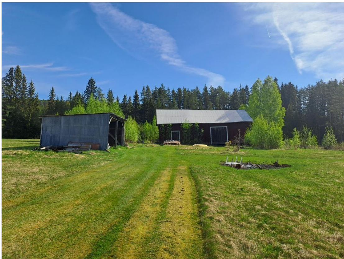
De äldre ekonomibygnaderna mot skogskanten