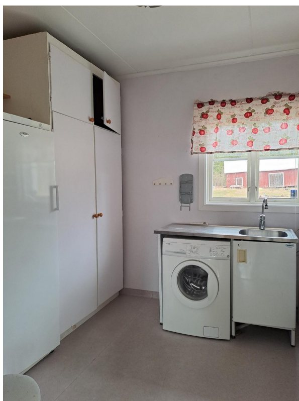
Tvättstugan med gott om plats