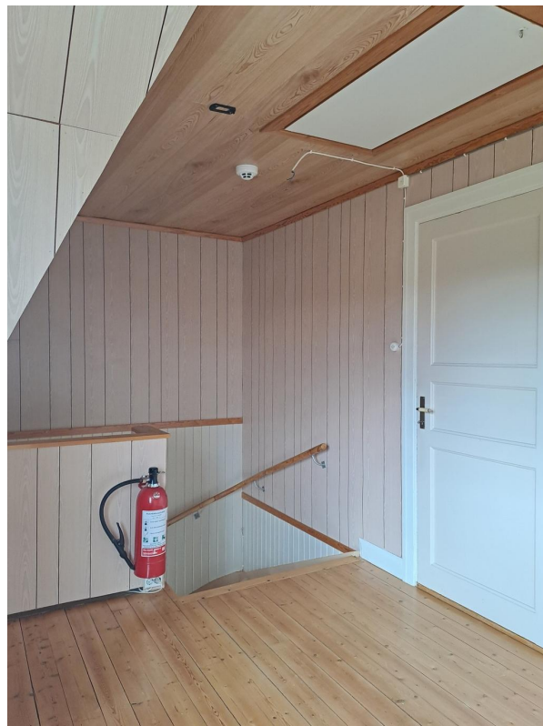
Inspektionslucka till vinden