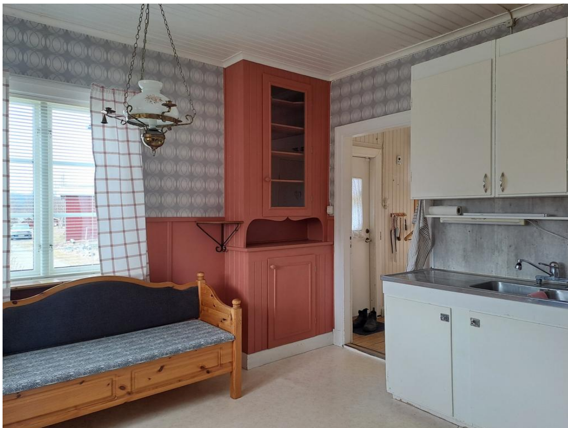
Köket mot hallen, observera det underbara skåpet.