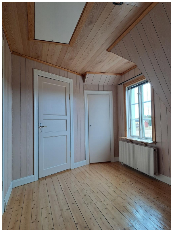
Hallen på övervåningen, till vänster sovrum, rakt fram sovrummet med kamin, till höger en kallbarderob