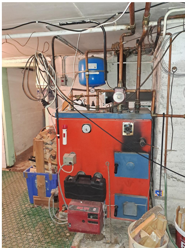
Gamla pannan, oljetanken finns kvar men är tömd