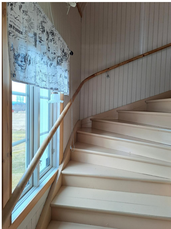
Mot övervåningen med den målade trappen