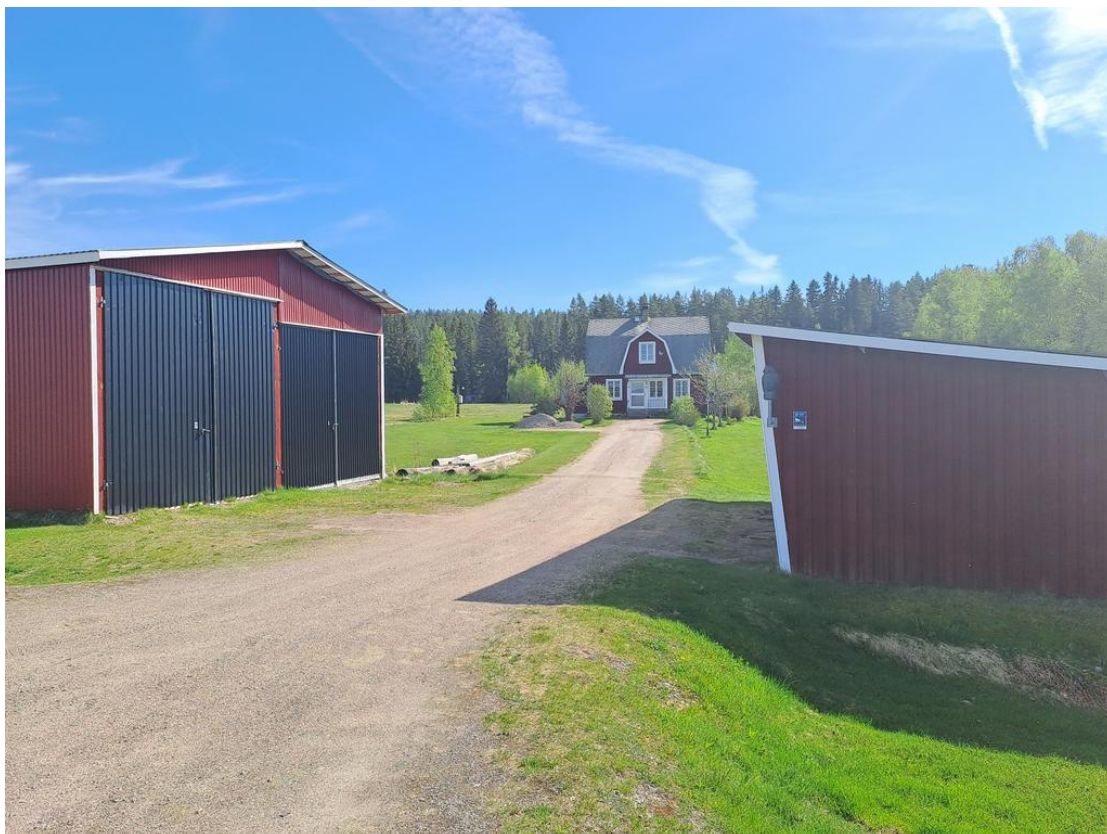
Infarten med garagen