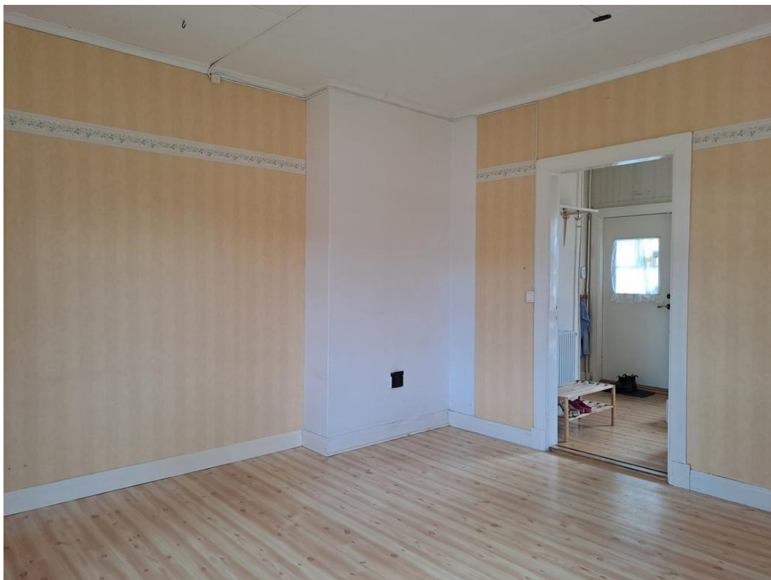
Vardagsrummet mot hallen