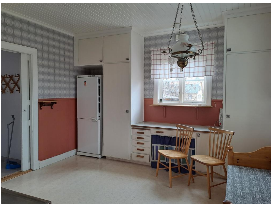
Köket med tvättstugan till vänster