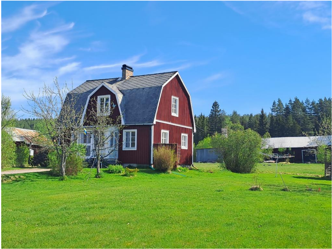
Välkommen till Buda Gärdet