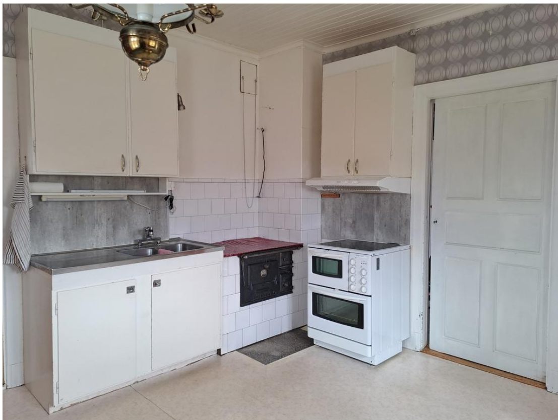
Bra att vedspis när vinterkylan kommer. Tvättstugan till höger, vidare till badrummet