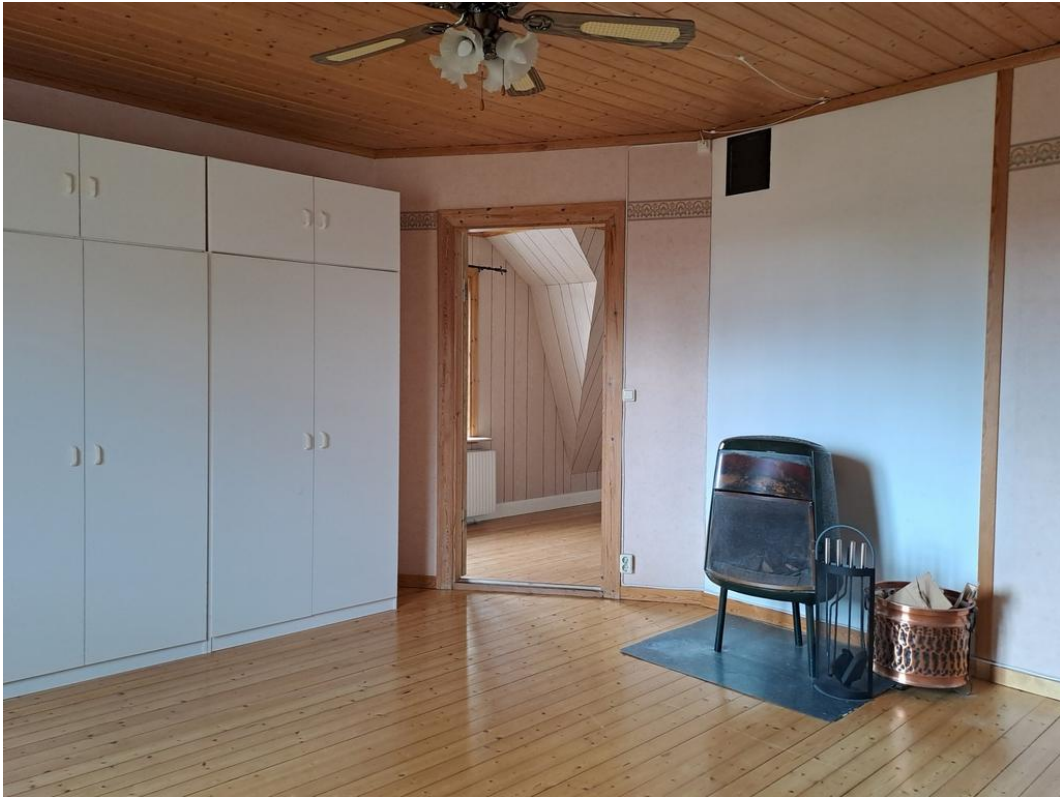
Sovrummet rakt fram med kamin och många garderober