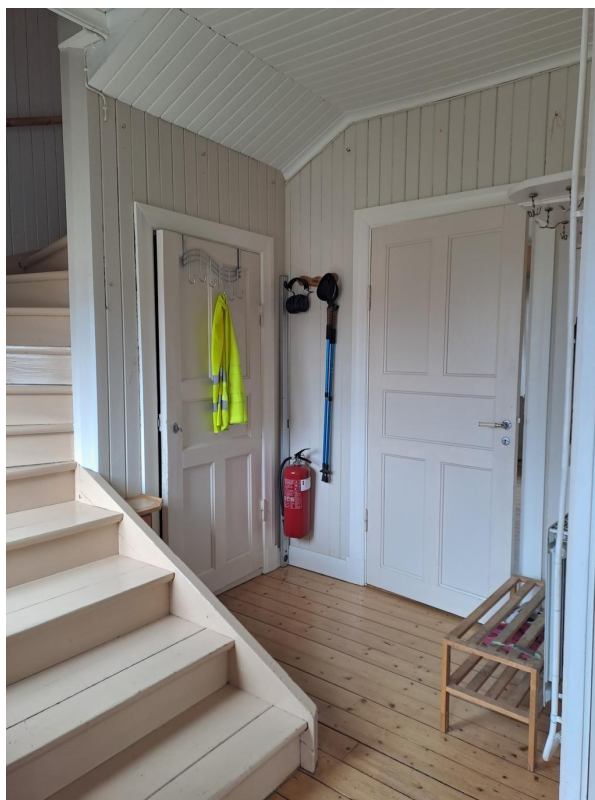
Hallen, rakt fram är källartrappen, till höger vardagsrummet. Liten WC utanför bild till höger.