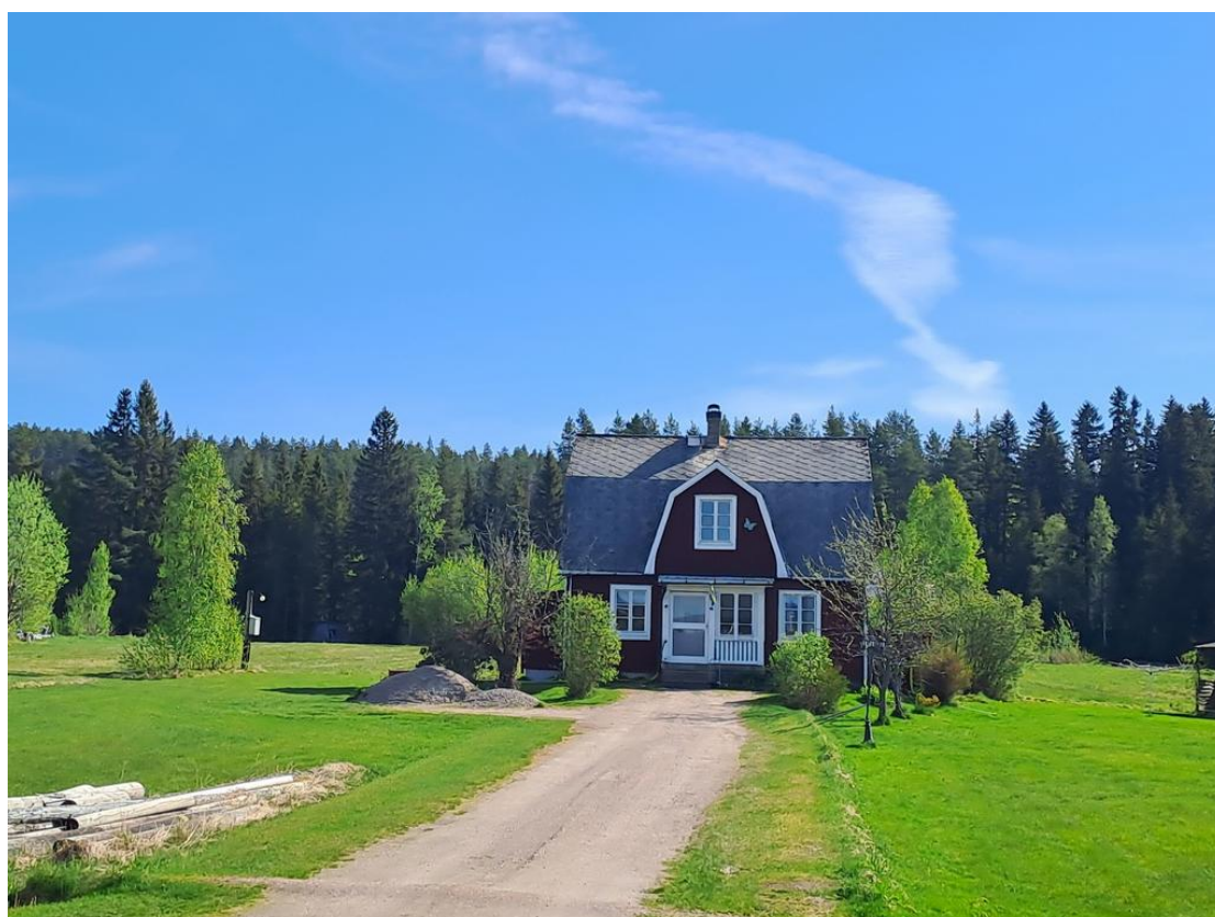
En typisk svensk idyll