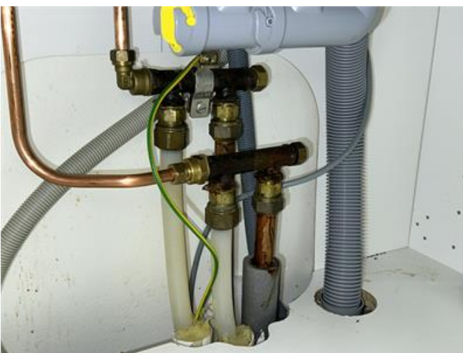
VVS: Korrosion på fördelningsrör och kopplingar, kontakta fackman för översyn.