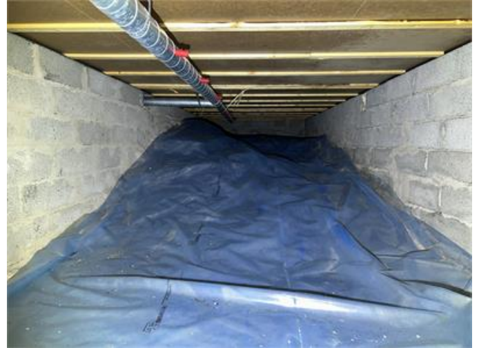
Krypgrund: Översiktsbild 2.