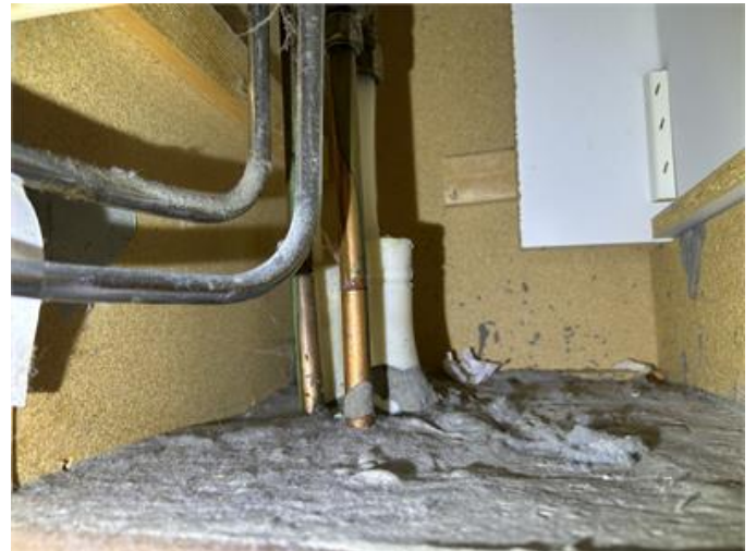
VVS: Vatteninstallationer följer en äldre standard.