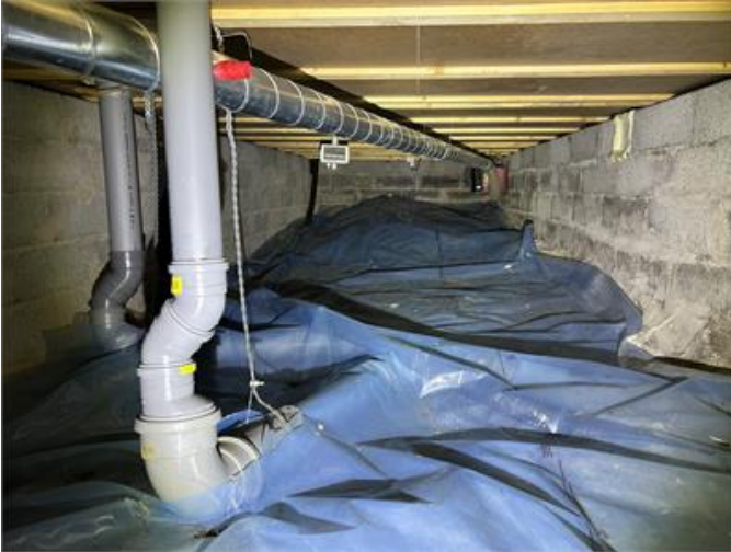
Krypgrund: Översiktsbild 1.