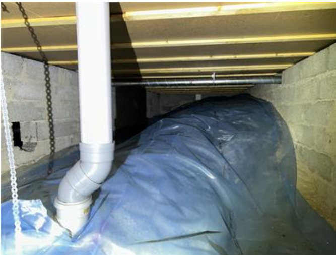
Krypgrund: Översiktsbild 3.