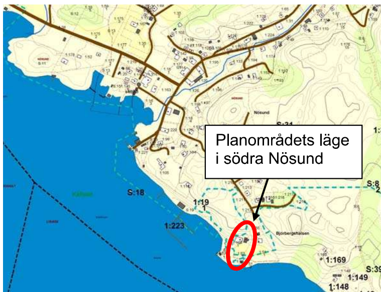
Utsnitt ur kommunens fastighetskarta