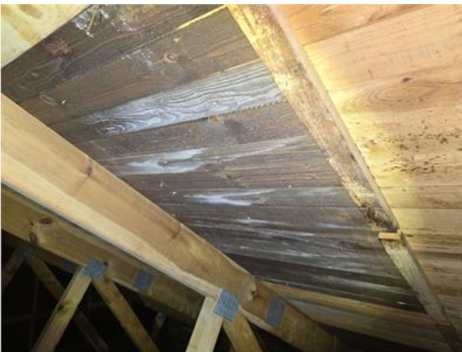
Nockvind: Enstaka fack med mikrobiell påväxt.