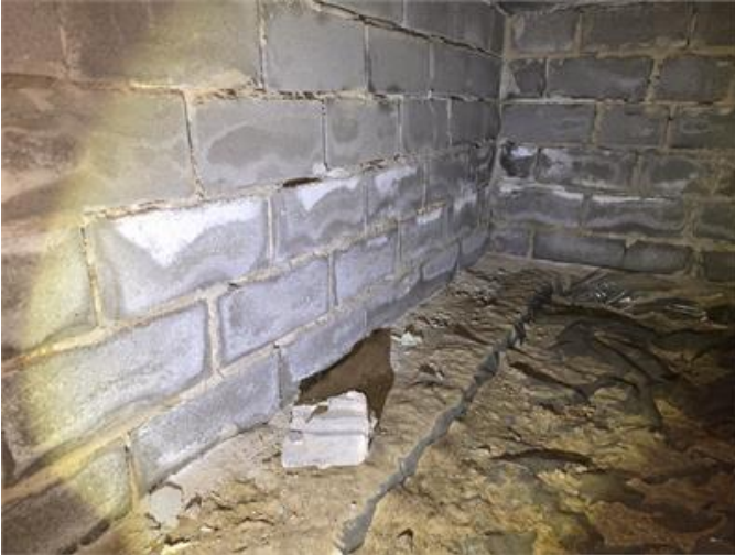
Krypgrund: Mineralutfällningar noteras på grundmurar.