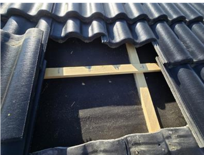
Tak: Stickprovskontroll under pannor utan anmärkning.