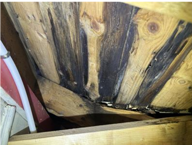
Nockvind ovan entrehall: Rötskador förekommer vid ränndal. Torrt vid besiktning.