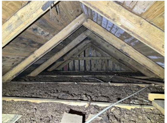
Nockvind: Översiktsbild med synlig mikrobiell påväxt på underlagstaket.