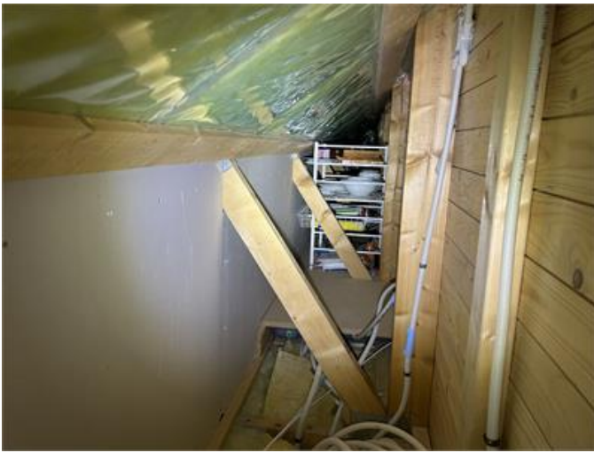
Garage sidovind norr: Översiktsbild.