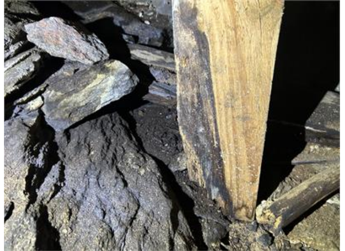
Torpargrund: Rötskador förekommer i stolpar.