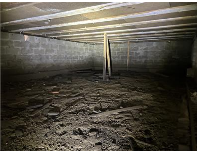
Krypgrund: Översiktsbild 3.