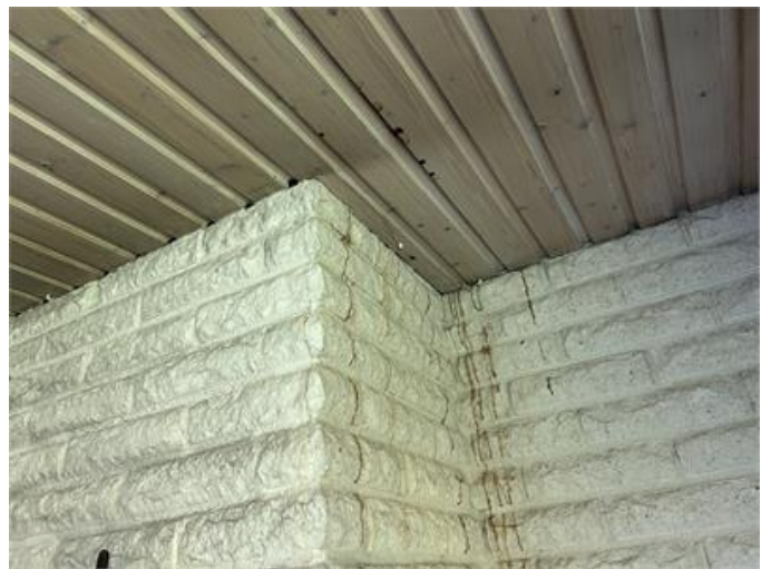
Vardagsrum: Fuktanvisningar vid bla. murstocken noteras