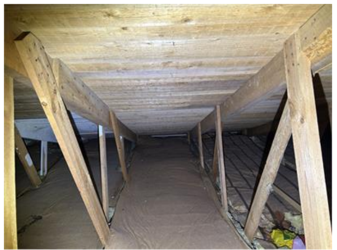
Nockvind: Mikrobiell påväxt förekommer. Målat undertak förekommer efter en rökutveckling som hänt.