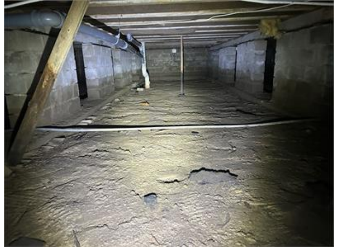
Krypgrund: Översiktsbild 1.