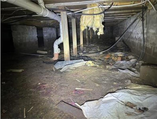
Krypgrund: Översiktsbild 1.