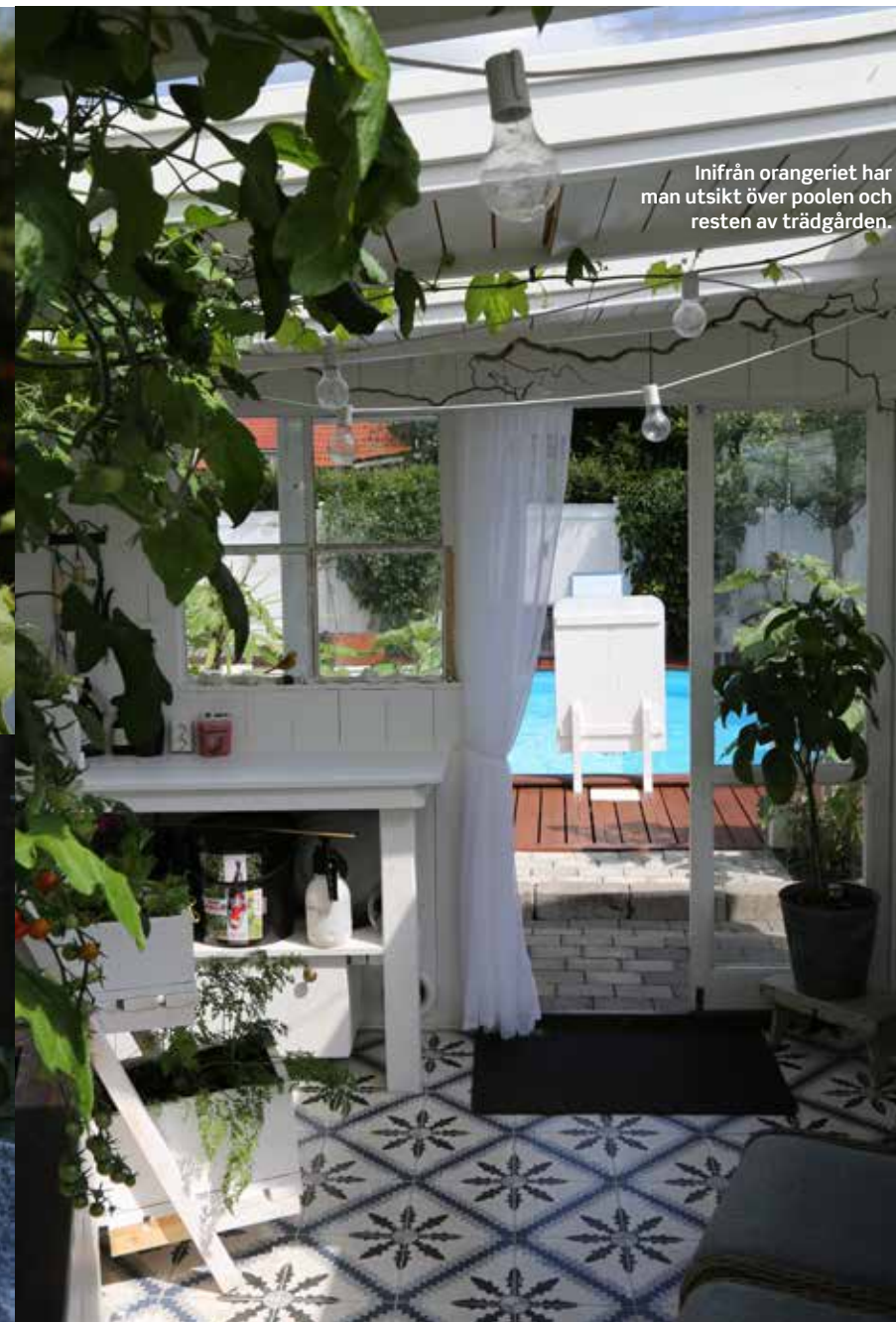
Inifrån orangeriet har man utsikt över poolen och resten av trädgården.