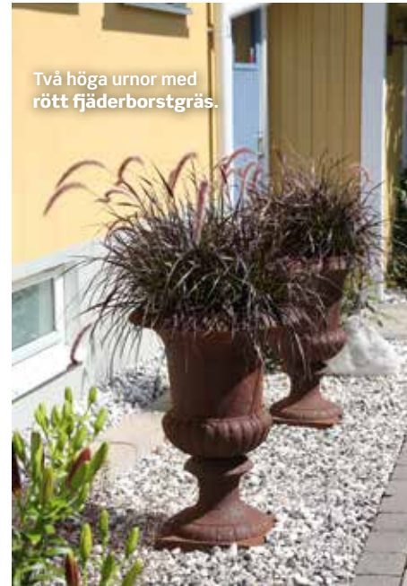
Två höga urnor med rött fjäderborstgräs.