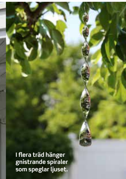
I flera träd hänger gnistrande spiraler som speglar ljuset.