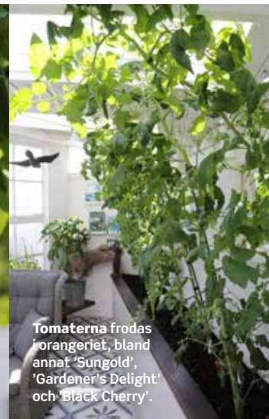
Tomaterna frodas i orangeriet, bland annat 'Sungold', 'Gardener's Delight' och 'Black Cherry'.