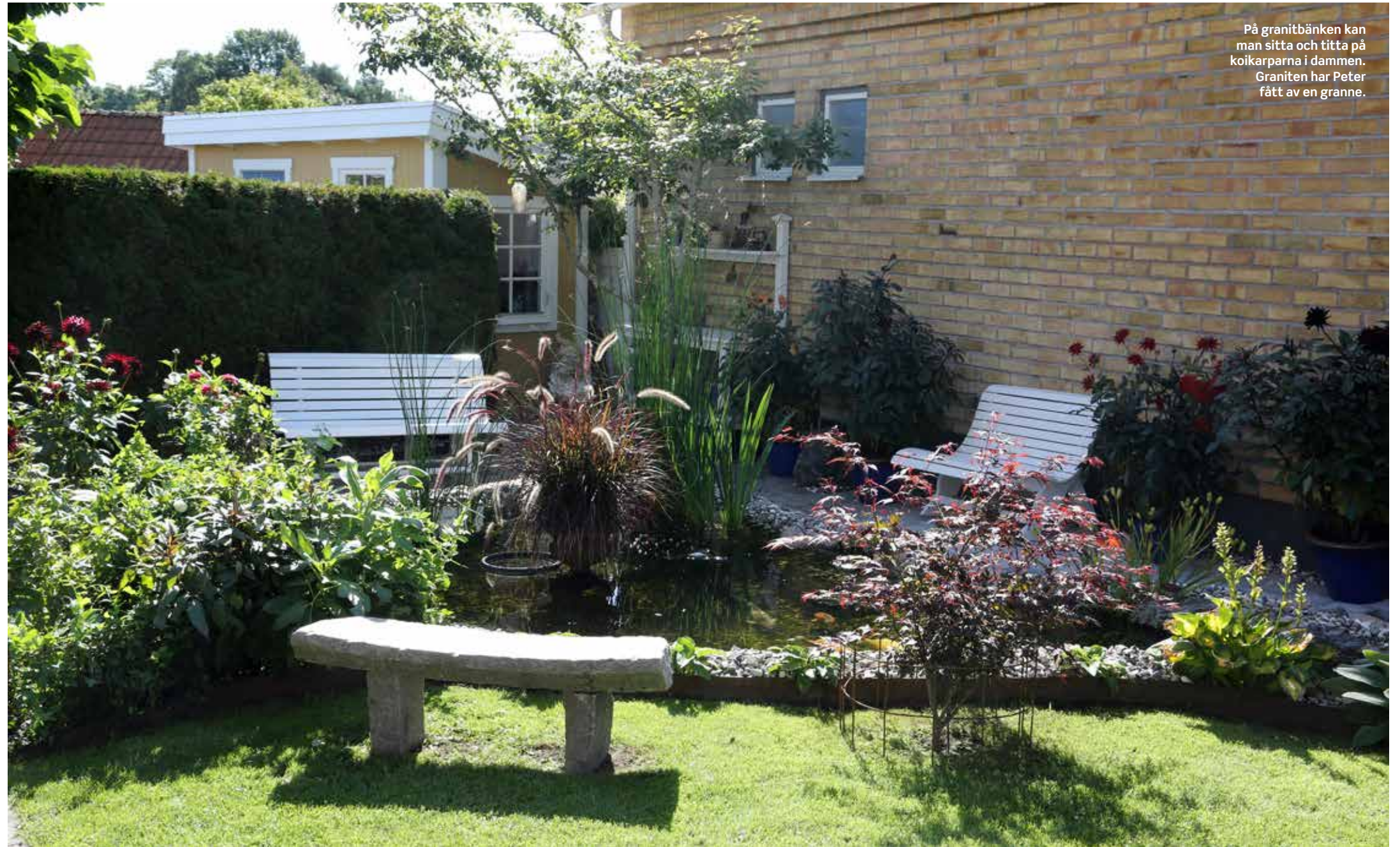
På granitbänken kan man sitta och titta på koikarporna i dammen. Graniten har Peter fått av en granne.

T omten är inte stor, men trots den begränsade ytan mellan husen ryms här flera uteplatser, ett orangeri, en pool med ett stort trädäck runt om och två dammar som har koikarpar och är förbundna genom en porlande bäck. Den lilla ytan är maximalt utnyttjad, men känns ändå öppen och luftig.