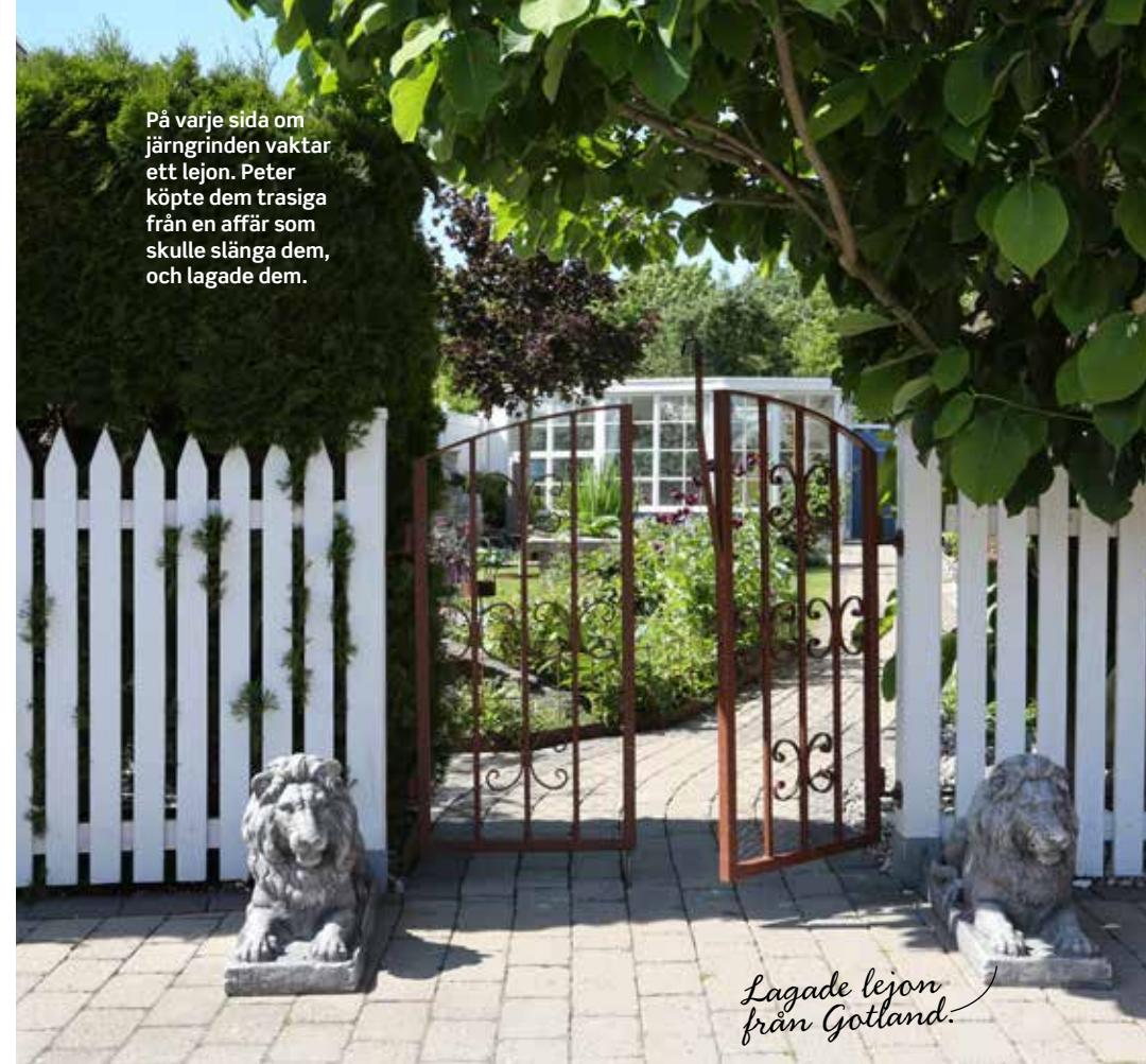
På varje sida om järngrinden vaktar ett lejon. Peter köpte dem trasiga från en affär som skulle slänga dem, och lagade dem.