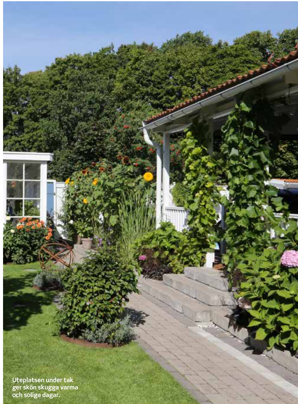
Uteplatsen under tak ger skön skugga varma och soliga dagar.