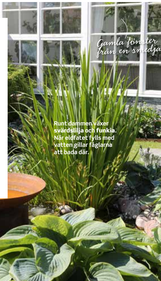
Gamla fönster från en smedja.