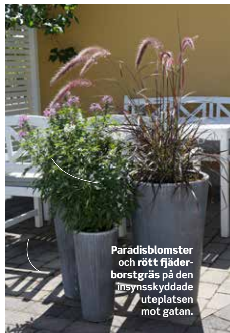
Paradisblomster och rött fjäderborstgräs på den insynsskyddade uteplatsen mot gatan.