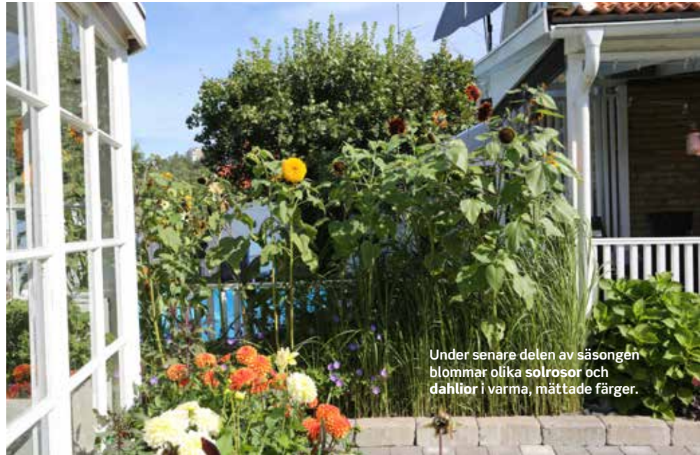
Under senare delen av säsongen blommar olika solrosor och dahlior i varma, mättade färger.