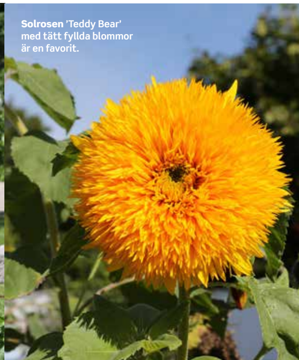
Solrosen 'Teddy Bear' med tätt fyllda blommor är en favorit.