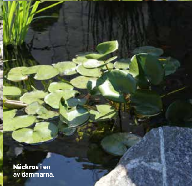
Näckros i en av dammarna.