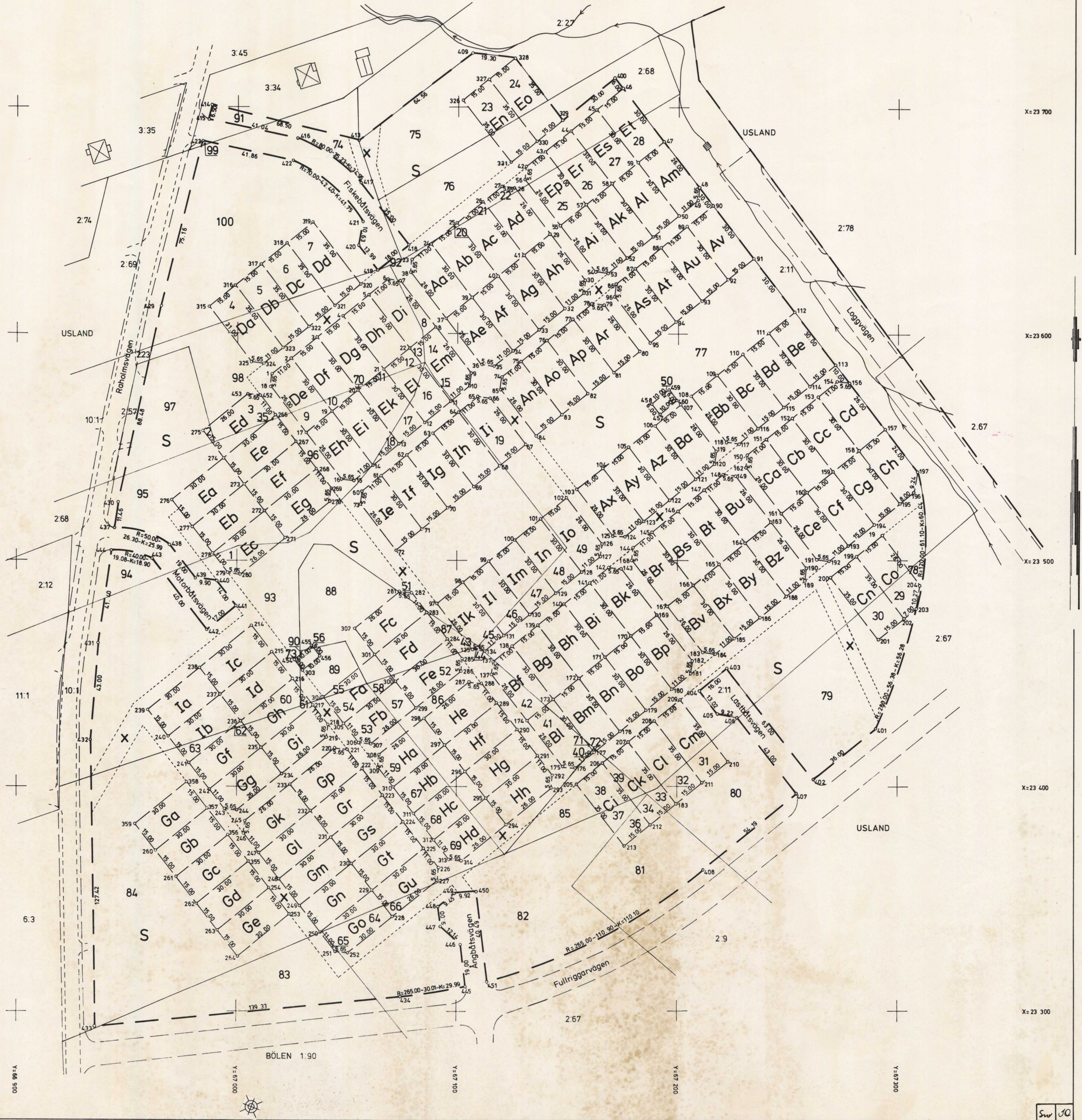
Fig 1-3, 11-18, 23-28, 35-R nr Usland 2:68 " 4-10, 70 = " " 2:76 " 20-22, 29-34, 36-42, 71, 72 " " 2:78 " 56, 73 = " " 4:17 " 50-55, 57, 58 = " " 4:86 " 60-62, 64-66 = " " 6:3 " 69, 67-69 = " " 6:4 " 19, 43-49, 63 = " " 10:1 " 74-100 = " " 5:3