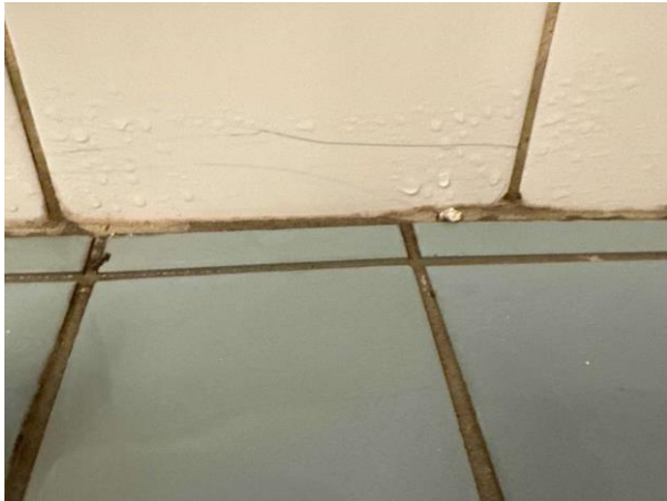
Bild 13: Invändigt, Övervåning, Badrum, Äldre våtrum Sprickor i kakelplattor på vägg