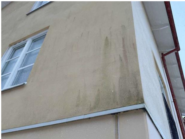
Bild 3: Utvändigt, Fasad, Enstegstätad fasad se riskanalysen Missfärgningar noterades lokalt på putsen