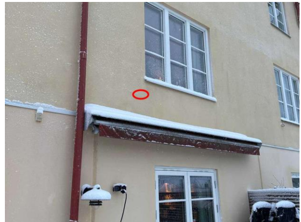
Bild 4: Utvändigt, Fasad, Enstegstätad fasad se riskanalysen. Två små hål noterades på baksidan av fasaden