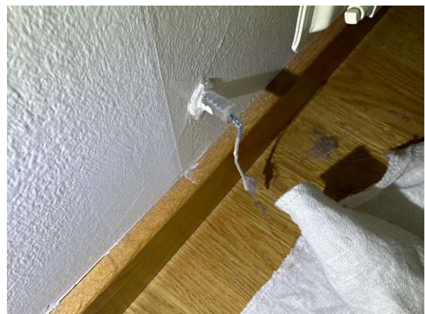
Bild 12: Invändigt, Övervåning, Sovrum 2, 2013 installerades sk wallindicators i rummen, när kontrolltråden/indikatorn blir blåfärgad indikerar den på fukt. I sovrums på övre plan ind...