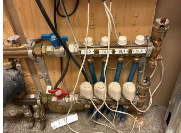
Bild 8: Invändigt, Källarplan, Tvättstuga, Tätskikt saknas i inbyggnad för golvvärme...