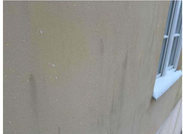
Bild 2: Utvändigt, Fasad, Enstegstätad fasad se riskanalysen Missfärgningar noterades lokalt på putsen