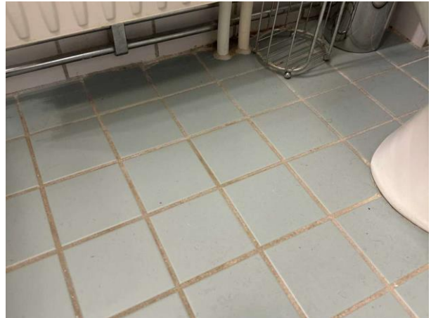
Bild 14: Invändigt, Övervåning, Badrum, Det förekommer rörgenomföringar i golv annat än för avlopp