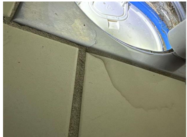
Bild 6: Invändigt, Källarplan, Tvättstuga, Det förekommer rörgenomföringar i golv annat än för avlopp Det saknas brunnsduk mellan golvbrunnen och klämringen