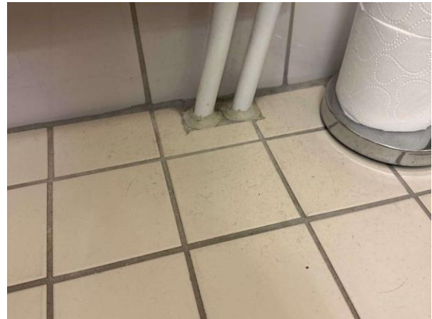
Bild 10: Invändigt, Entréplan, Duschrum, Äldre våtrum. Det förekommer rörgenomföringar i golv annat än för avlopp.