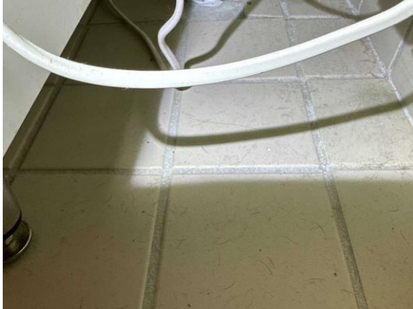
Bild 7: Invändigt, Källarplan, Tvättstuga, Det förekommer rörgenomföringar i golv annat än för avlopp. Det saknas brunnsduk mellan golvbrunnen och klämringen. Tätskikt saknas i inbyggnad...