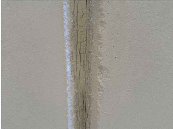
Bild 1: Utvändigt, Grundmur/Hussockel, Sprickor noterades i mjukfogning mellan grundens betongelement