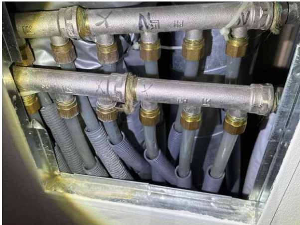
Bild 9: Invändigt, Entréplan, Entréhall, Inbyggnad för golvvärme saknar bakomliggande tätskikt med skvallerrör.