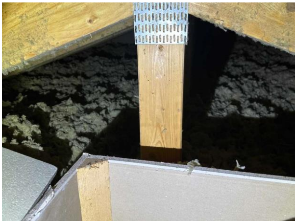
Bild 5: Utvändigt, Vind, Del av vinden är för låg att krypa in i ej besiktad