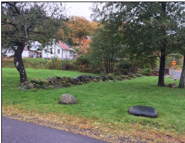
Flertalet stenmurar finns i koloniområdet.

Området ligger i den sydöstra änden av en dalgång i vilken topografin långsamt höjer sig på tre sidor om dalen, främst mot sydöst. De centrala och östra delarna av området saknar berg i dagen. I områdets västra ytterkant höjer sig markytan mjukt mot sydväst och består av naturmark med flacka slänter av mossbeklätt naturligt rösberg, dvs. block och sten som under lång tid fallit ut och lagt sig tillrätta. Bakom dessa skymtar låga hällar och slänter av berg i dagen men rösen och berg i dagen ligger till stor del eller helt och hållet utanför detaljplanområdet. Även i områdets södra delar höjer sig markytan successivt mot sydöst. Berg i dagen i form av hällar, låga slänter och block finns i den sydvästliga spetsen av området. Mellan de sydligaste husen och ängen finns spridda block delvis nedsänkta i marken.