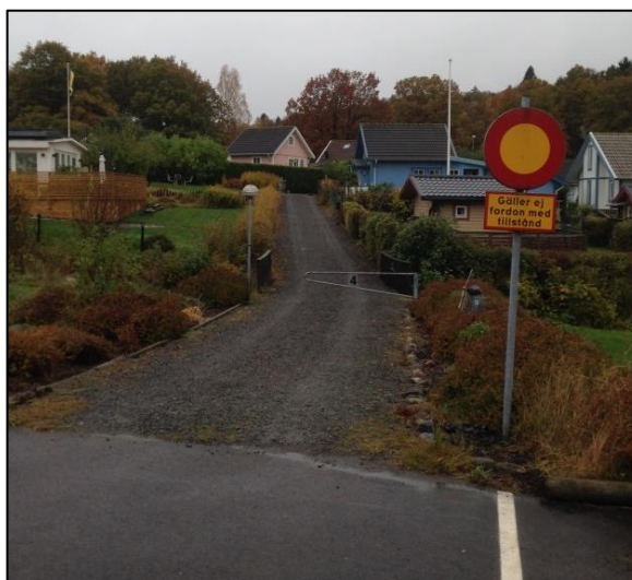
En av fem grusvägar in till området med bom.