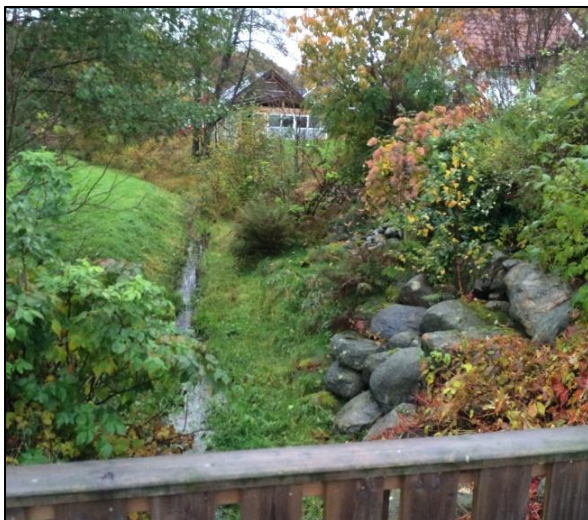
Ävabäcken rinner centralt genom området.