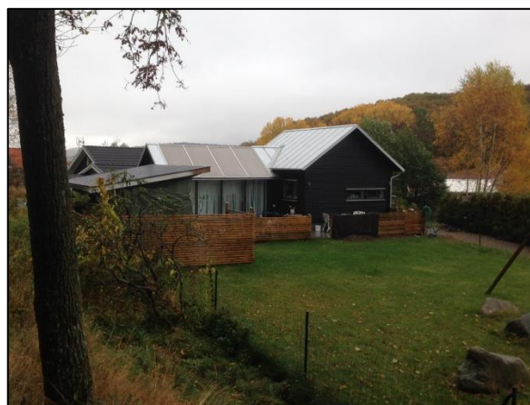
Kolonistuga och drivhus i modern tappning.