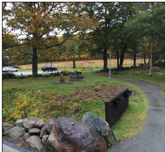
Sydöstra entrén till koloniområdet.