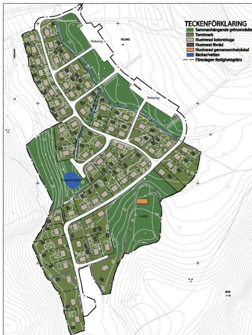
Utklipp från Illustrationskarta över området.

En breddning görs av gatorna i området till 3,5 meter samtidigt som enstaka vändplatser skapas och korsningar ses över för att säkerställa att utryckningsfordon kan ta sig fram i hela området. En breddning av gatorna innebär även att hanteringen av avvattnings från gatorna förbättras. Allmän biltrafik kommer vara förbjuden inne i området.