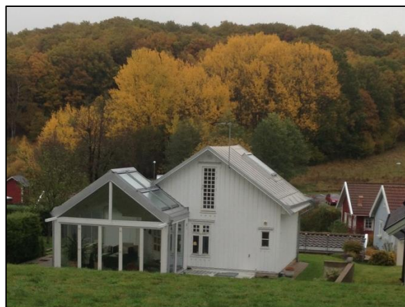
Nyare kolonistuga med glasat drivhus.