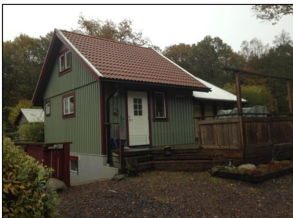
Kolonistuga med källare.