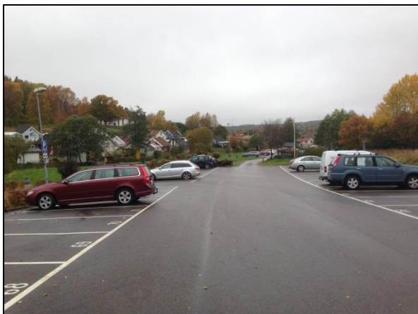
Parkeringsytan öster om kolonilotterna.