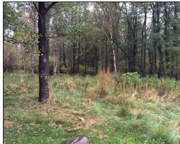
Stora grönområden omgärdar Ekåsen.