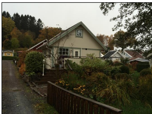
Träfasaderna på bebyggelsen i Ekåsen är genomgående.

Ett av syftena med att upprätta detaljplan över Ekåsens koloniområde är för att bevara karaktären över området vilket innebär att området även fortsättningsvis föreslås vara ett koloniområde.