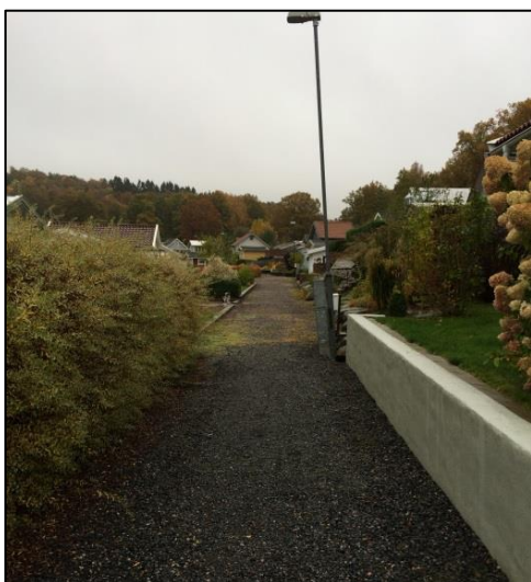
Smal grusväg centralt genom området.

Ekåsens koloniområde nås via Ekåsvägen (som delvis saknar gång- och cykelbana) med infart till området i den norra delen. I direkt anslutning till infarten till området finns ett större område för parkering med 84 parkeringsplatser. In till koloniområdet finns det fem smala grusvägar där fordonstrafik endast är tillåten för fordon med tillstånd.