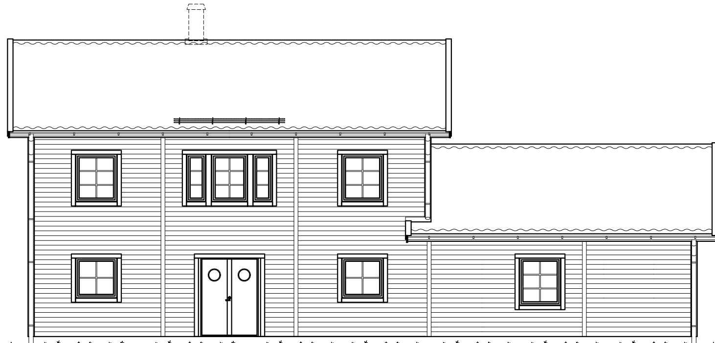
FASAD MOT ENTRÉ