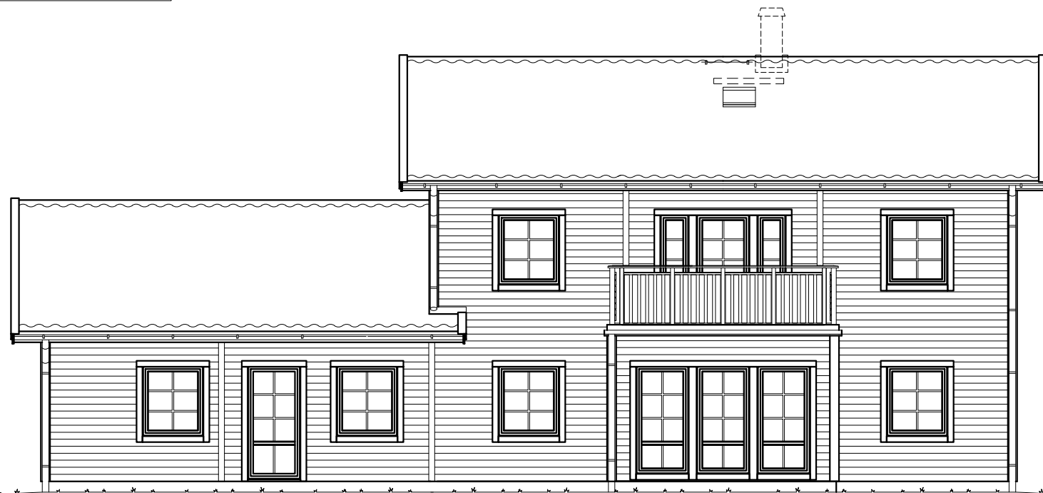
FASAD MOT BAKSIDA