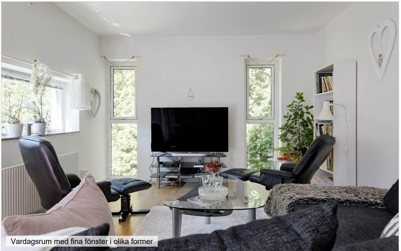
Vardagsrum med fina fönster i olika former