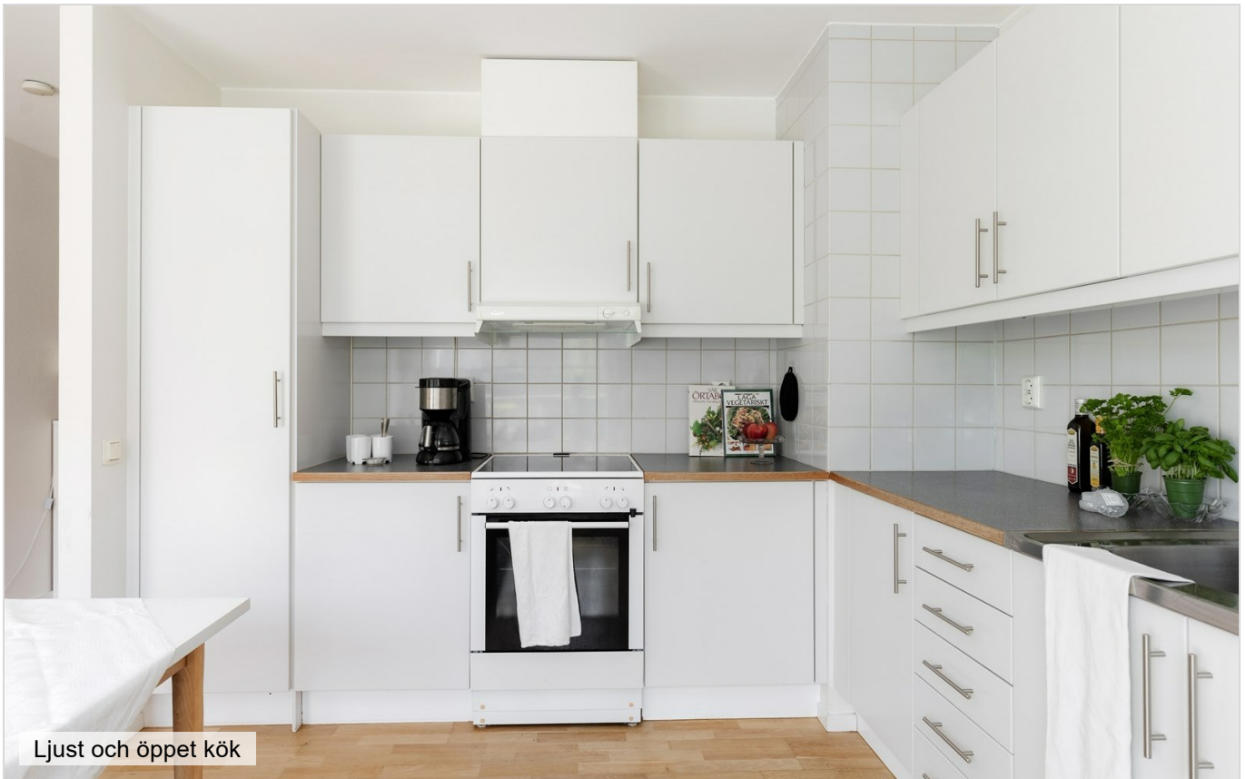
Ljust och öppet kök