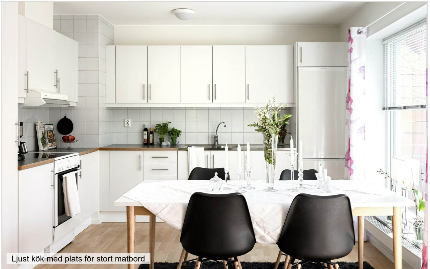
Ljust kök med plats för stort matbord