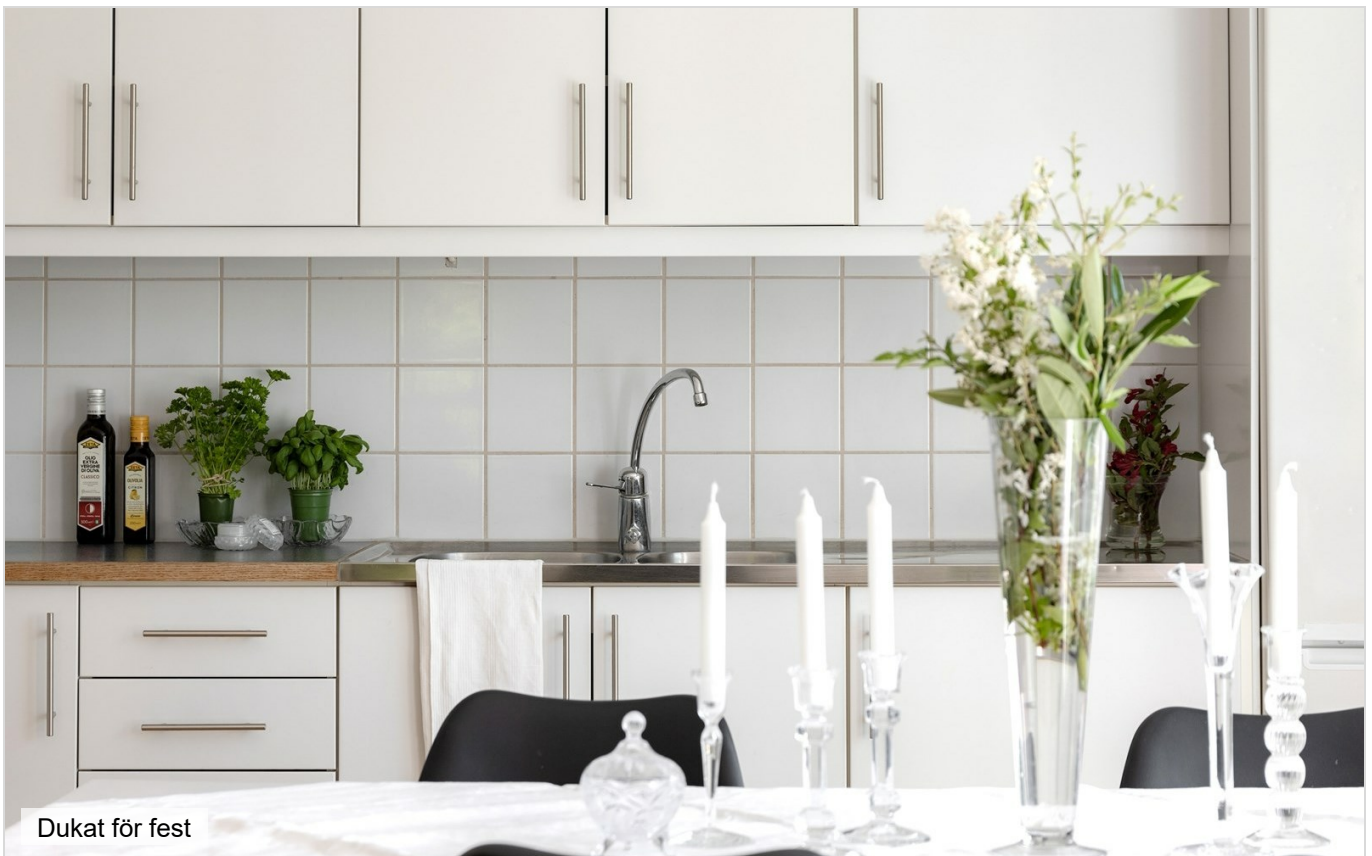
Dukat för fest