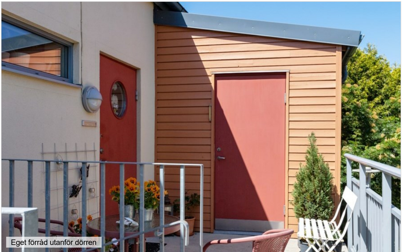
Eget förråd utanför dörren