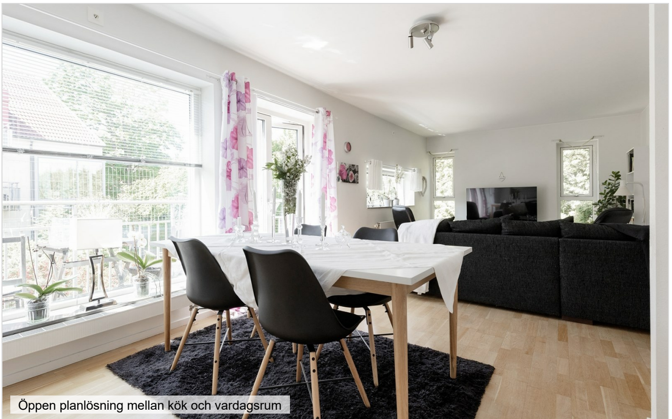
Öppen planlösning mellan kök och vardagsrum