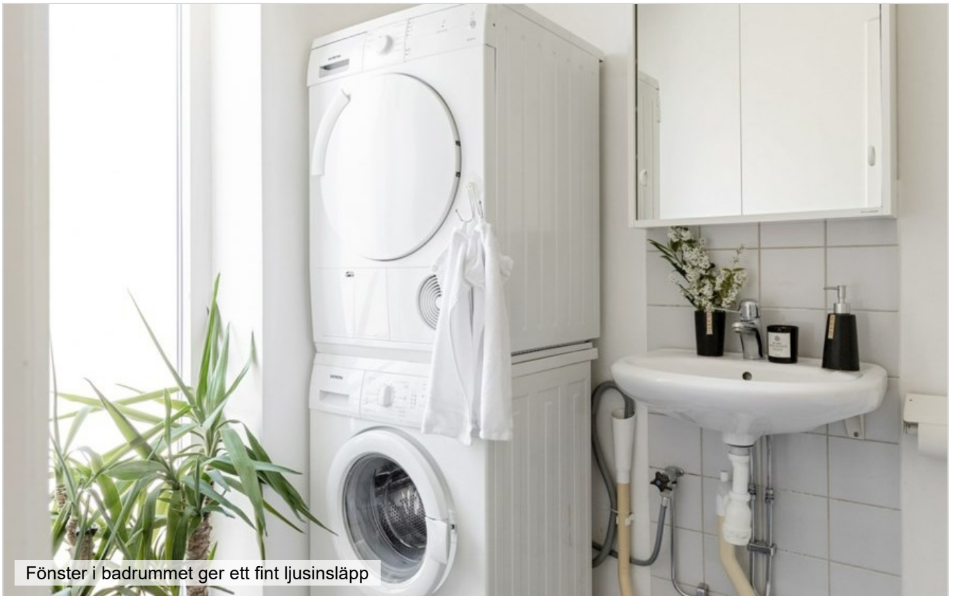
Fönster i badrummet ger ett fint ljusinsläpp