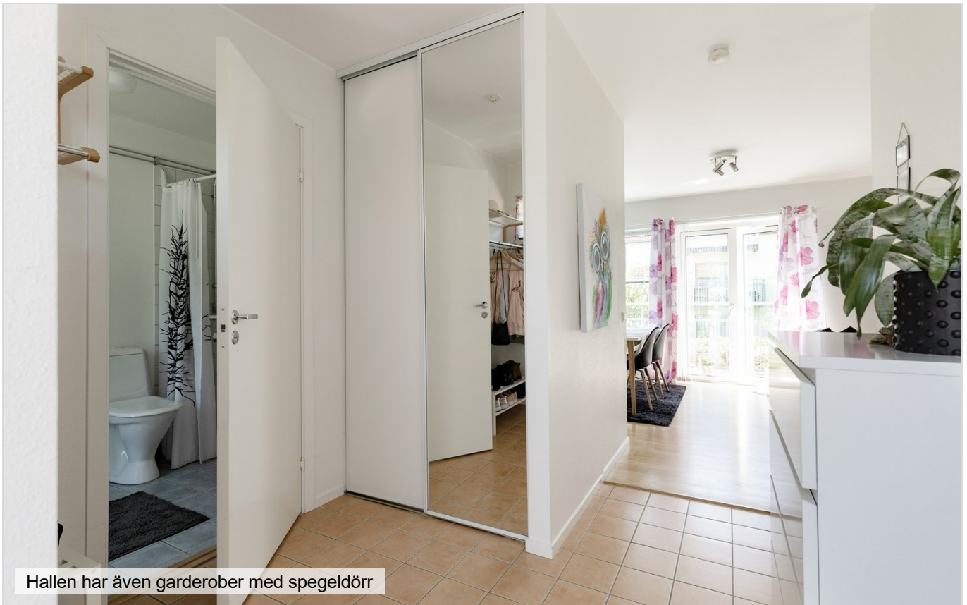
Hallen har även garderober med spegeldörr