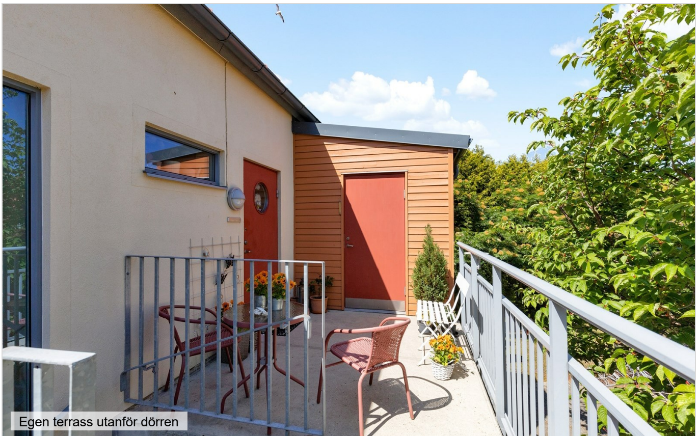
Egen terrass utanför dörren