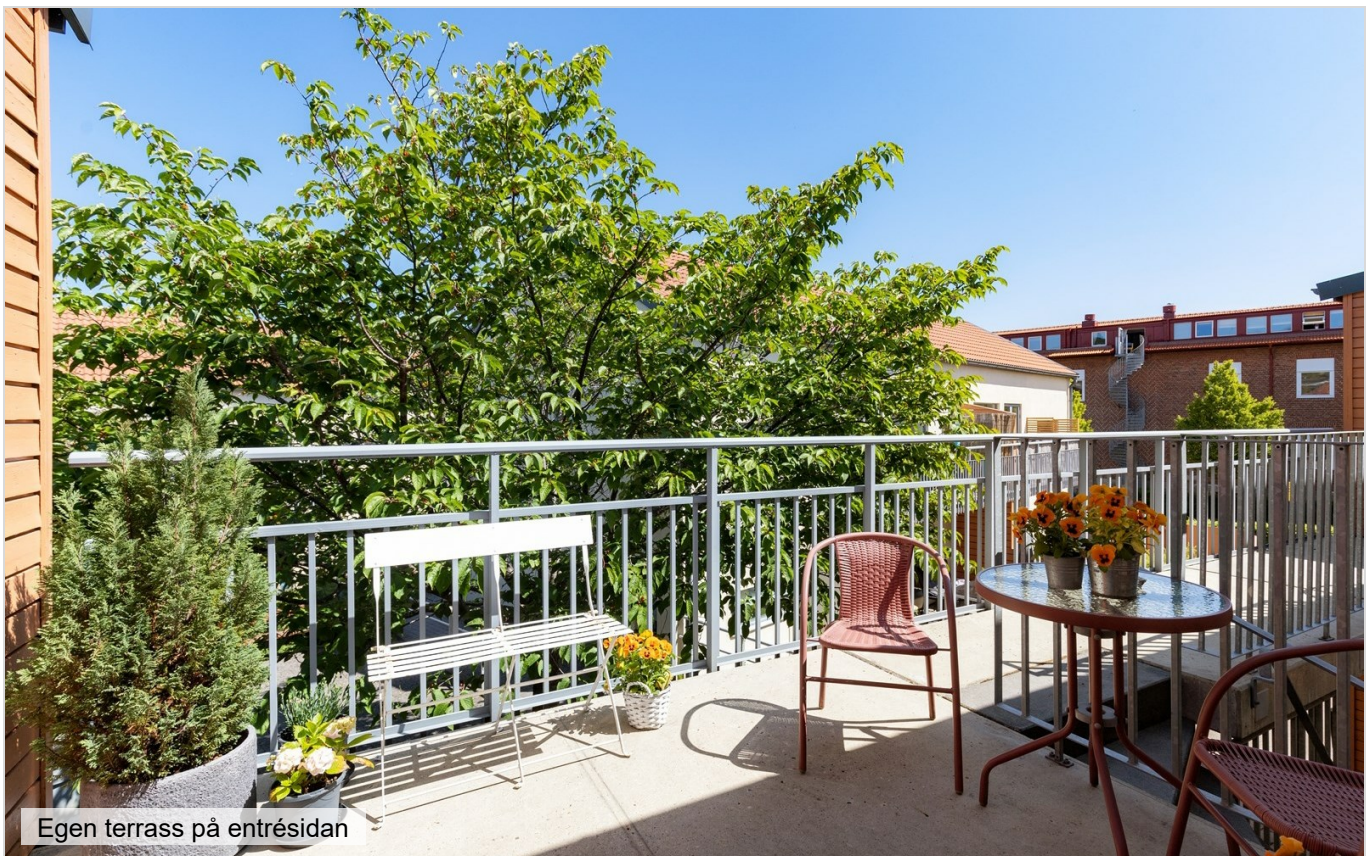
Egen terrass på entrésidan