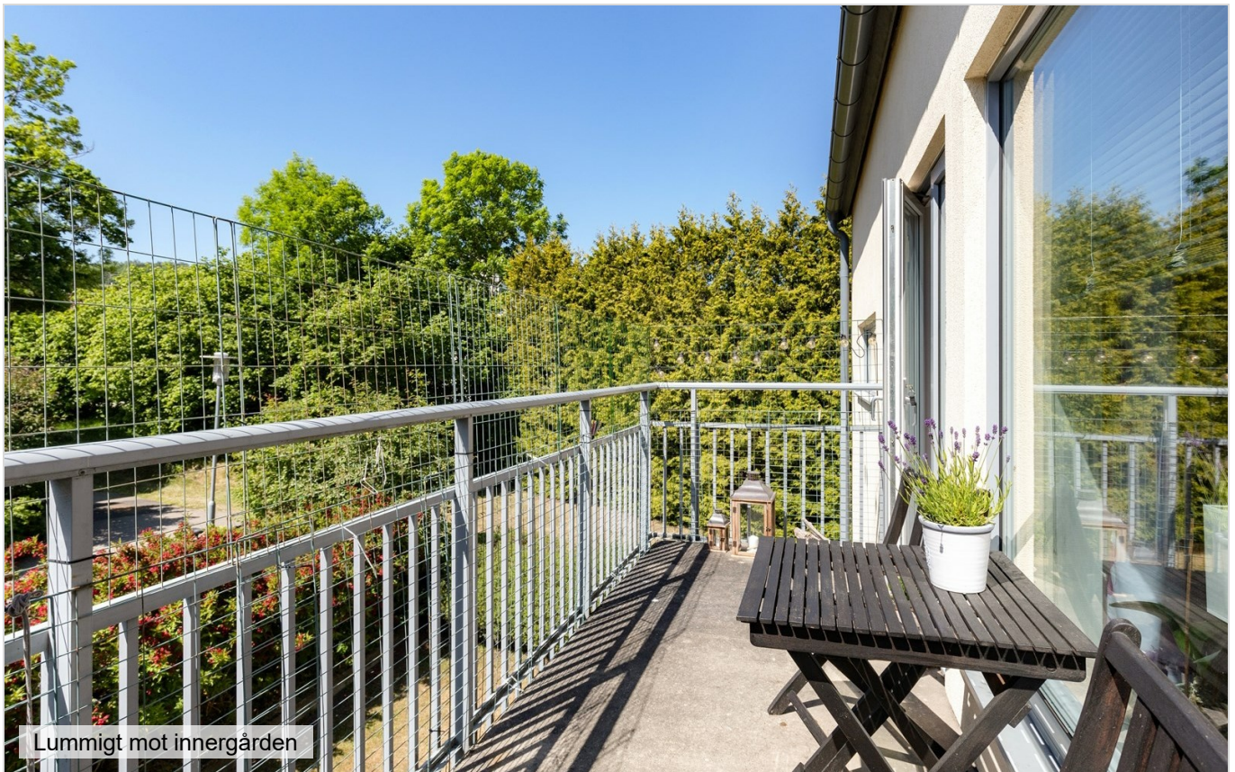
Lummigt mot innergården