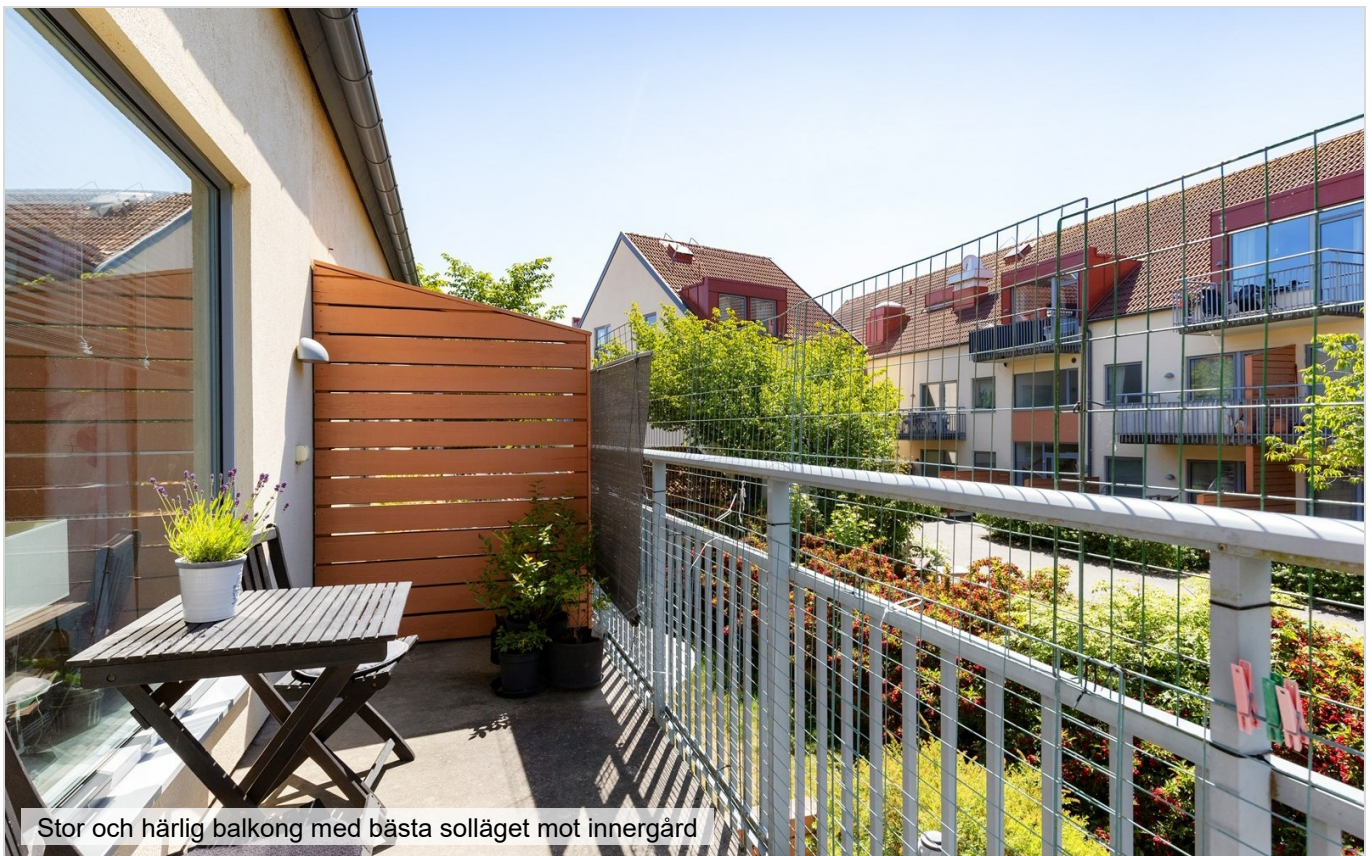
Stor och härlig balkong med bästa solläget mot innergård