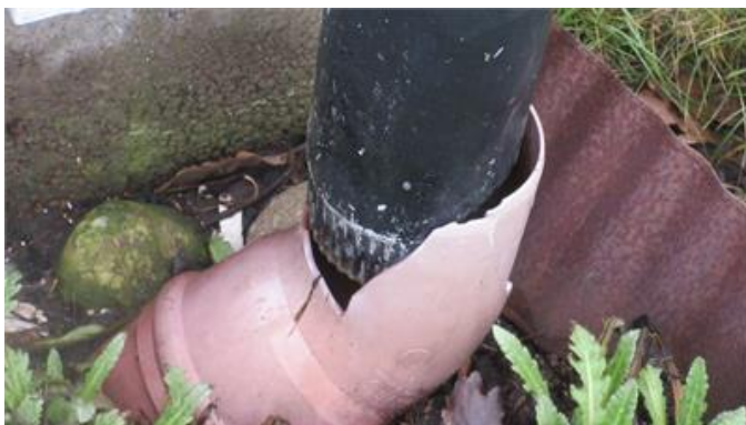
Bristfälligt anslutet stuprör.