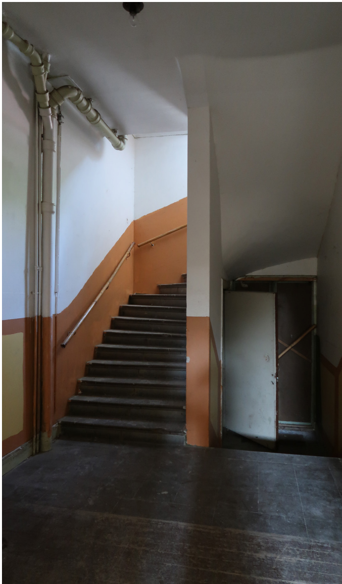
Trapphus i huskroppens mitt. Handledare i original.

Golvsocklar, dörr och foder sedan byggåret. Kalkstengolv och brädgolv. Bevarad handledare. Trappfönster med spröjs.