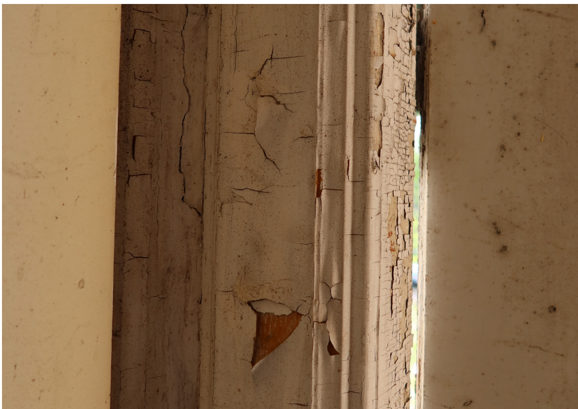
Dörrfoder med utpräglad profilering.