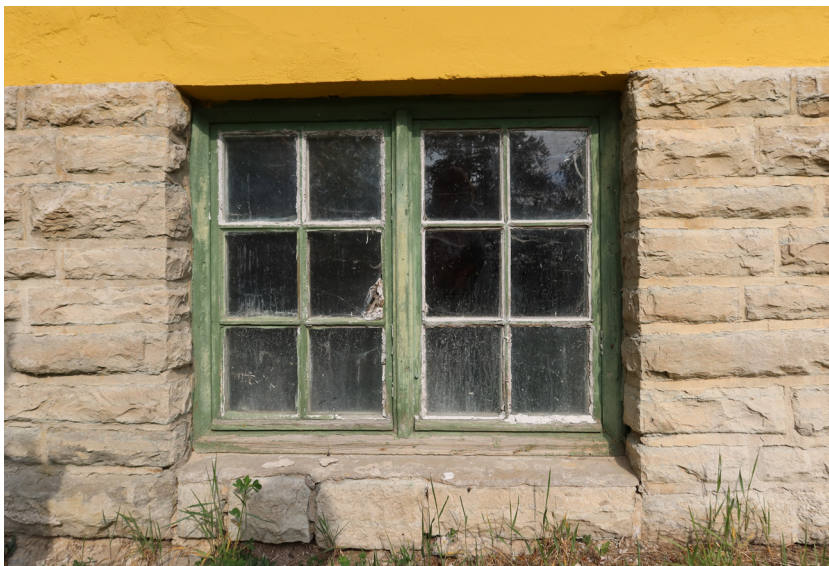
Fönster i grunden på södra fasaden.

Murad hög sockel av grovt huggen kalksten i löpskift med enstaka koppsten med släta fogar av KC-bruk. Fogarna har på ett flertal ställen senare förstärkts med betongbruk. Murstenen skiljer sig åt i storlek i de olika skiften på ett flertal ställen. I grunden finns ursprungliga enkelfönster samt ett mindre antal senare enkelfönster med båge utan spröjs.