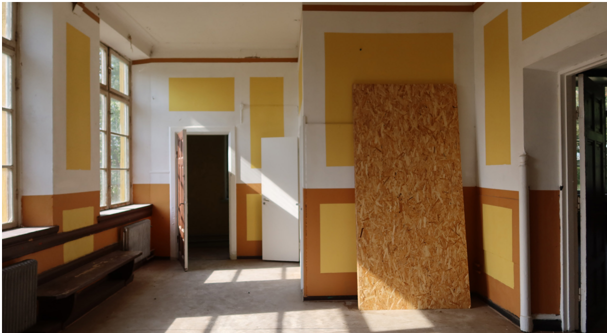
Kapprum innanför entrén.

På hallens västra vägg leder en smalare dörr in till ett smalt förrådsutrymme i ett och ett halvt plan. På norra sidan finns en lite stege upp till ett mindre förråd. Slätputsade väggar. Möjligen originalfärgsättning på foder och dörrar. Golvsöcklar lika innerhallen. Obehandlat brädgolv. Grå tröskel. Radiator målad i silverkulör.