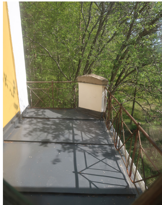
Balkong med balkongdörr i anslutning till klassrum i sydöstlig riktning.