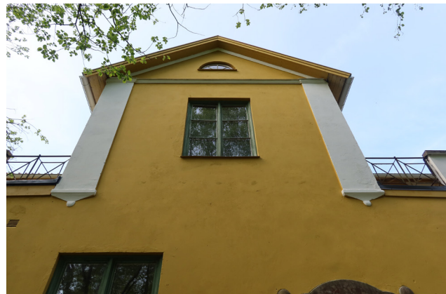
Till vänster kalkstensränna. Ovan trapphusets frontespis med gesims och lunettfönster.