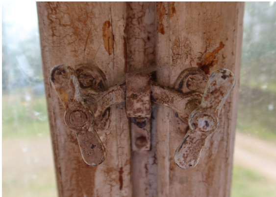
Ovn t.v. ett av skolans originalfönster . Nedan t. v. fönstervred i original. Ovan t.h. hörnstolpar vid dörr till klassrum med profileratde krön.