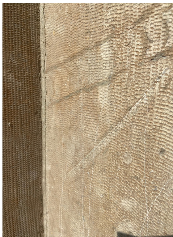
Bild ovan t.v. entré på östfasaden med rikt utsmyckad portik. T.h. närbild på tandhuggen yta.