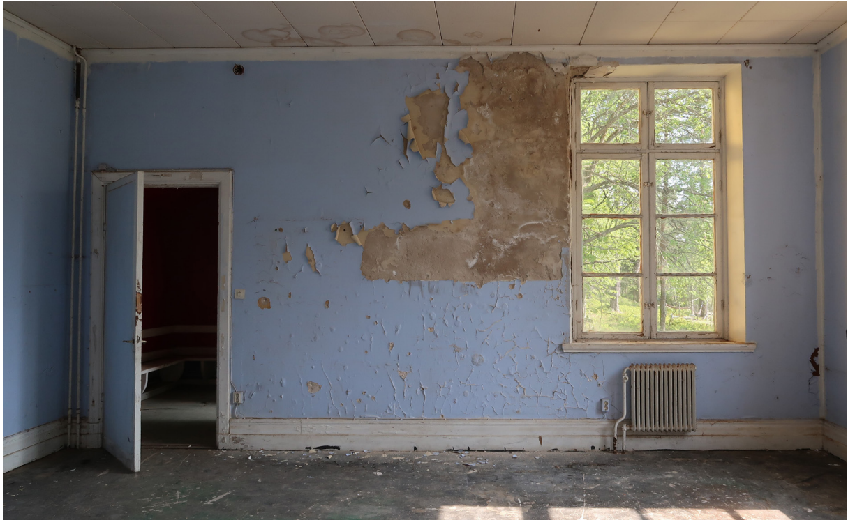
Klassrum mot sydöst.

Bilden nedan med kvarvarande nisch efter en kamin samt golvsöcklar som markerar var katederpodiet har varit.