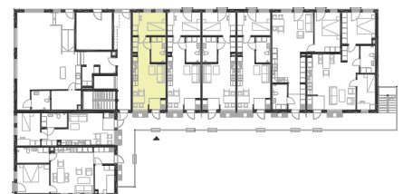
Lägenhetsplacering: Pilen visar entré till lägenhet.