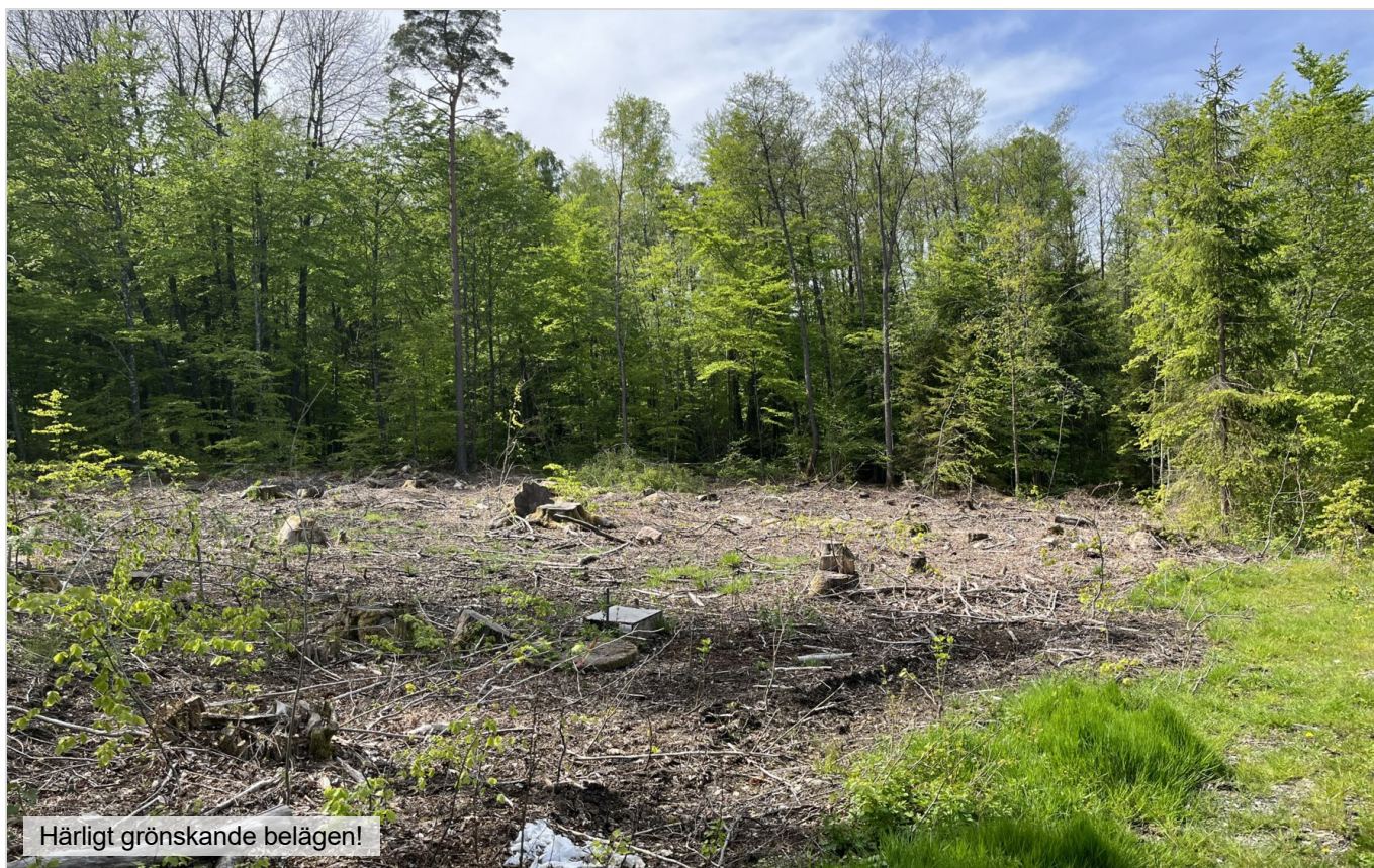
Härligt grönskande belägen!