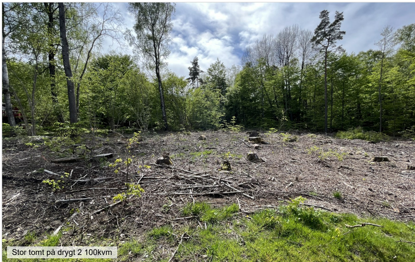
Stor tomt på drygt 2 100kvm