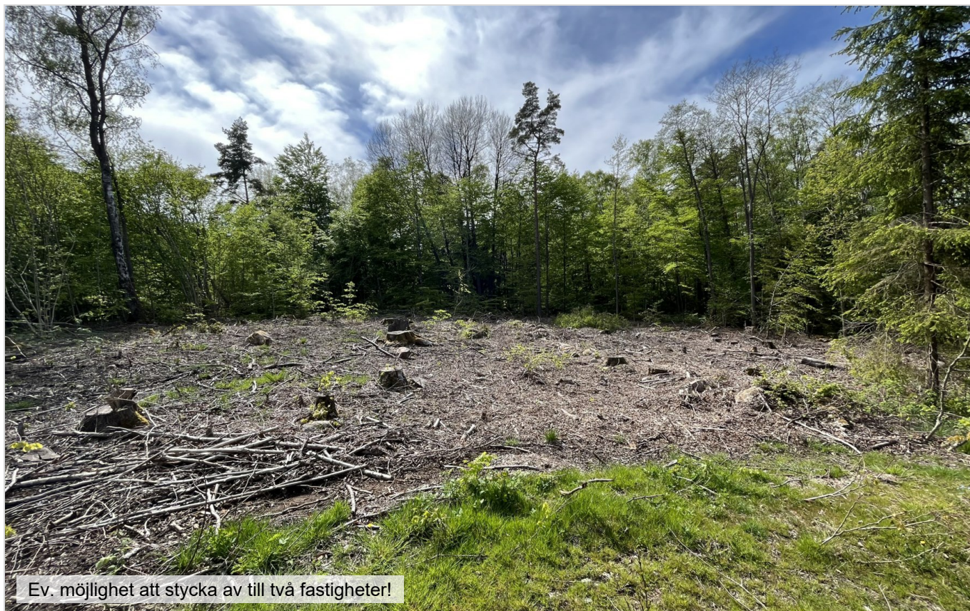
Ev. möjlighet att stycka av till två fastigheter!